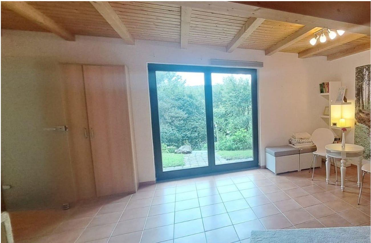
Wohnzimmer mit Terrassenzugang