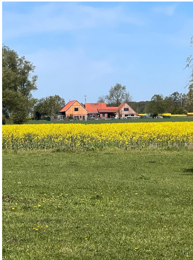
Blick auf den Hof