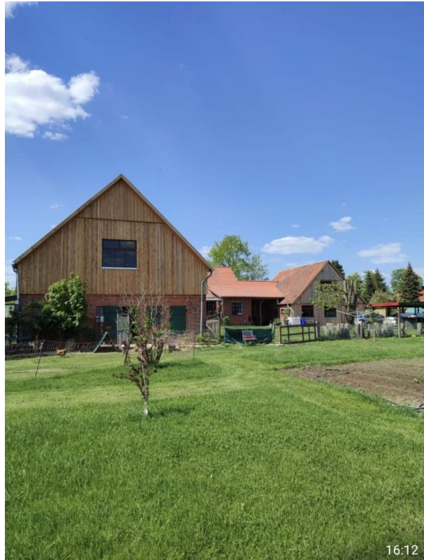
alle Giebel saniert