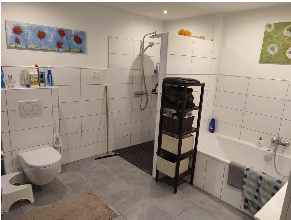
Grosses Badezimmer mit Wanne