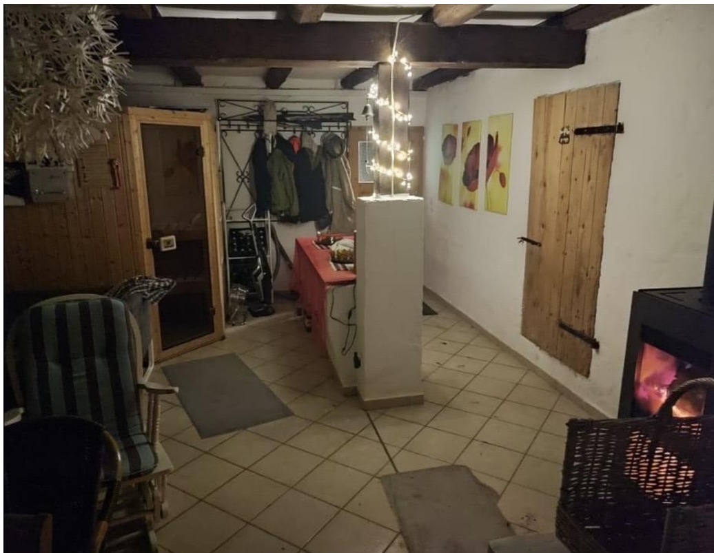
Hobbyraum mit Sauna Scheune