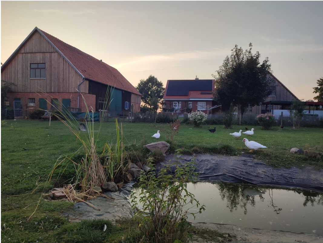
Blick von der Koppel Teich 2