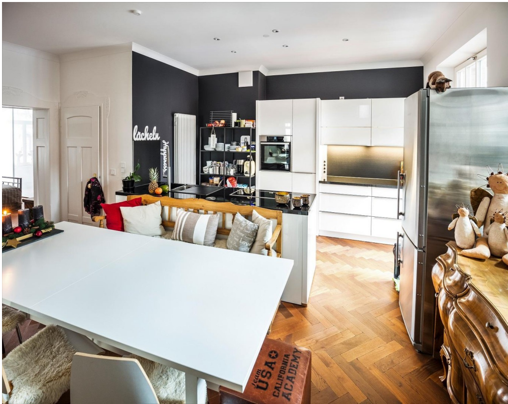
Wohnküche Blick beim Eintreten