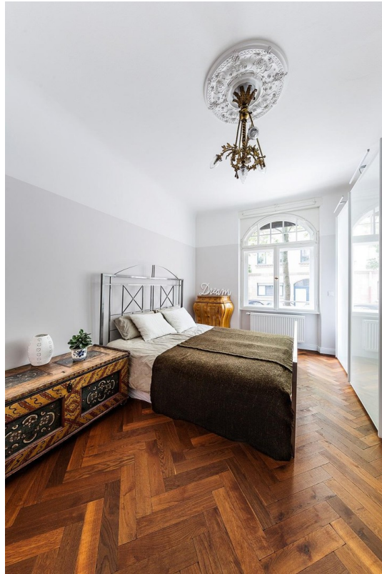
Schlafen m. Panoramaschrank