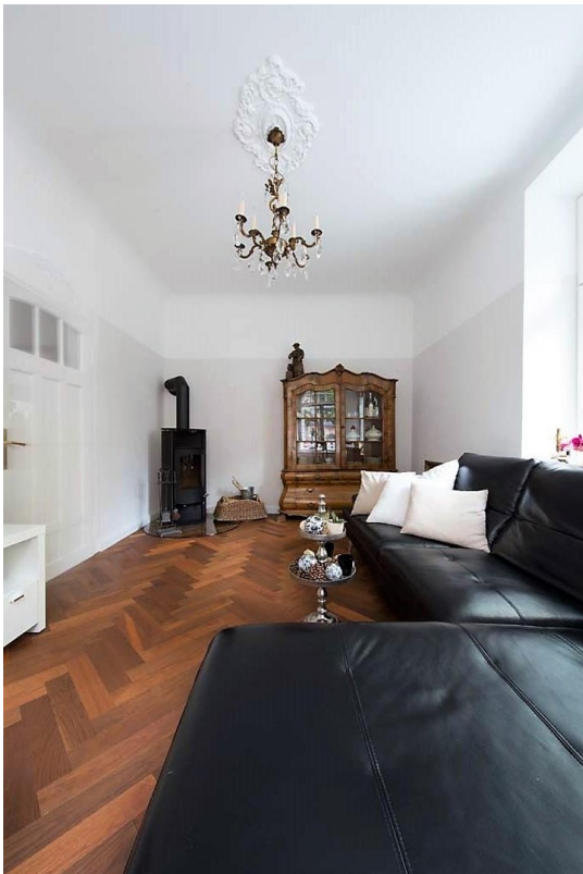
Wohnzimmer m. Speicherofen