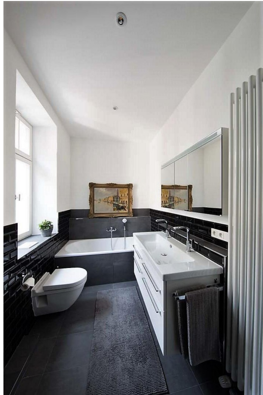
Bad m. Dusche, WC, Wanne