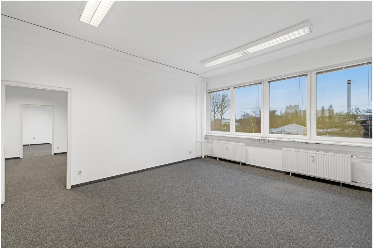
Bürofläche, 1. OG - 1