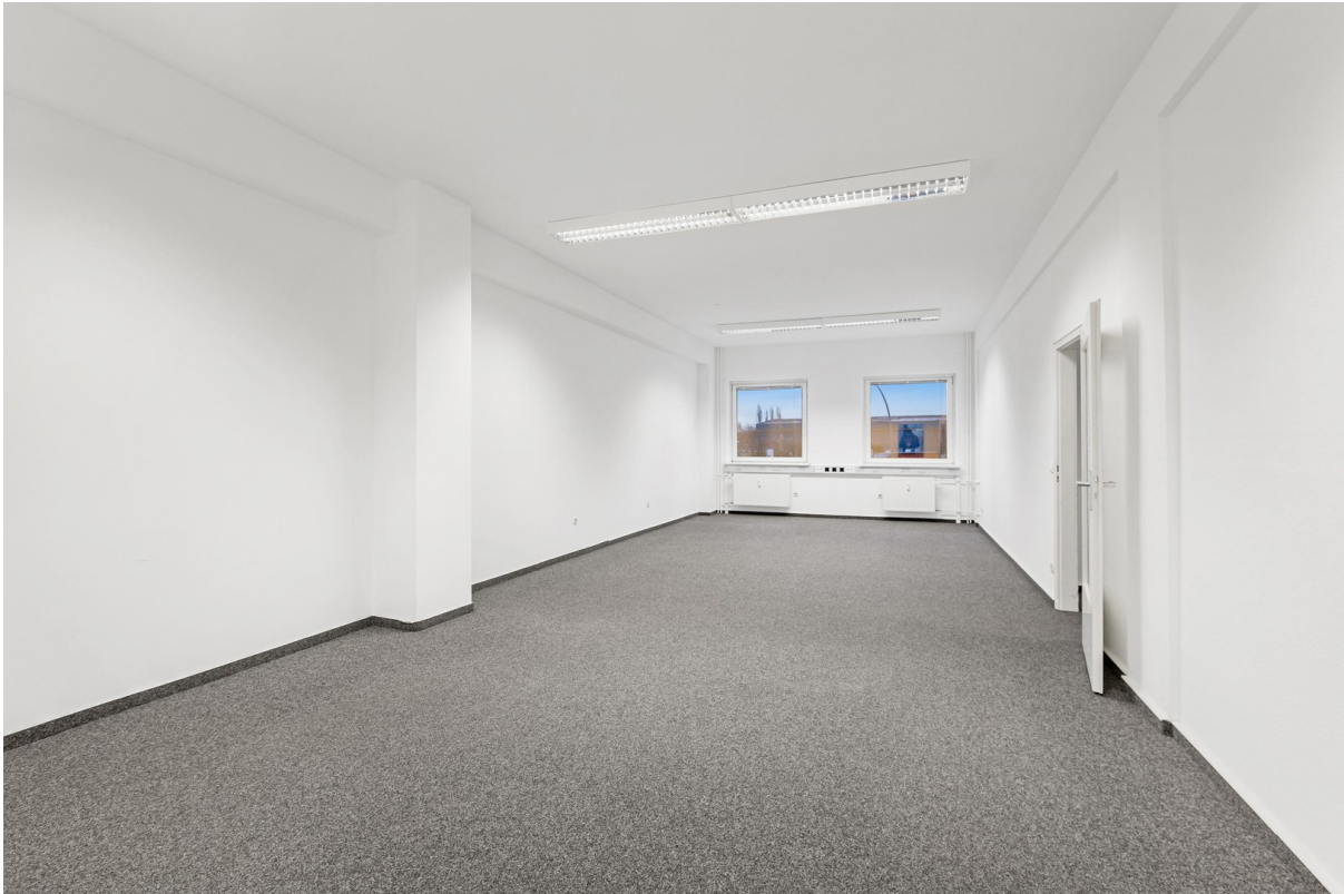
Bürofläche, 1. OG - 3