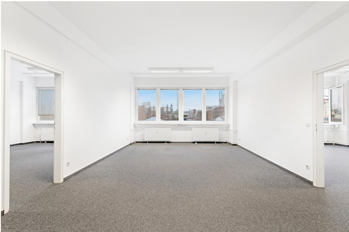
Bürofläche, 1. OG - 4