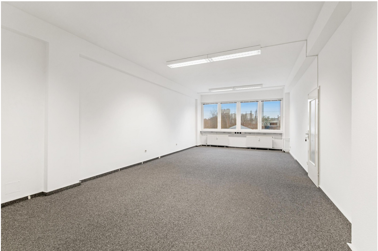
Bürofläche, 1. OG - 2