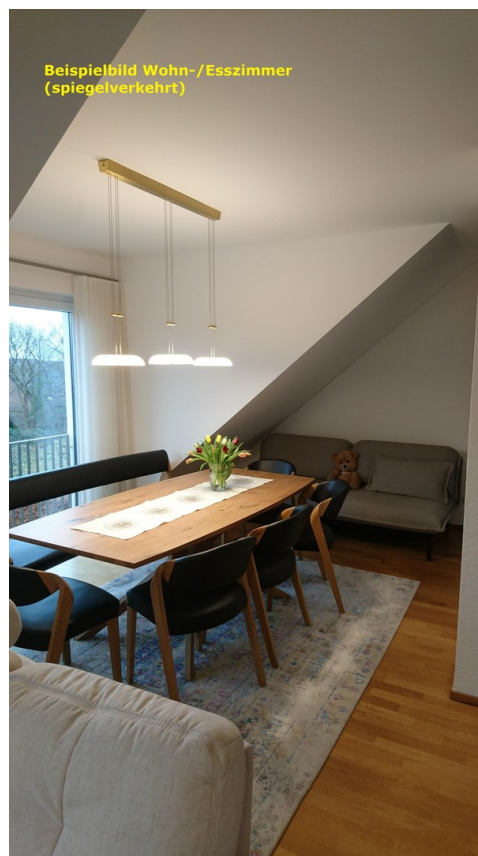
Beispiel Wohn-/Esszimmer (2)