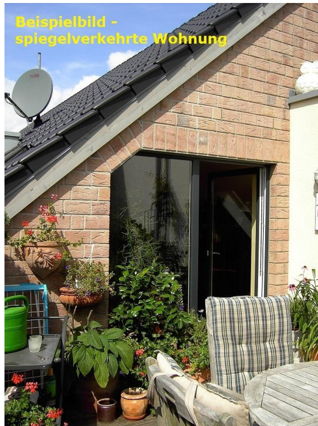
Beispiel Dachterasse (2)