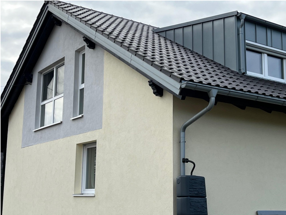
DG Wohnung (1. Etage)