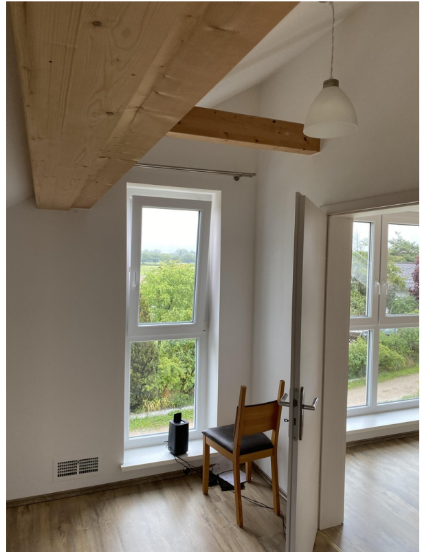
Schlafzimmer Nr 3