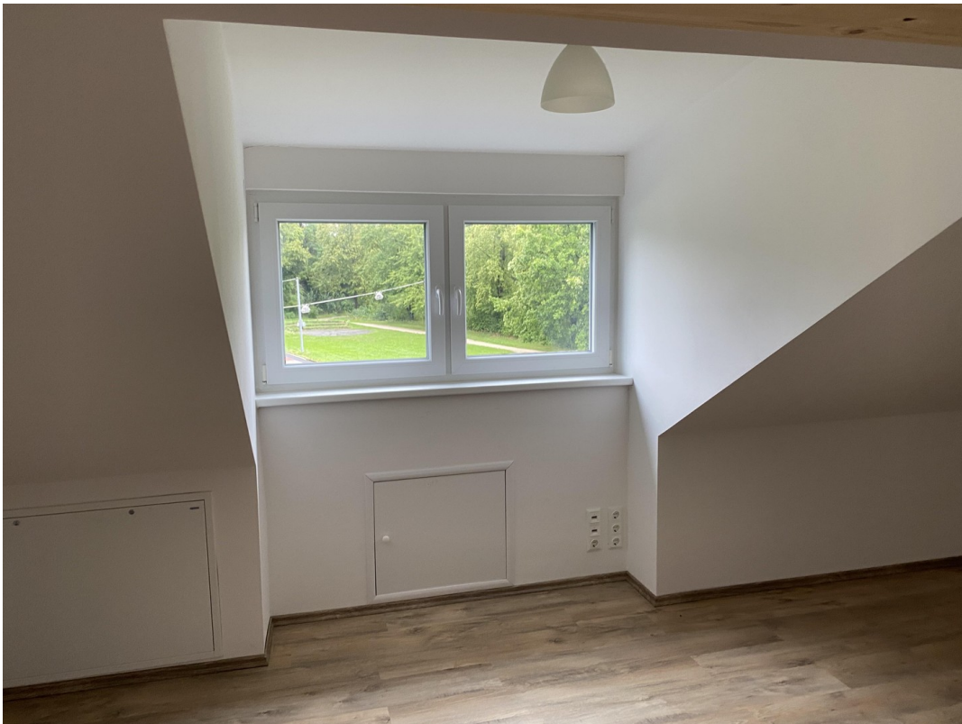
Schlafzimmer Nr 2