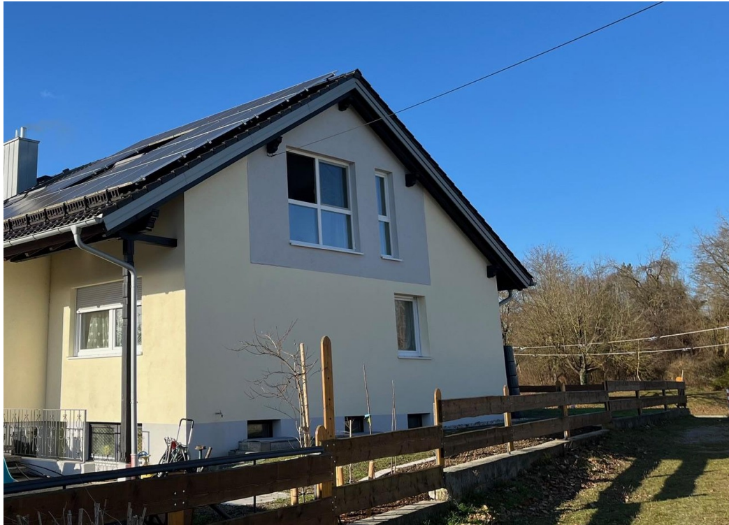
DG Wohnung (1. Etage)