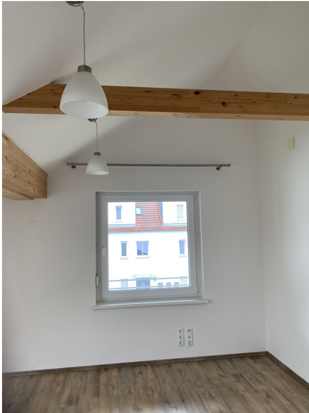
Schlafzimmer Nr 1