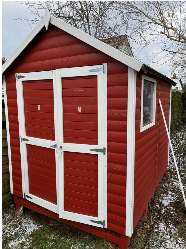
Gartenhaus ab 01.04.2025