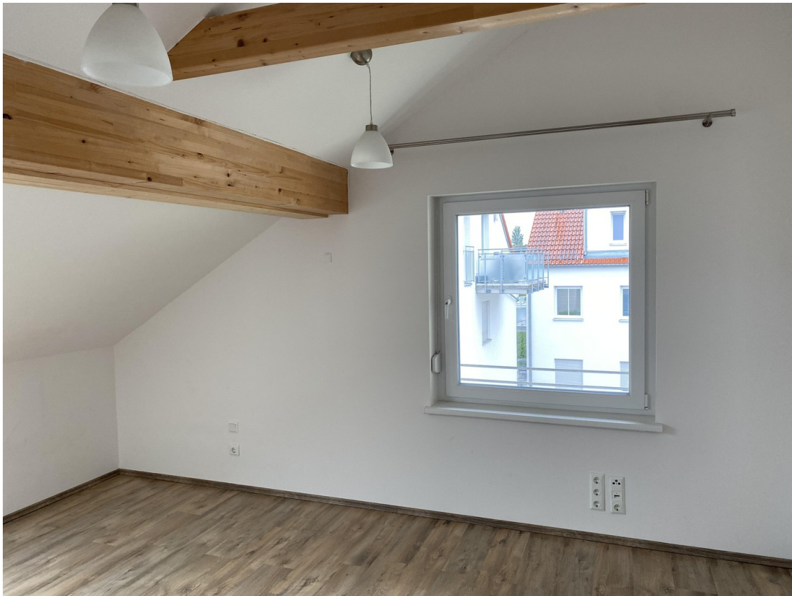
Schlafzimmer Nr 1