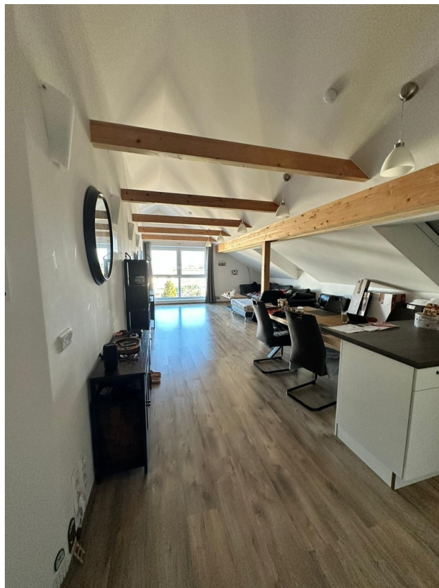
Wohnzimmer (aktuelle Mieter)