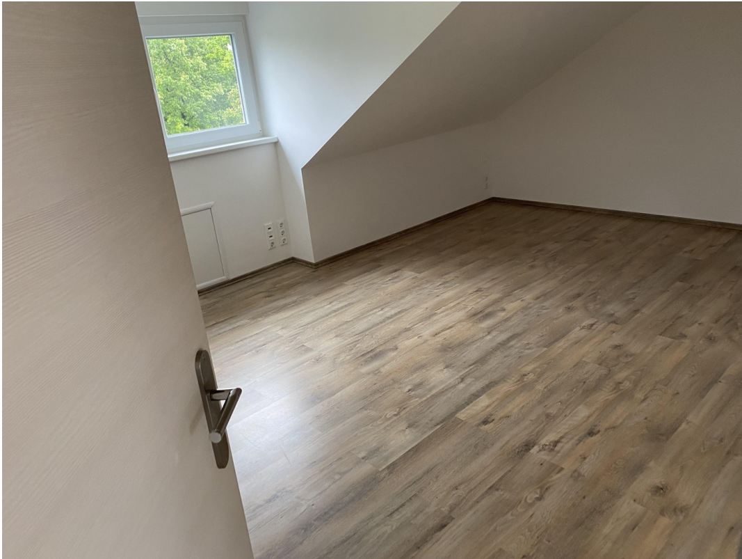
Schlafzimmer Nr 3