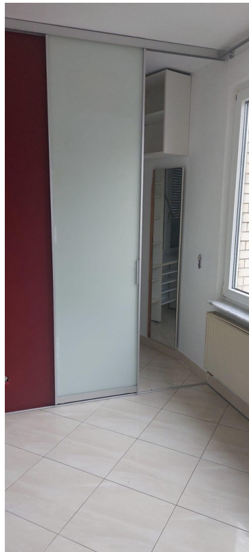
Durchgang begehbaren Schrank