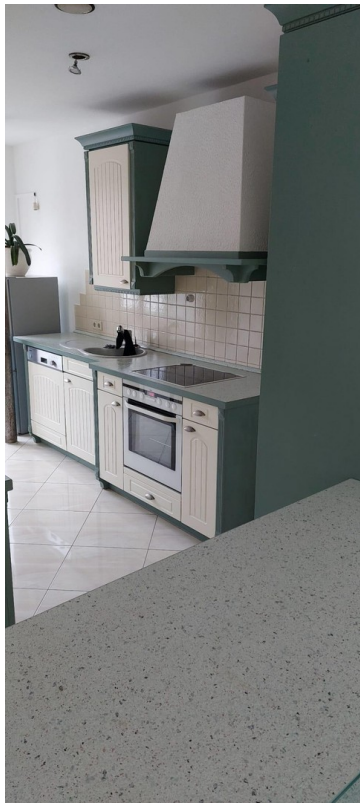
Alno Landhausküche Herd