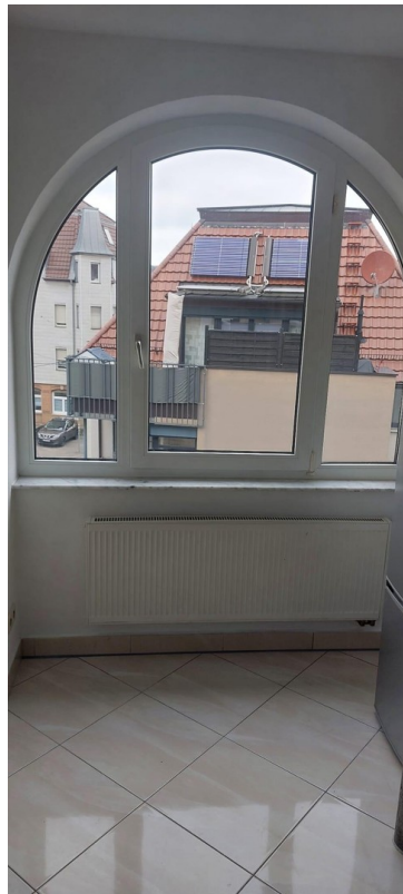
Ausblick Küche, grosses Rundfe