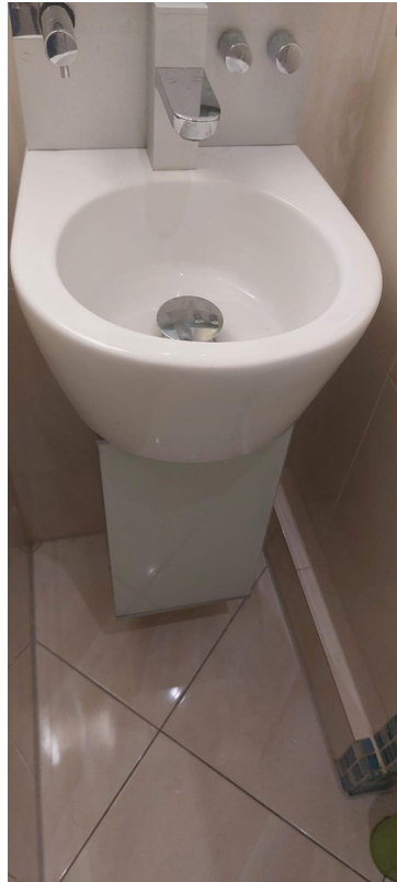
WC + Waschbecken