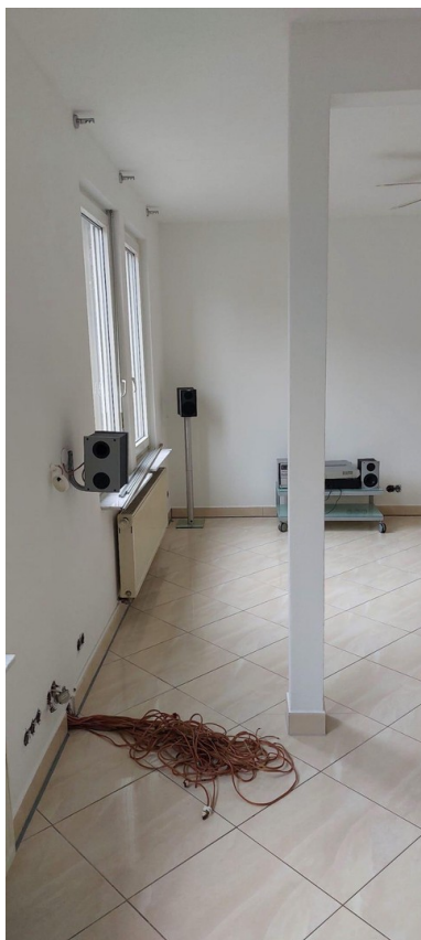
Wohnzimmer, Verkabelung Dolby