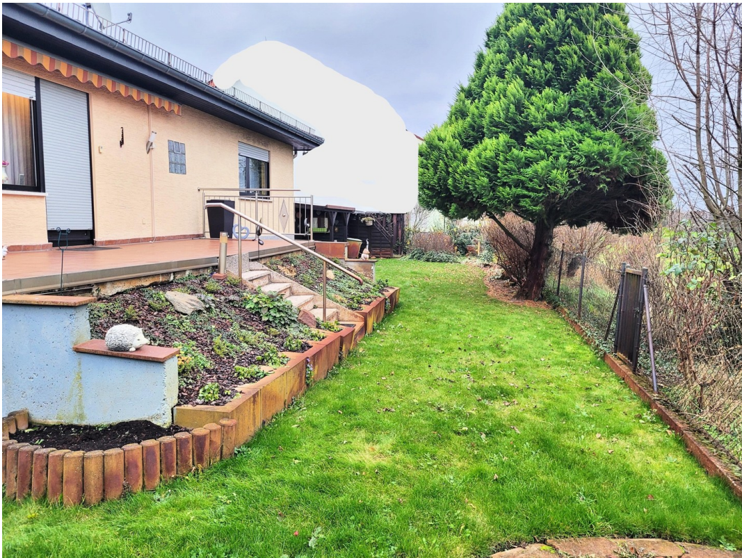
Garten mit Terrasse