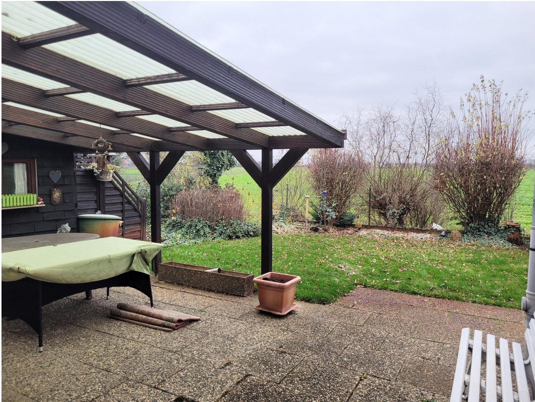
Blick vom Sitzbereich