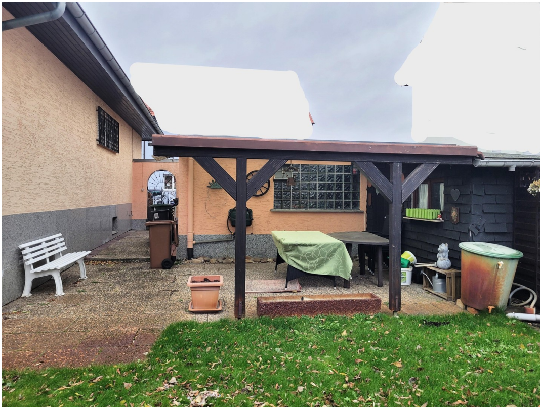
Sitzbereich hinter Garage