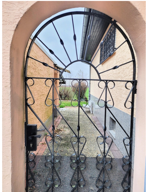
Blick zwischen Garage und Haus