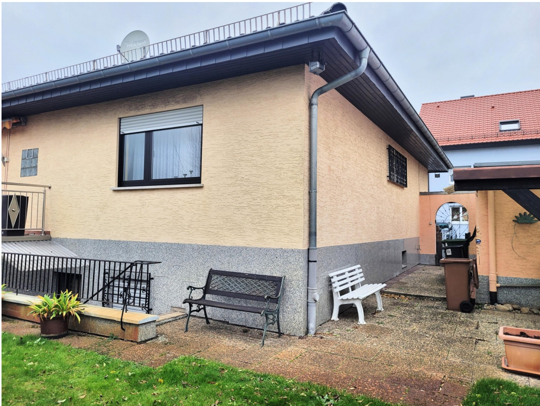
Linke Hausseite vom Garten aus