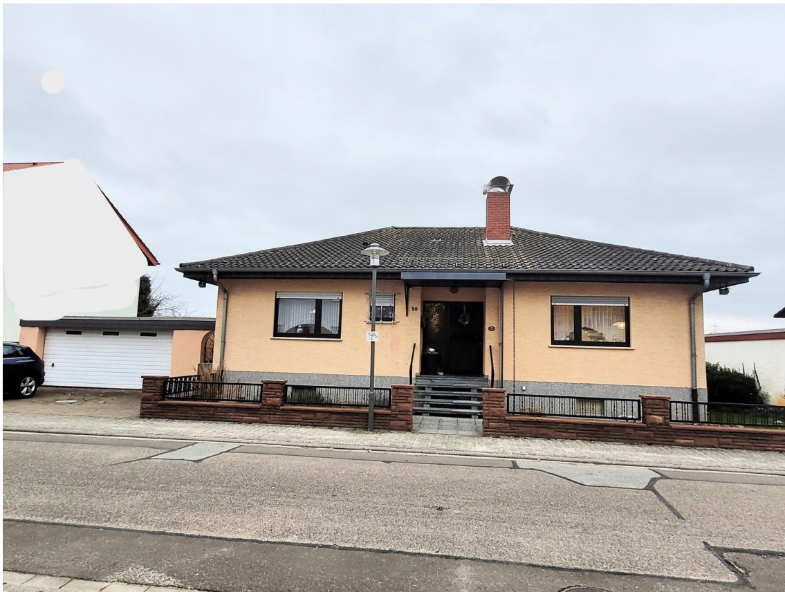
Hausfront mit Garage