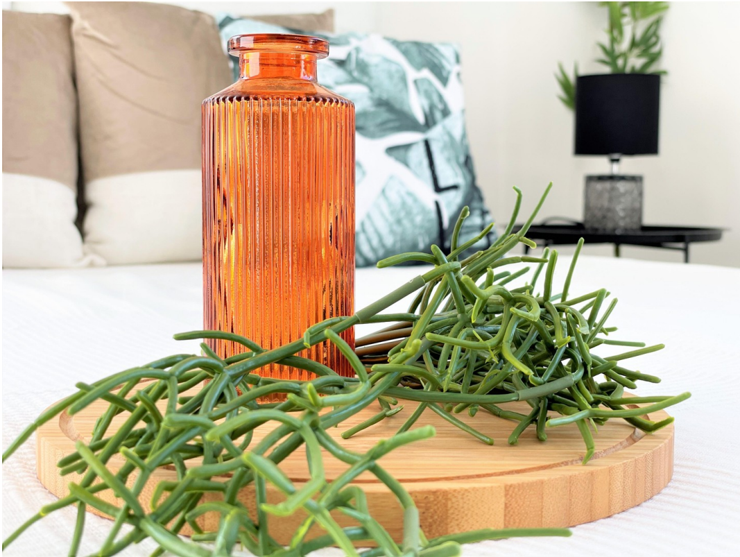
10 Schlafzimmer Deko