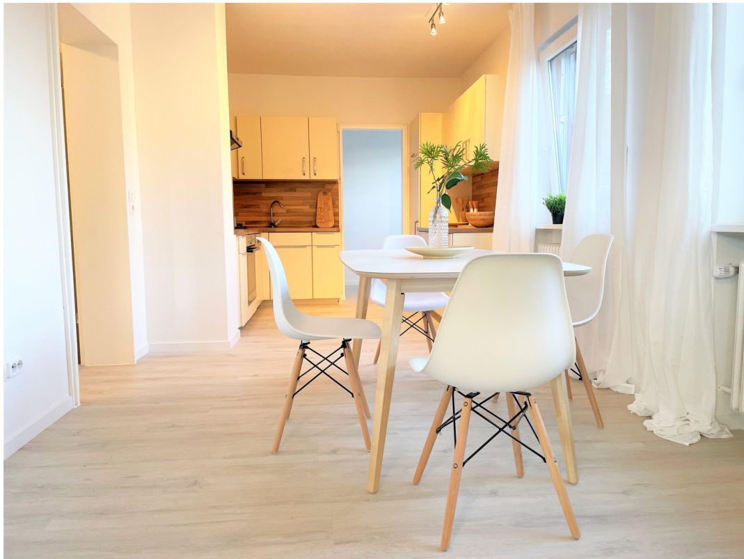
05 Offenes Esszimmer und Küche