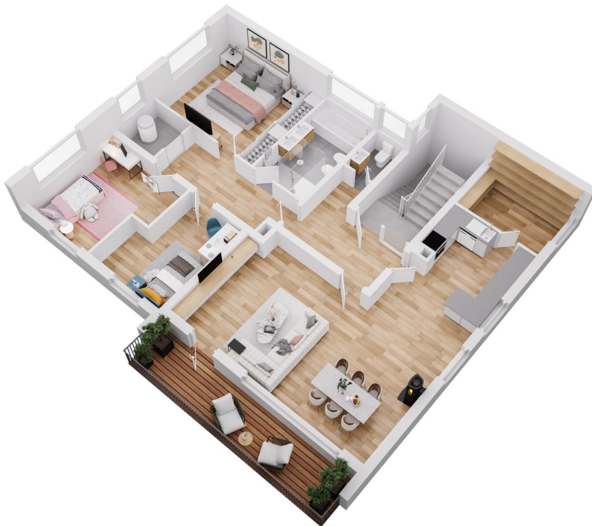
14 3D Grundriss