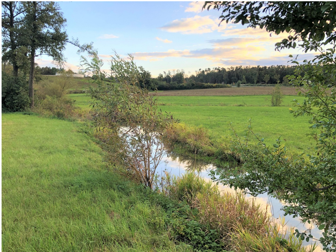
16 Natur Joggingstrecke