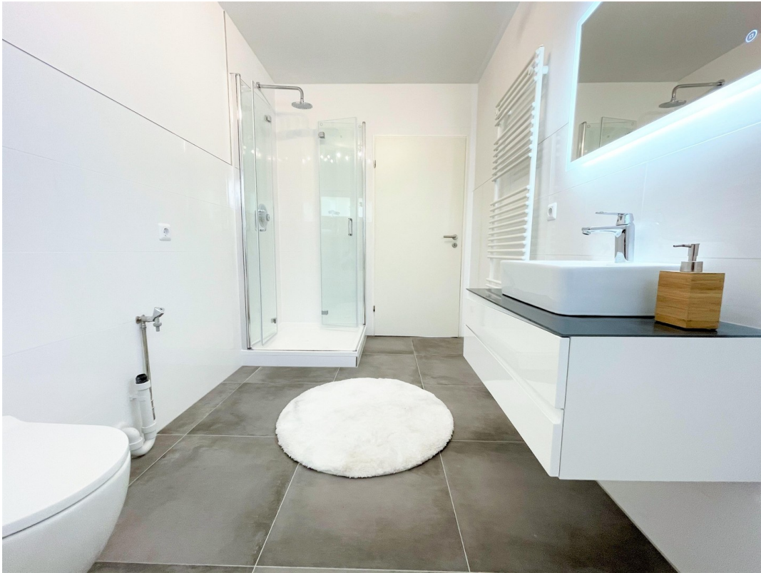
03 Badezimmer mit Dusche