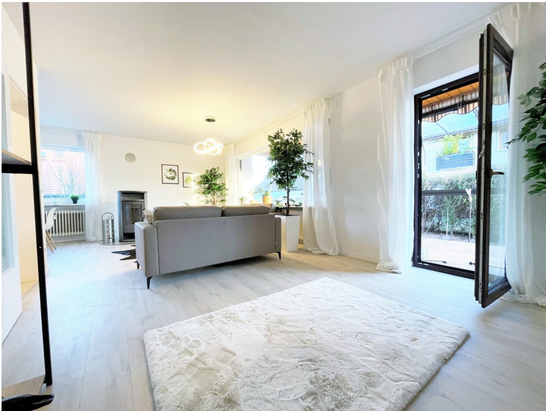
04 Wohnzimmer mit Balkon