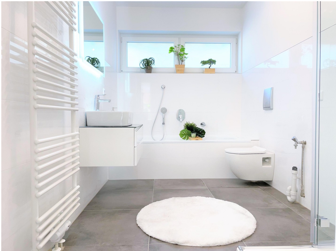
02 Badezimmer mit Badewanne