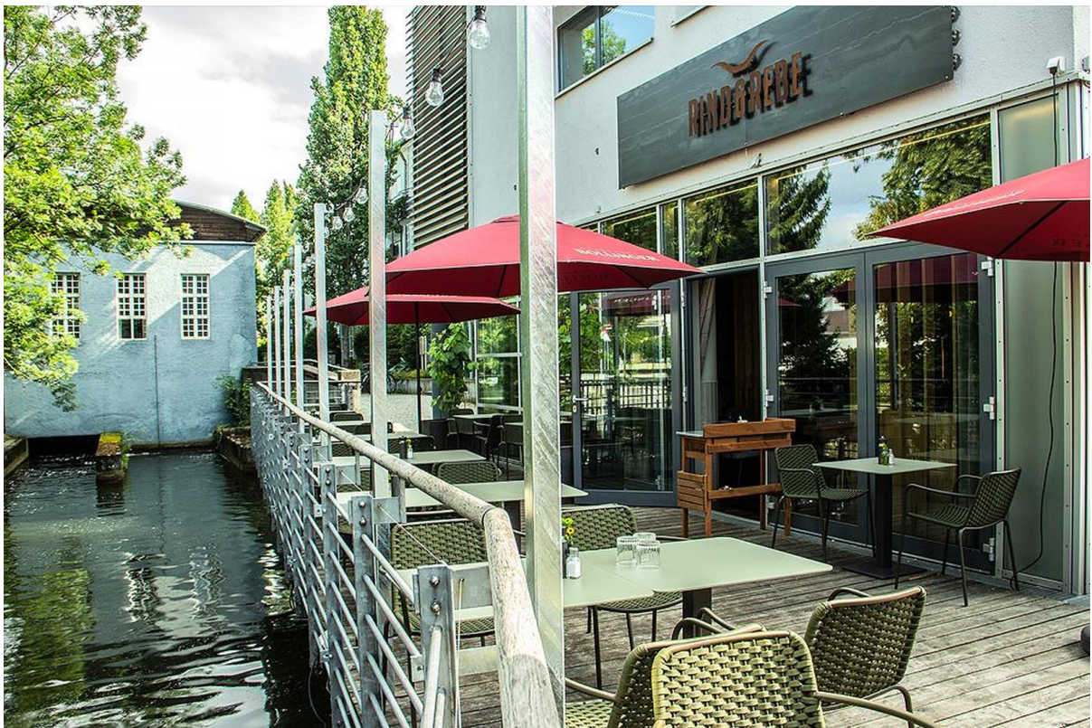
Terrasse am Gröbenbach