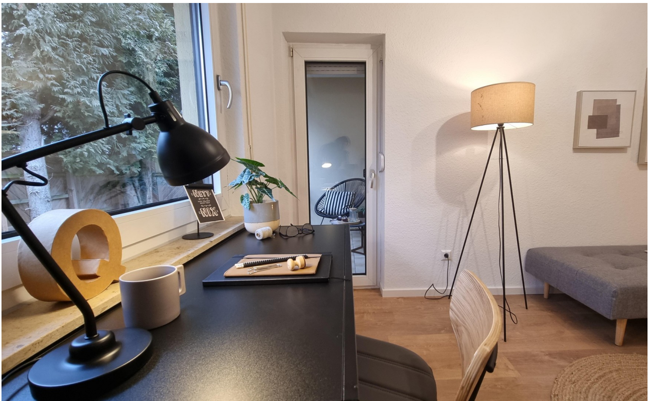
... mit Zugang zum 2. Balkon