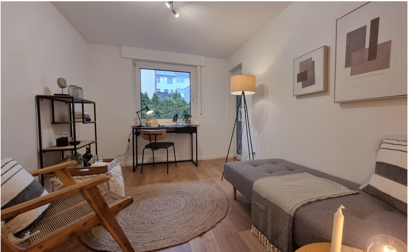
Zweites Schlafzimmer ...