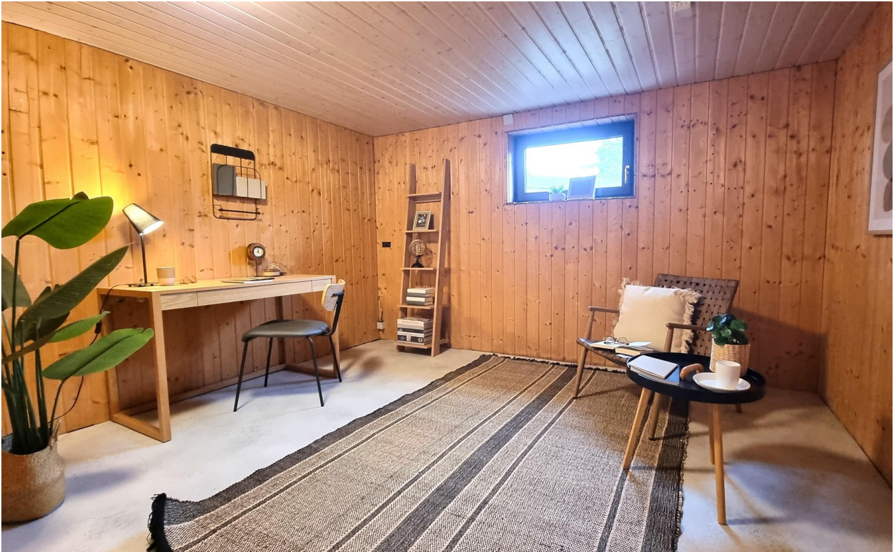
Hobbyraum im Keller mit...