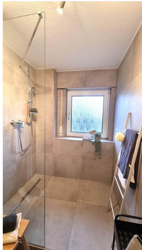
... mit geräumiger Dusche