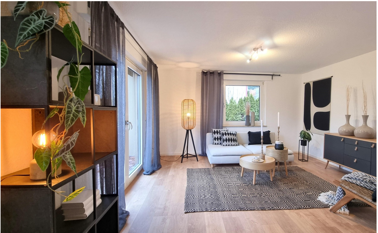
... mit Zugang zum Balkon ...