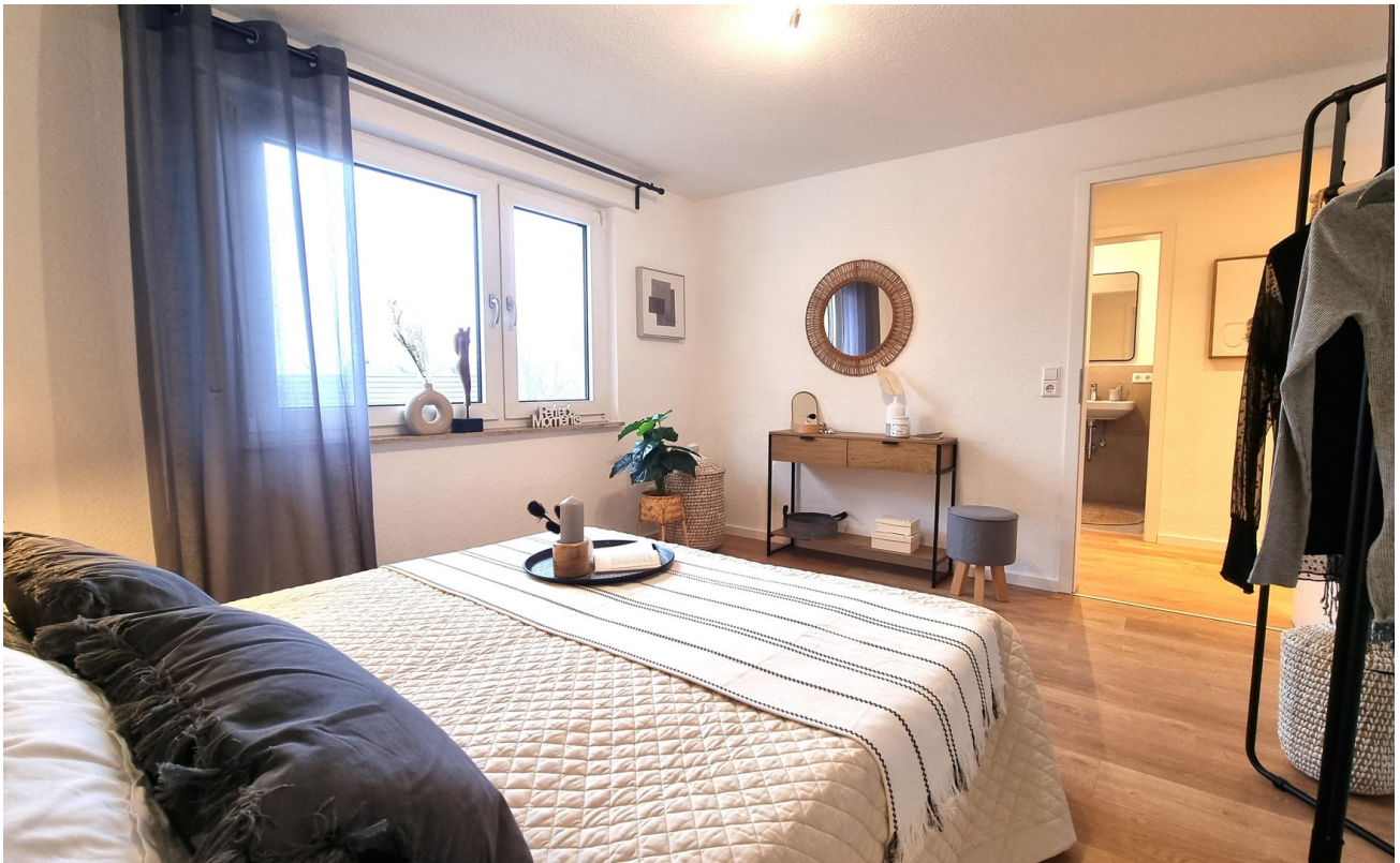
... Platz zum Zurückziehen ...