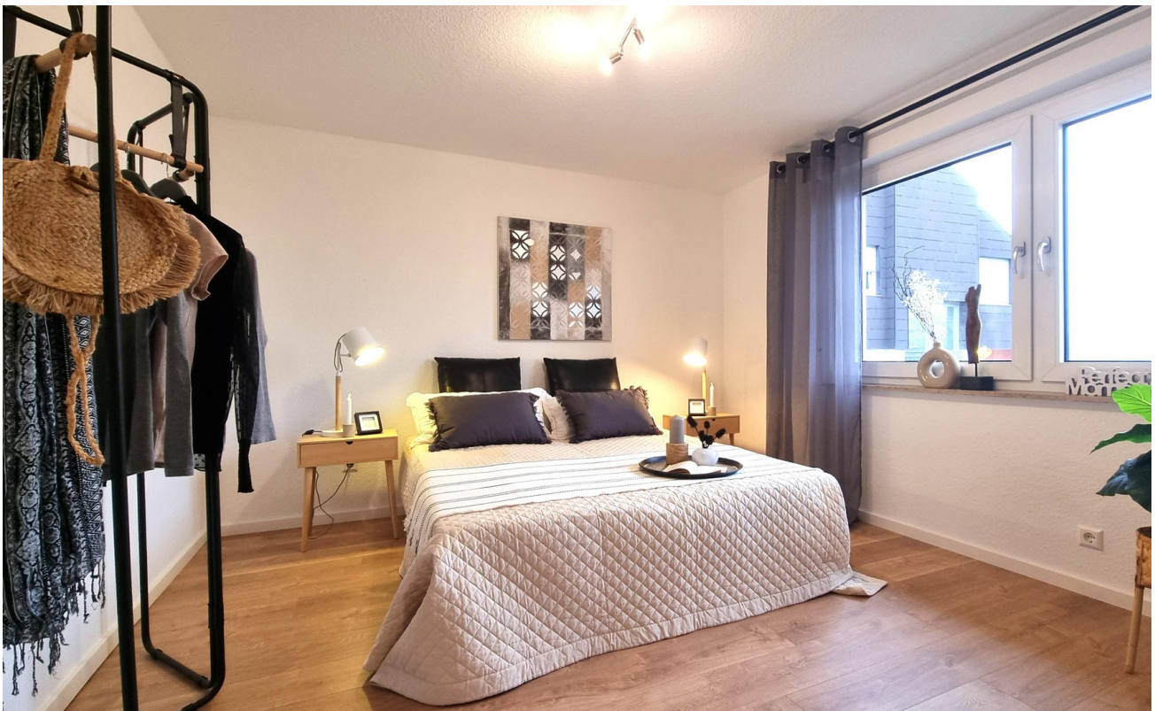
Großes, helles Schlafzimmer...