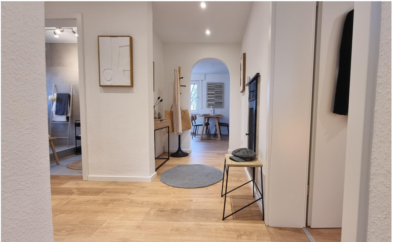
... aus verschiedenen ...