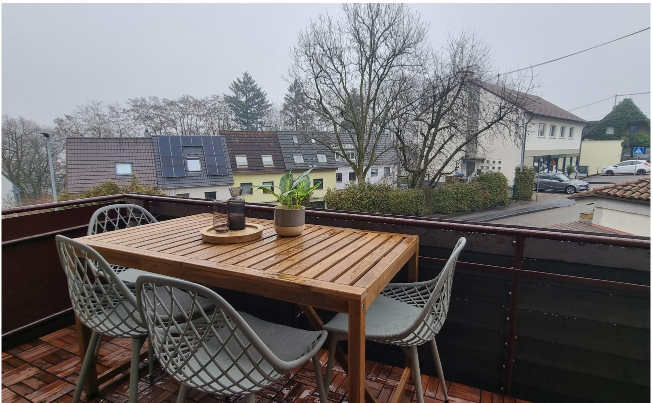
Balkon № 1 ...