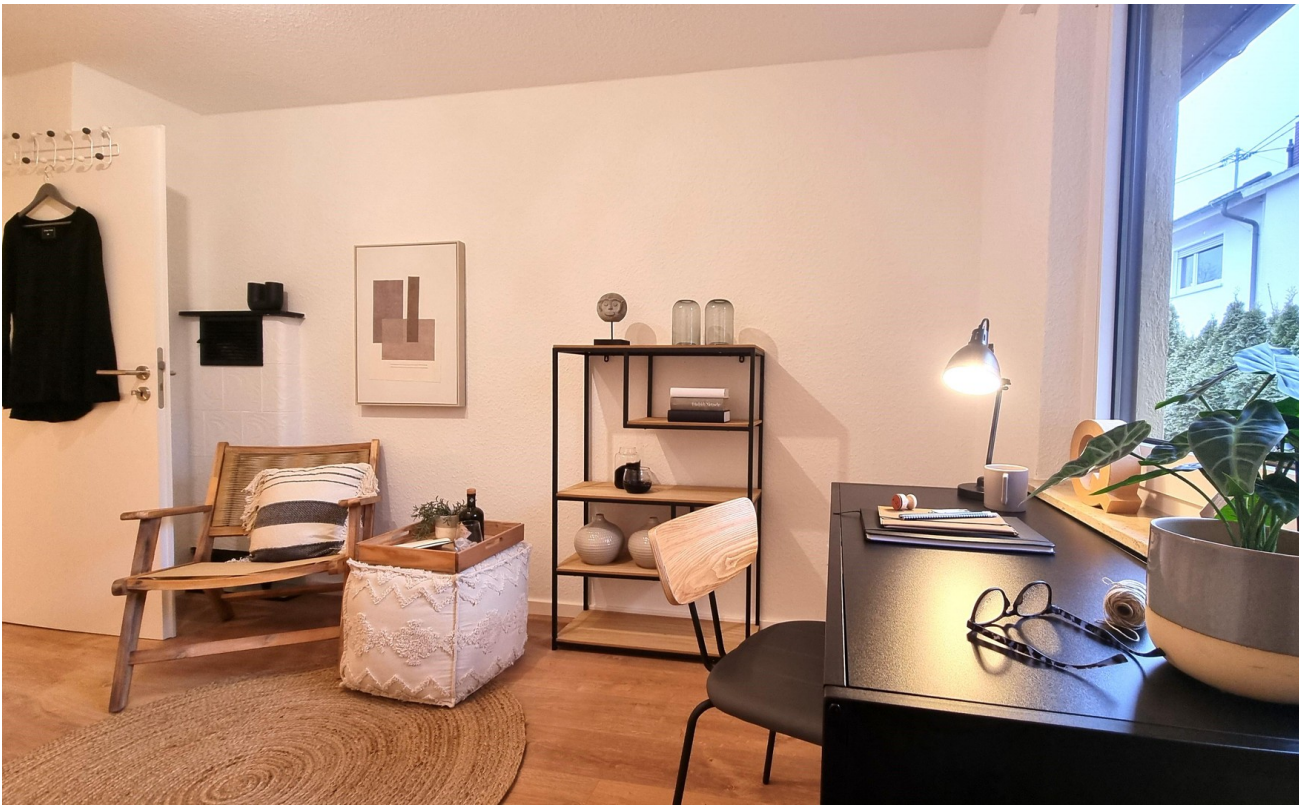
... oder Büro ...