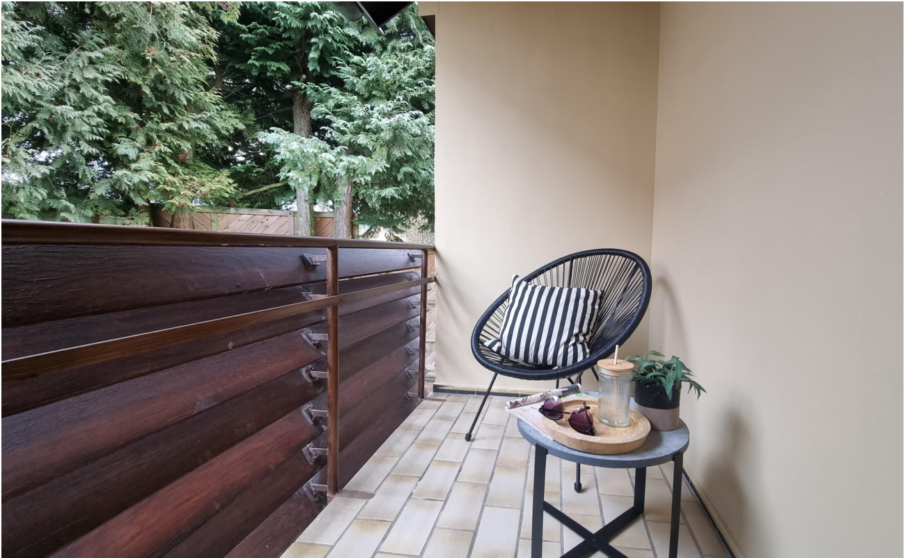
Balkon № 2 für kleine Pausen