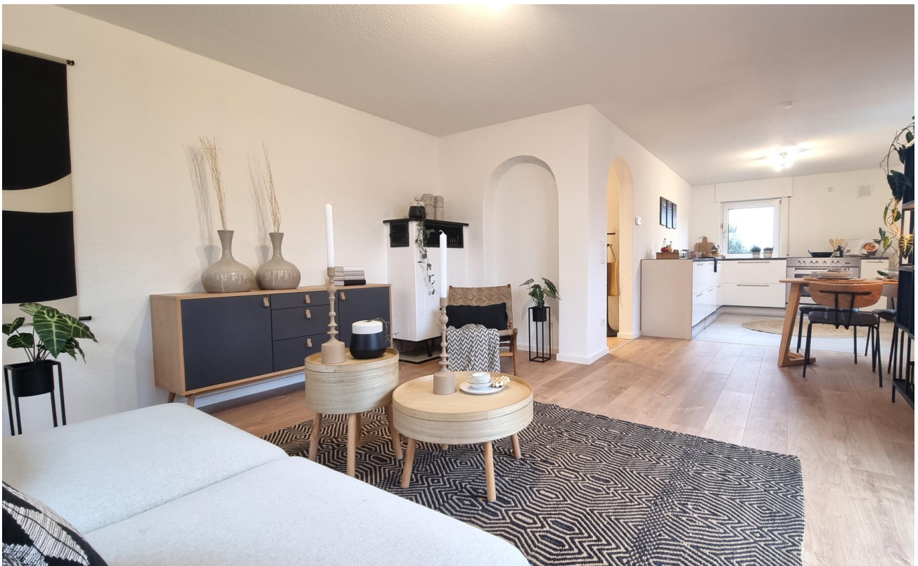
Der großzügige Grundriss ...