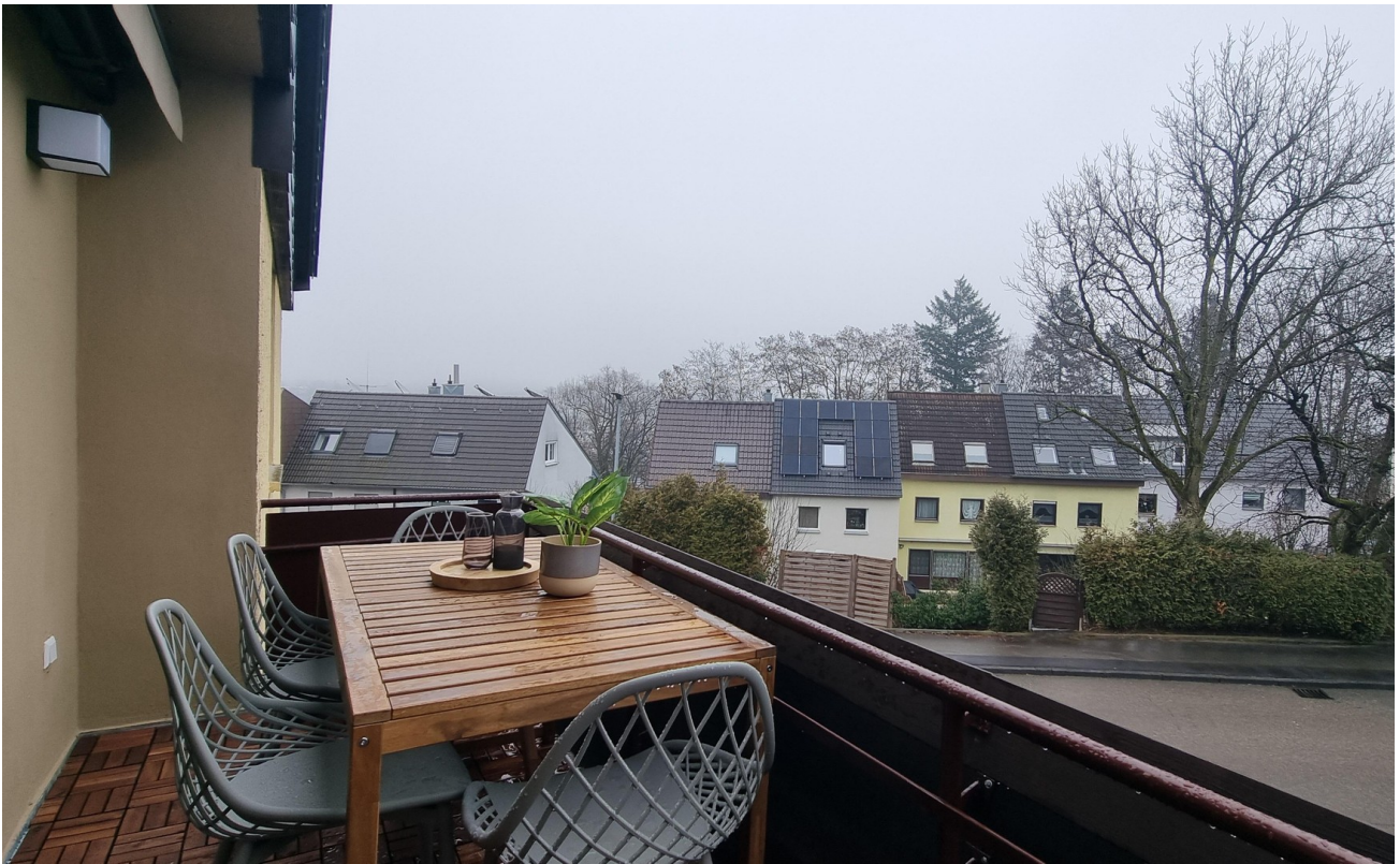
... vom Wohnzimmer zu betreten