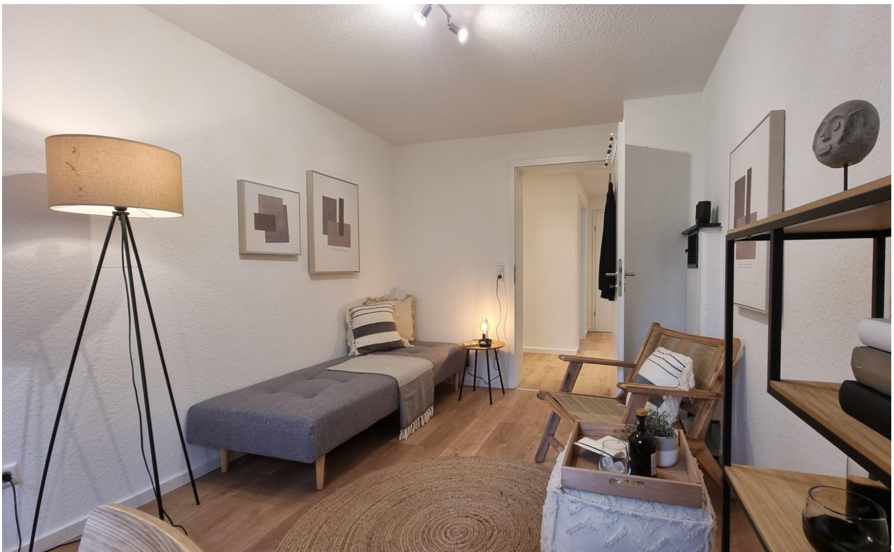
... oder Kinderzimmer ...