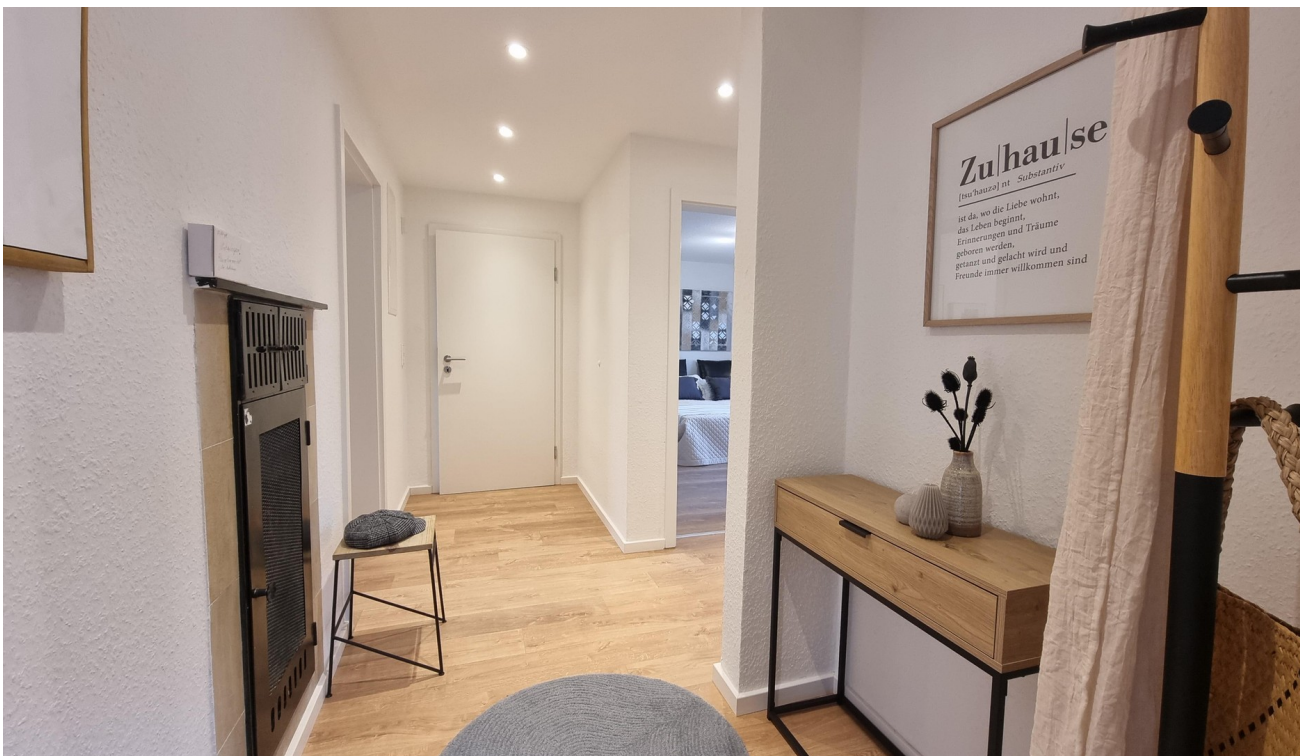
Blick in den Flur...