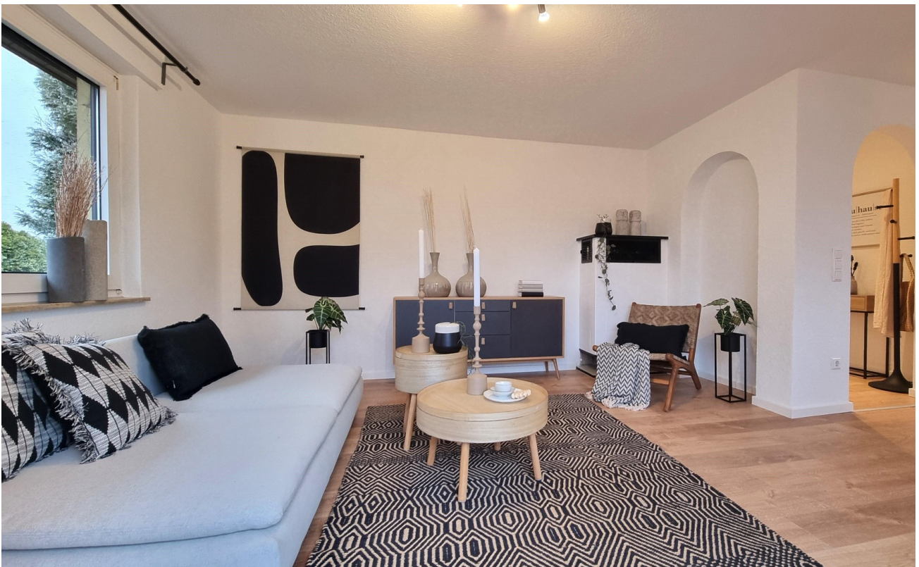
... verschafft Wohlfühlgefühl