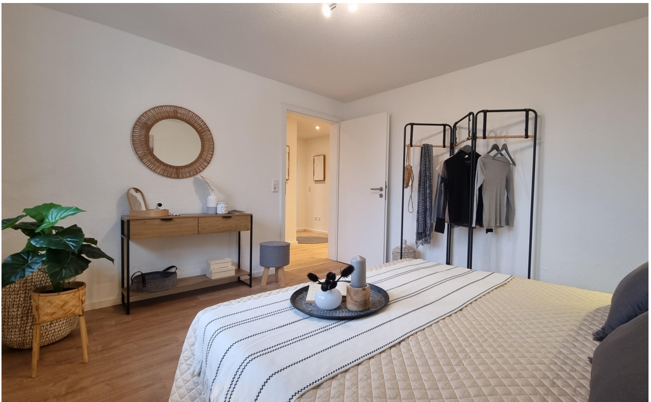
... und Ruhe genießen