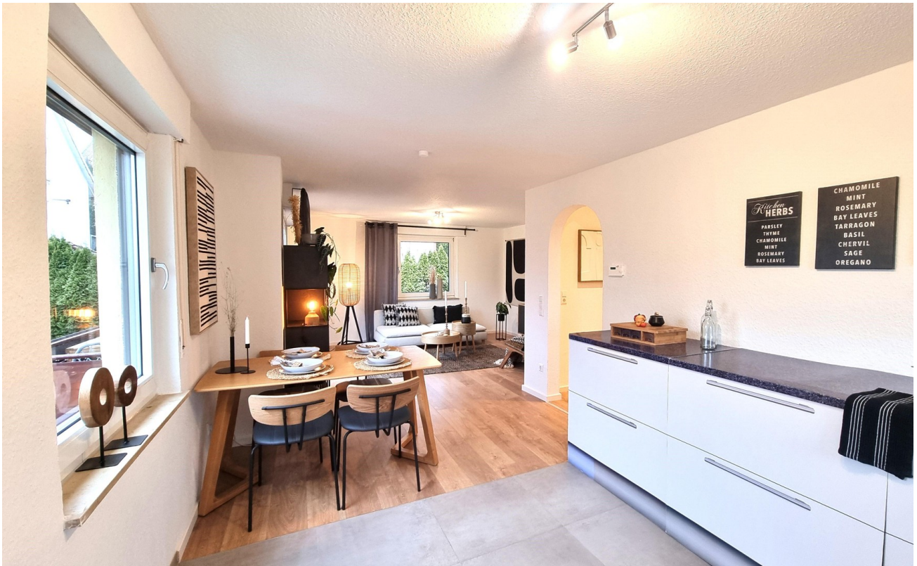
... lässt Raum für Gestaltung