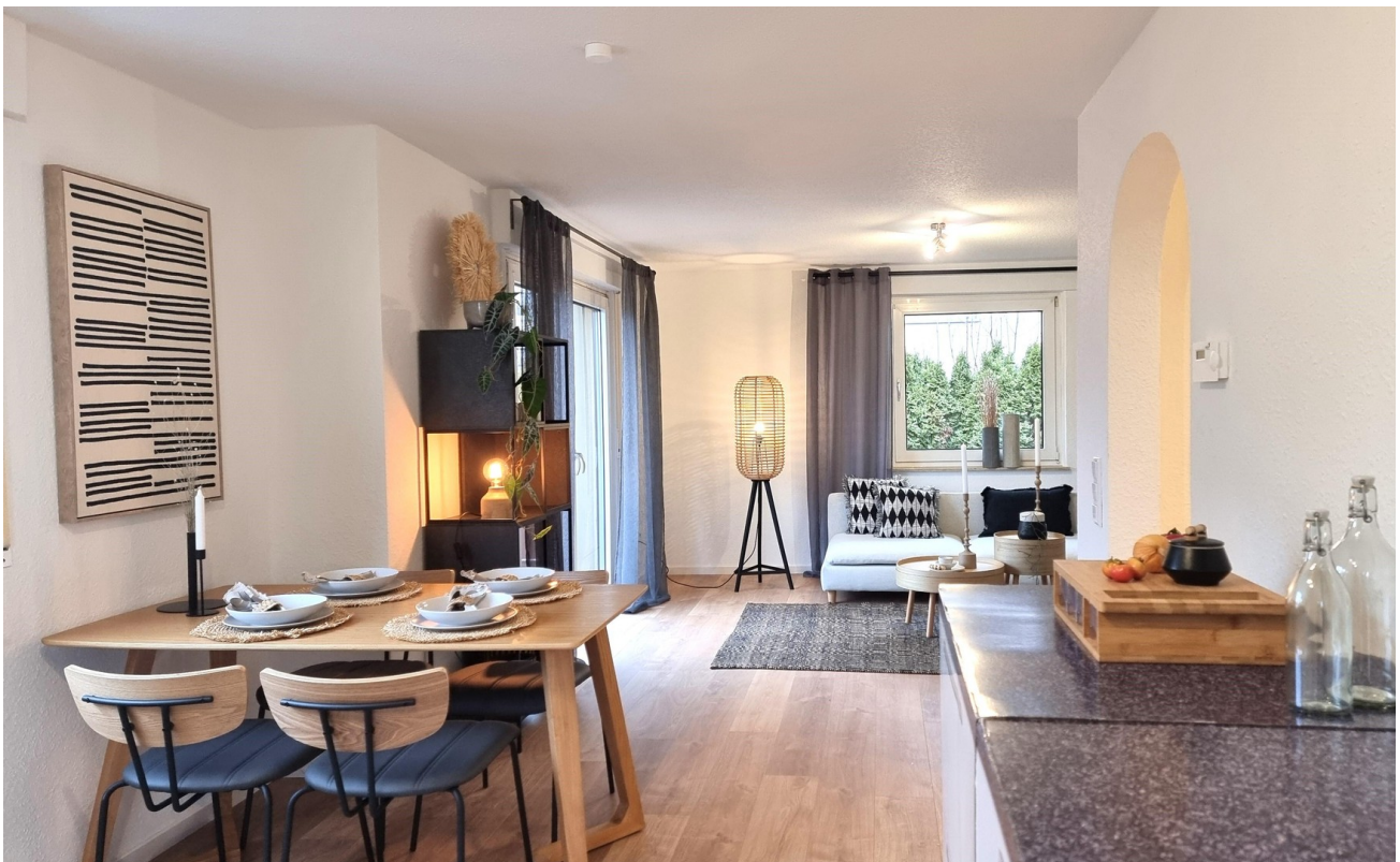
... verschafft Nähe und ...