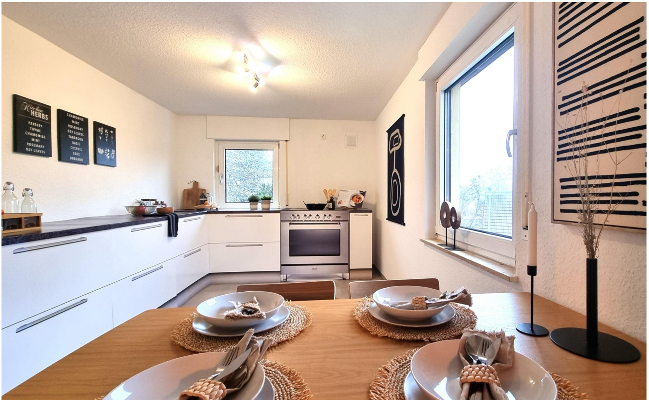
... gemütliches Beisammensein