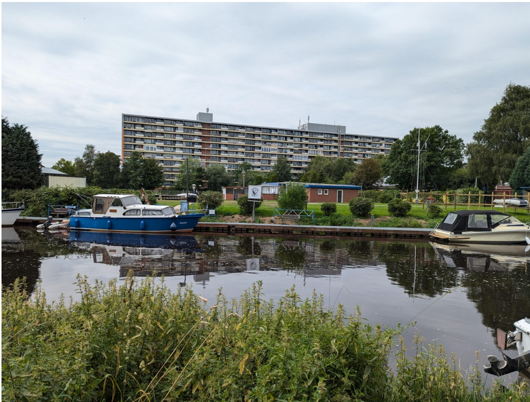
Blick vom Hafen/Kanal