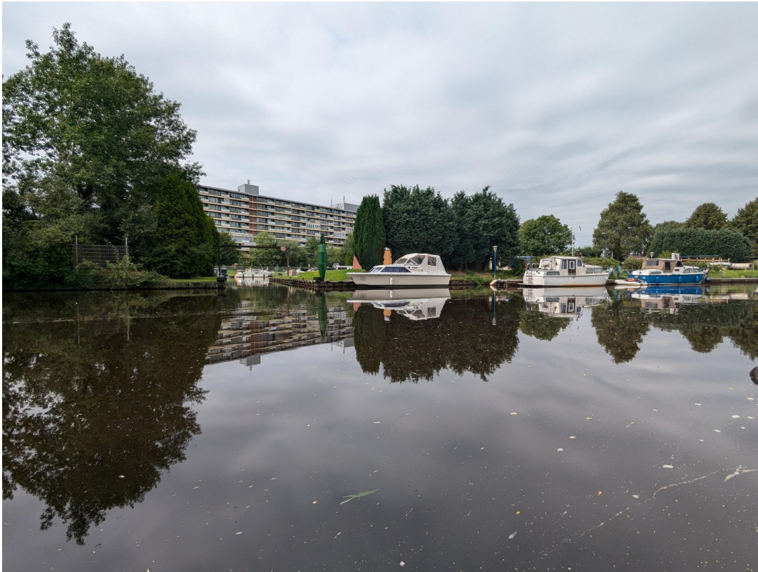
Blick vom Hafen/Kanal