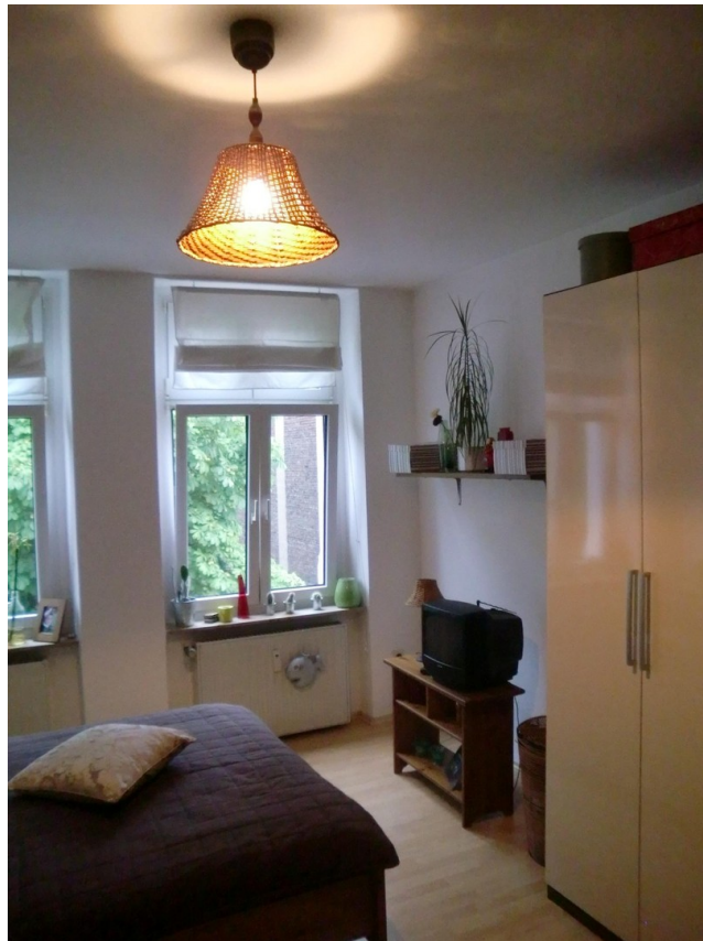
Schlafrum Bild 2