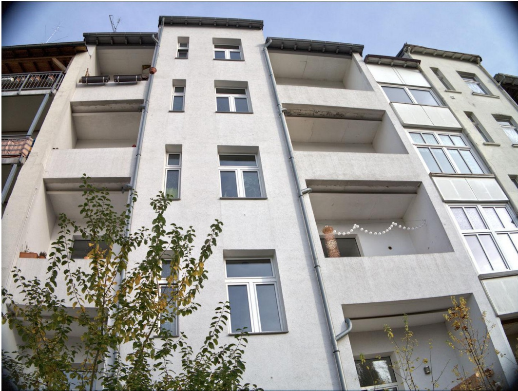
Rückansicht mit Balkon