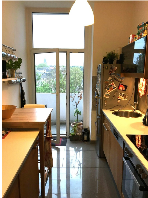
Küche mit Ausgang zum Balkon