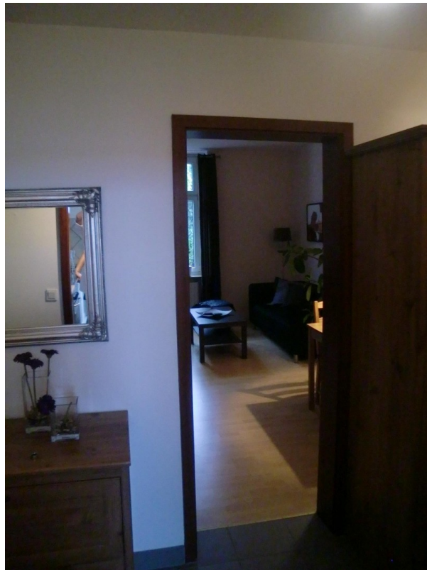
Diele mit Blick in Wohnraum