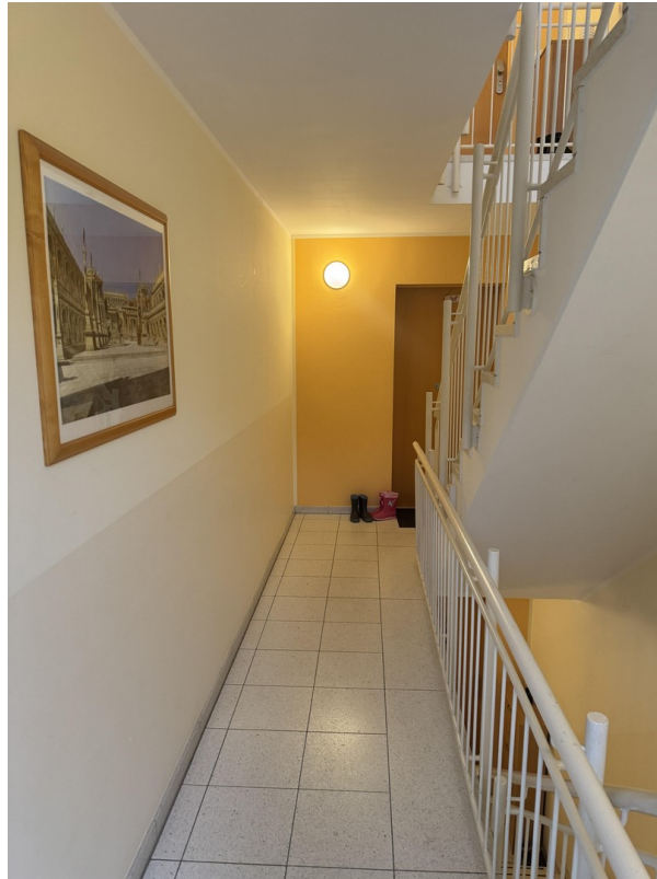
TH 1. OG