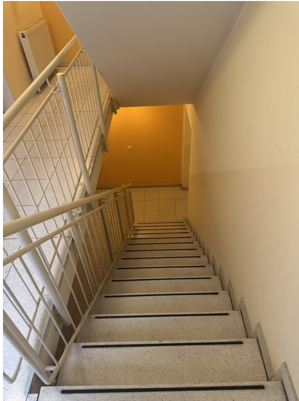
TH zum Keller