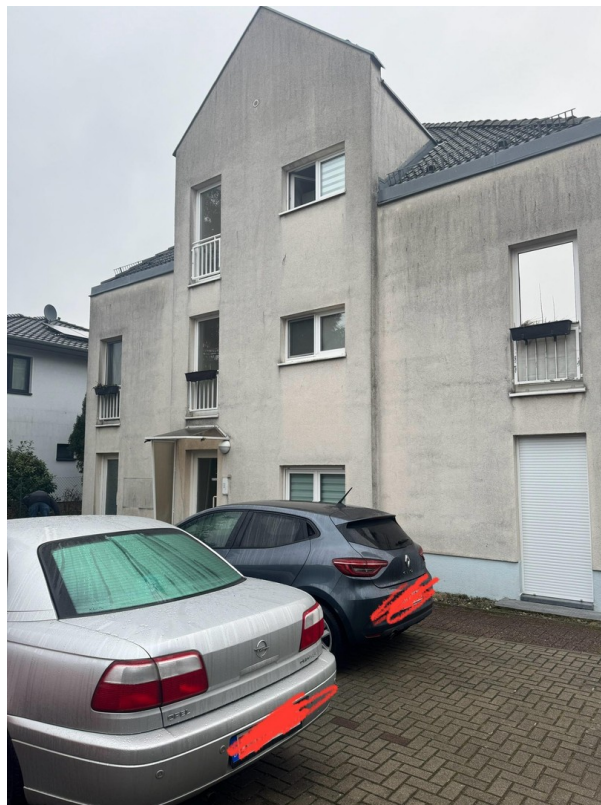
Hausansicht II Eingang