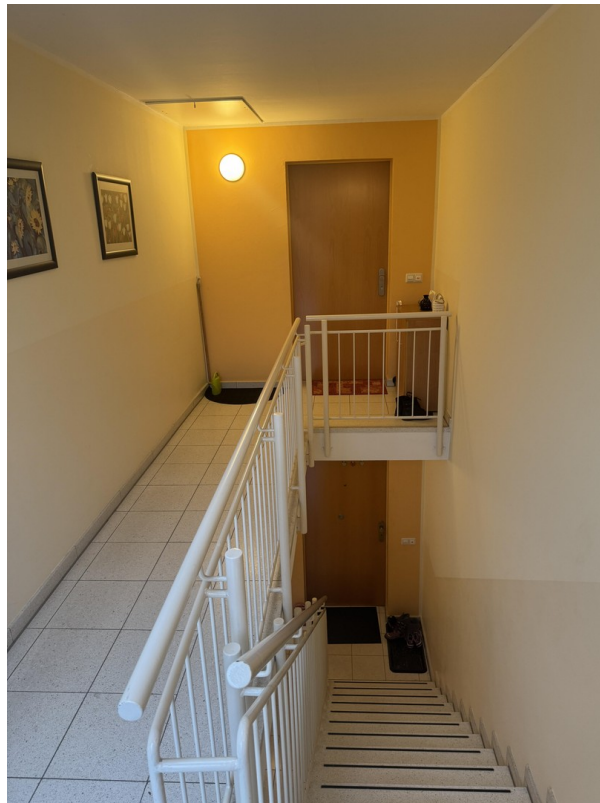
TH 2. OG