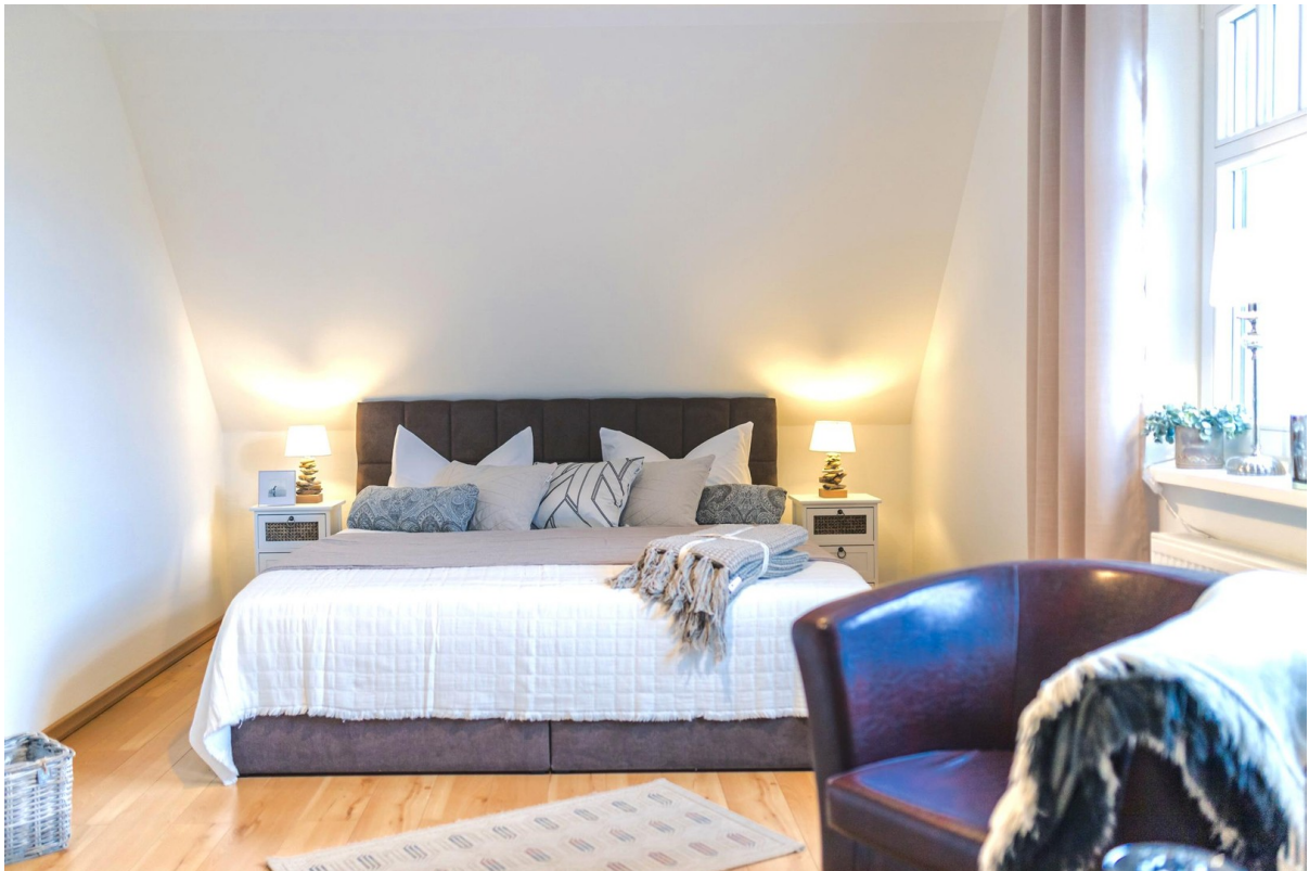
2. Schlafzimmer im OG