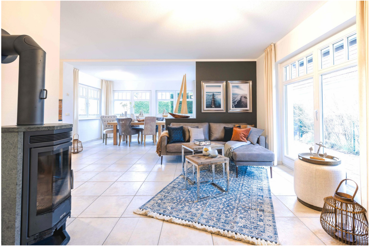
Wohnbereich mit Kamin