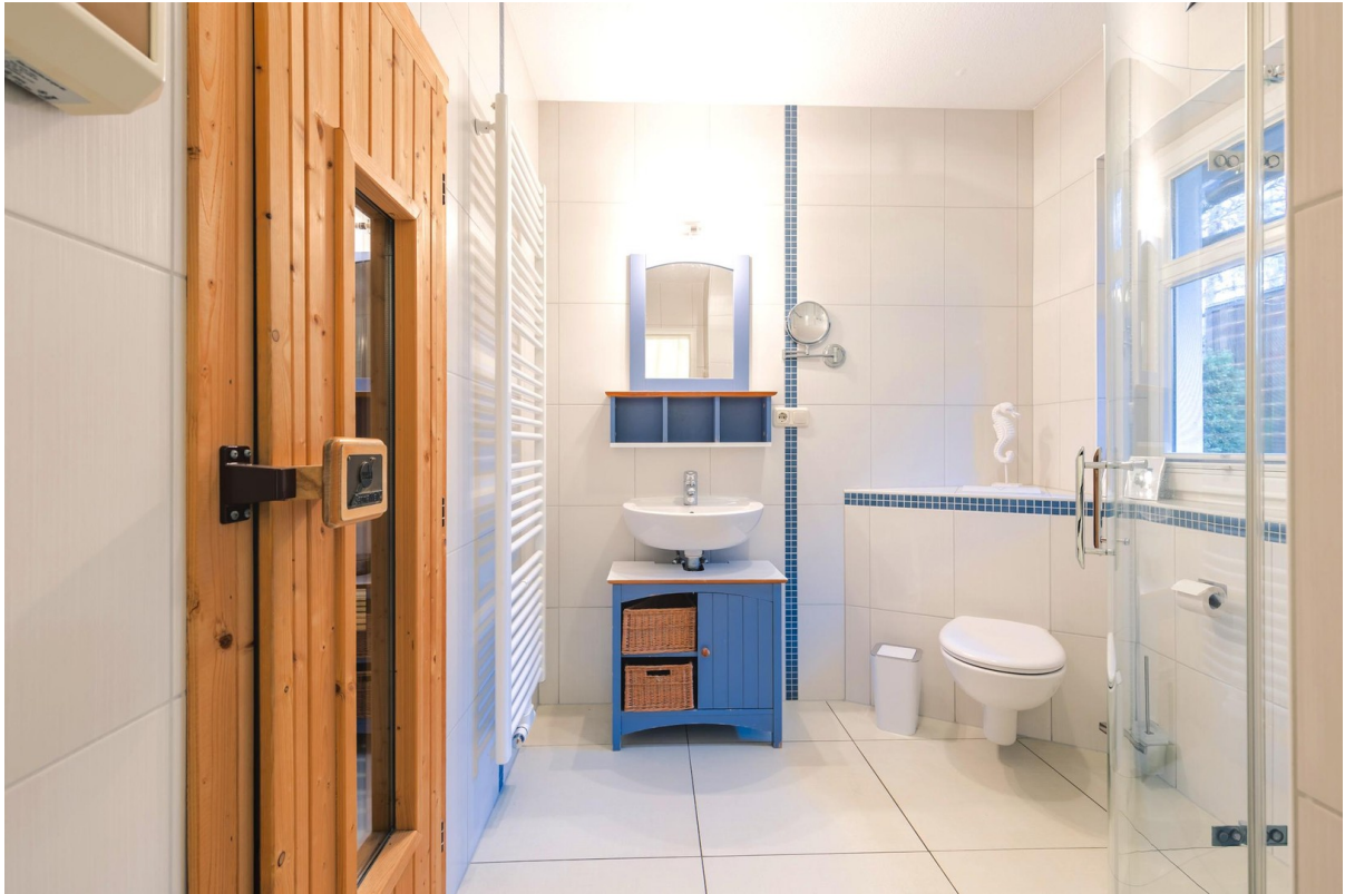
Badezimmer mit Sauna im EG