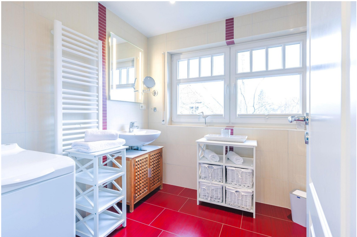
2. Badezimmer im OG