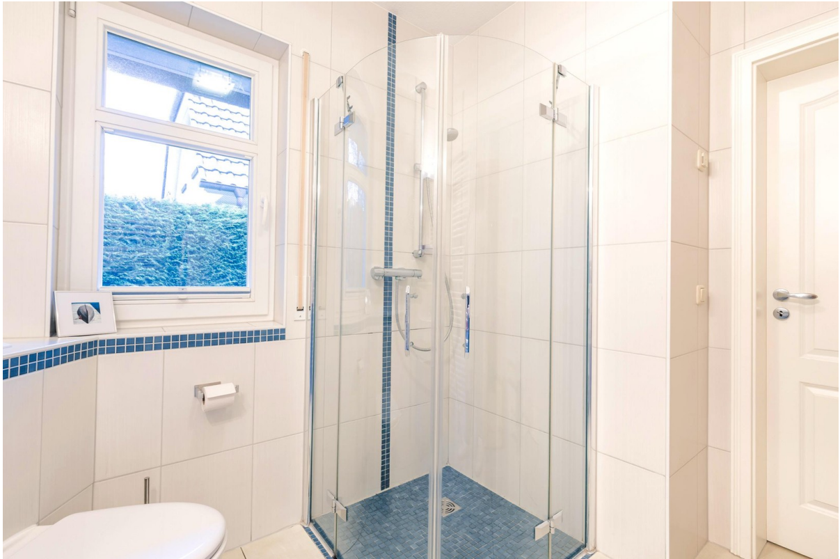
Badezimmer mit Dusche im EG