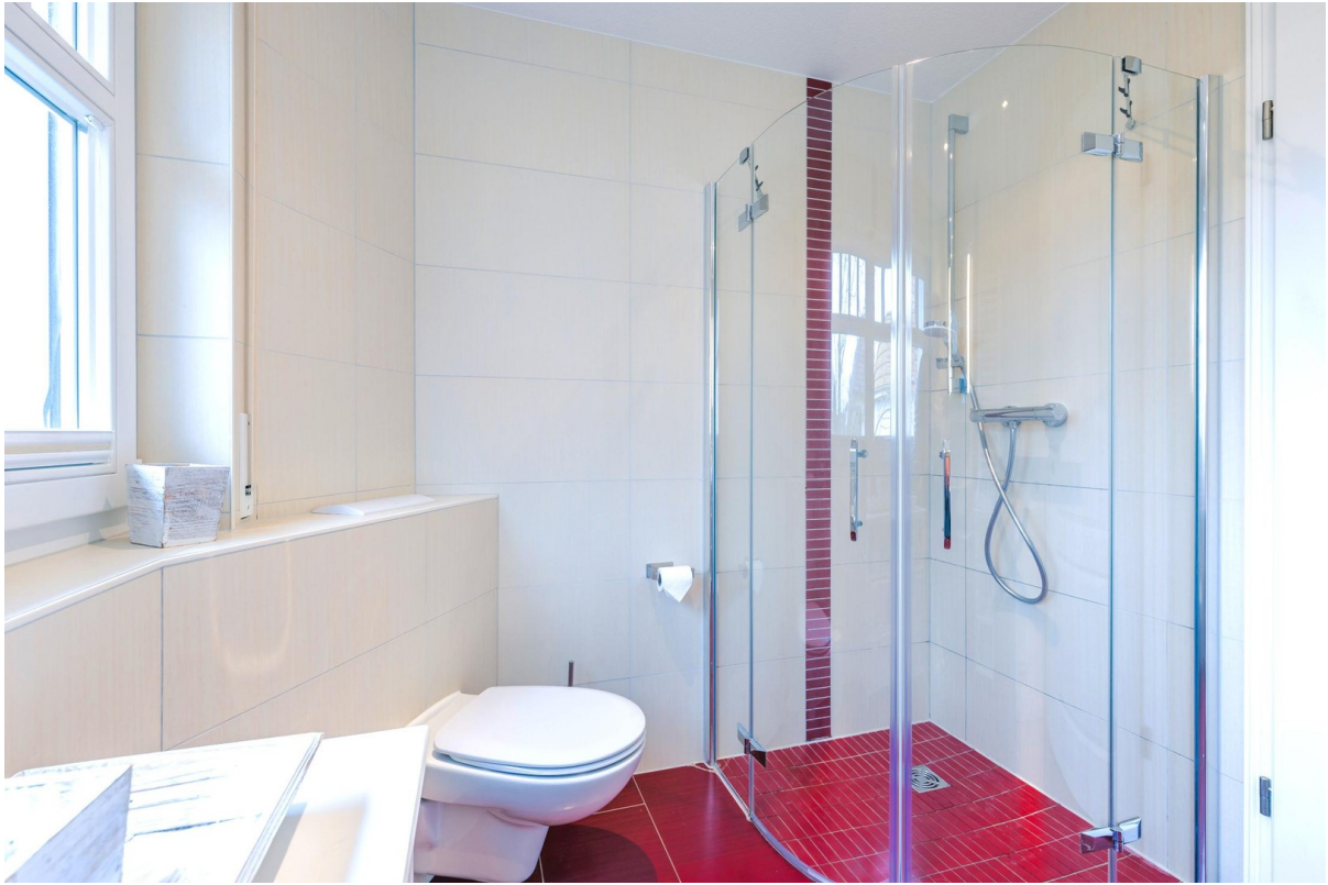
2. Badezimmer im OG