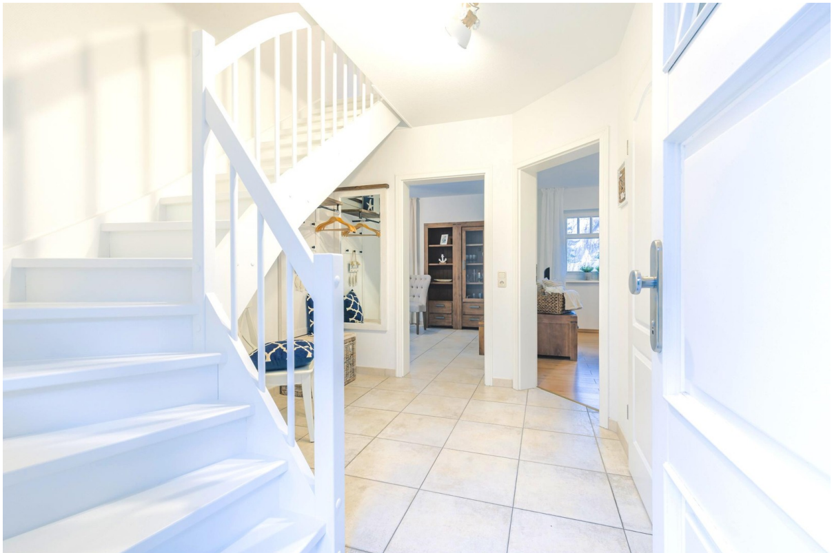
Eingangsbereich - Flur