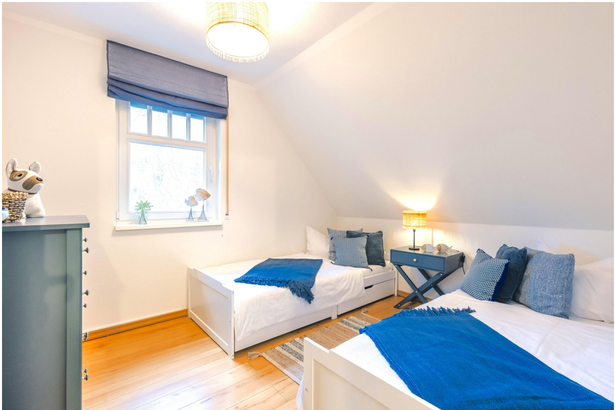
4. Schlafzimmer im OG