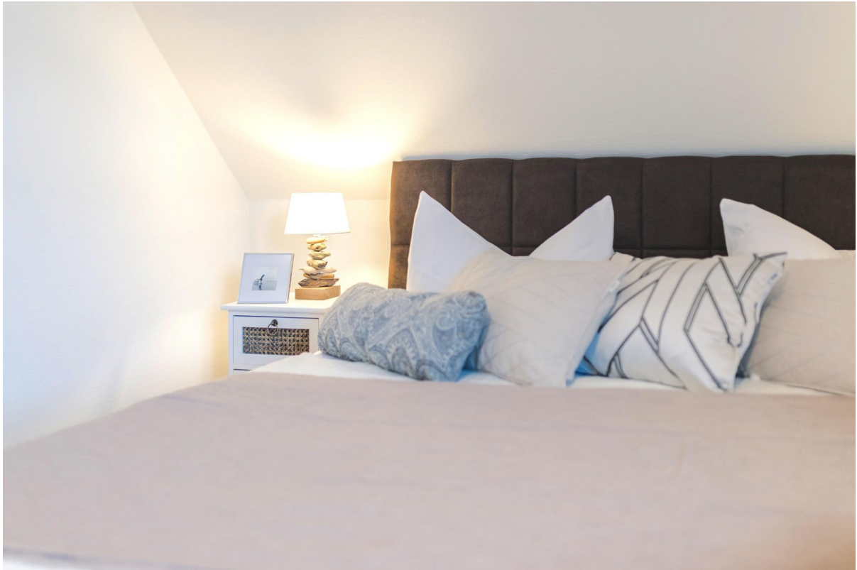
2. Schlafzimmer im OG