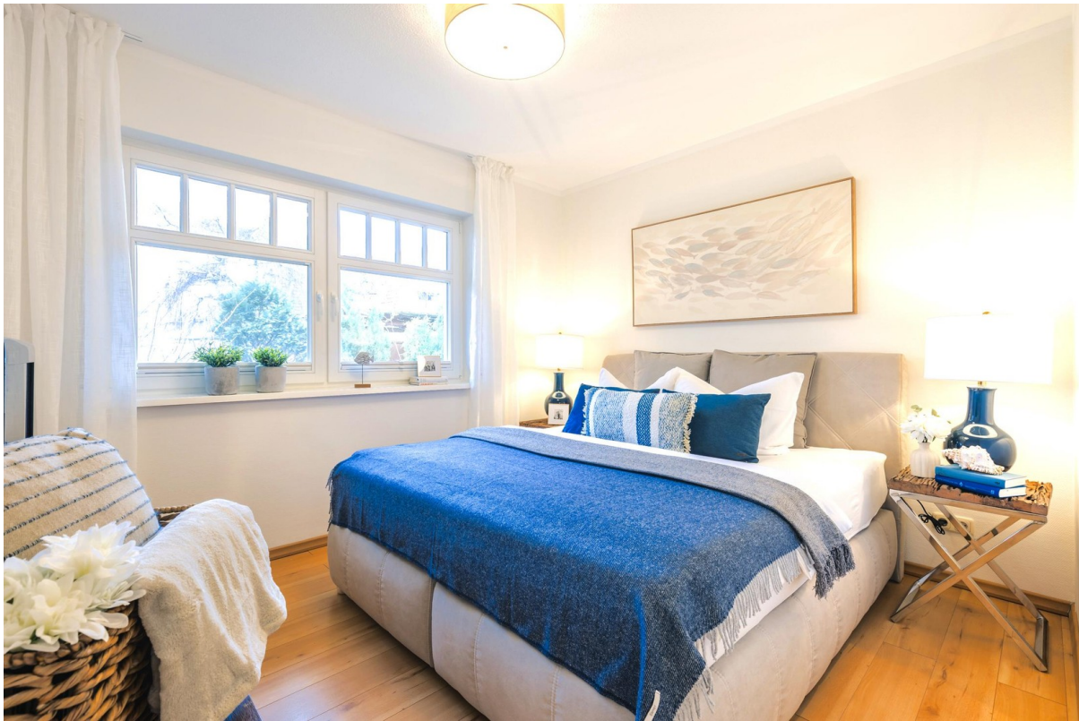
1. Schlafzimmer im EG