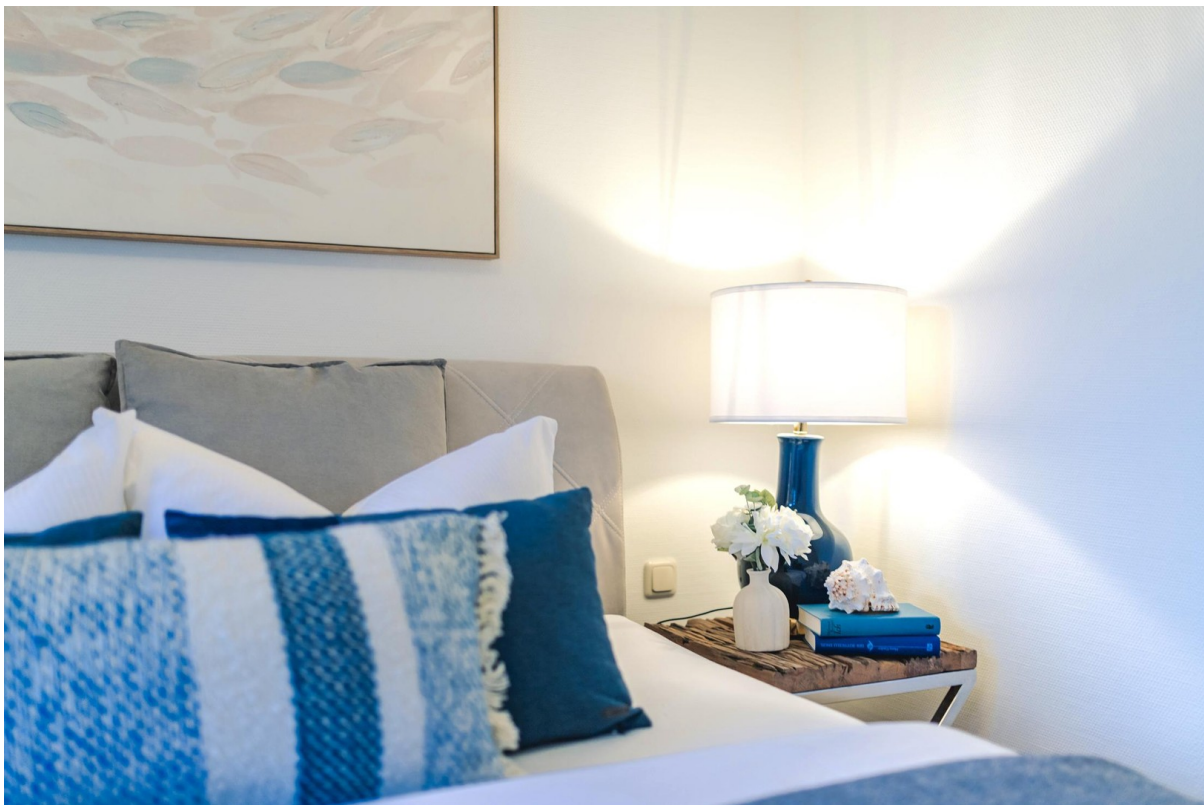
1. Schlafzimmer im EG