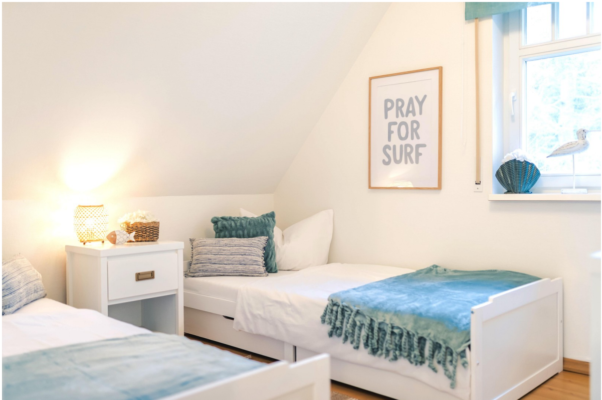
3. Schlafzimmer im OG