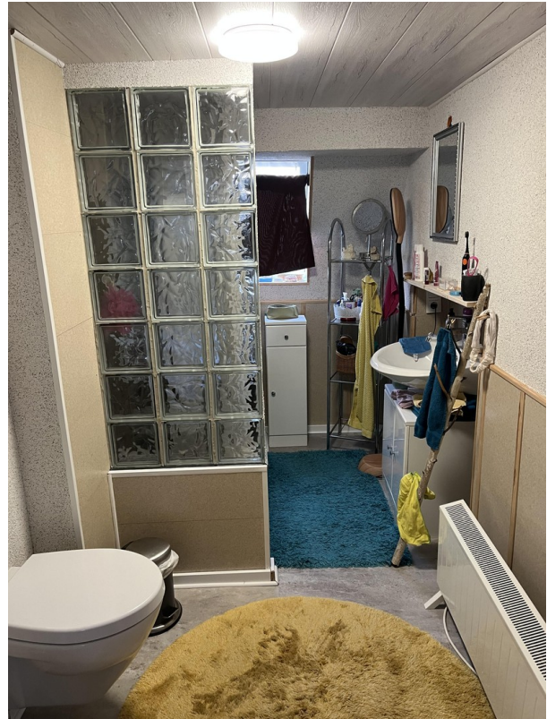
Eltern WC mit Dusche