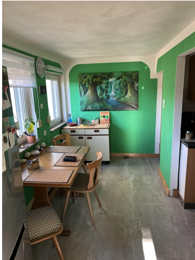
Esszimmer in Küche integriert