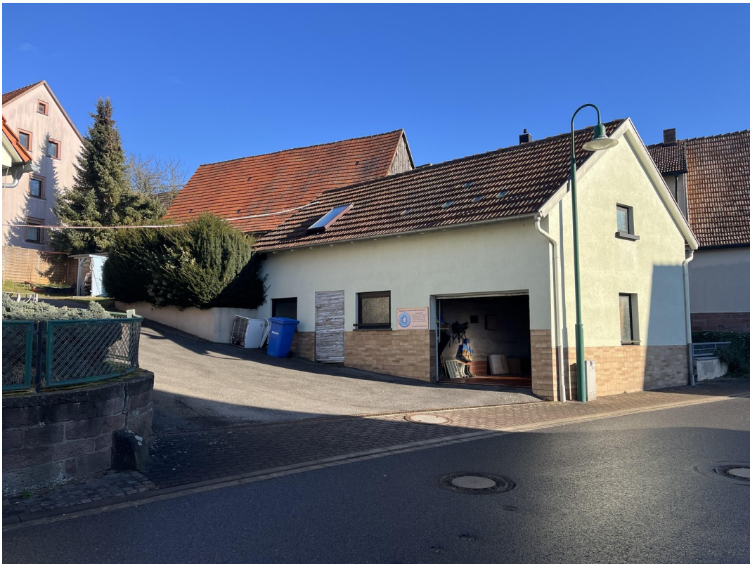
Nebengebäude & Garage