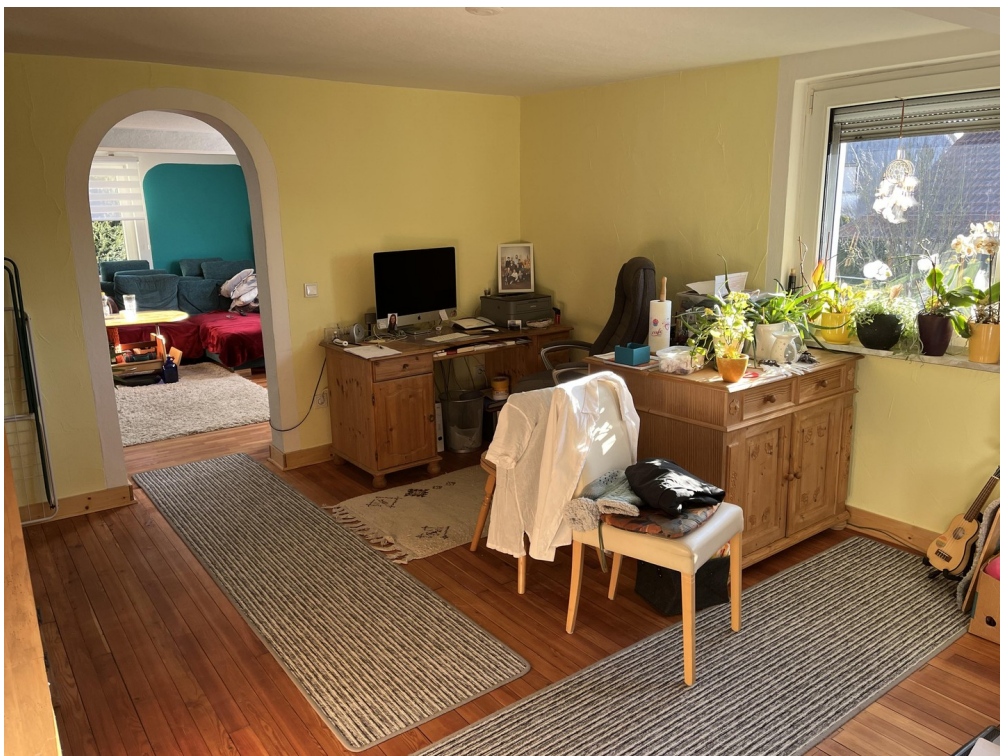
Büro oder Esszimmer