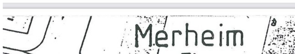
Skizze Hauseingang, Grundriss