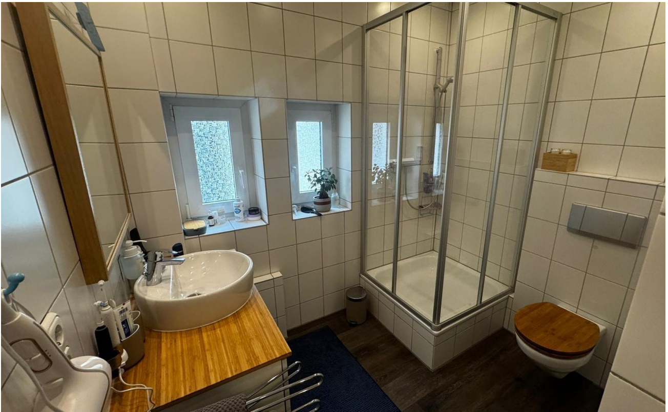
Badezimmer mit Fenstern