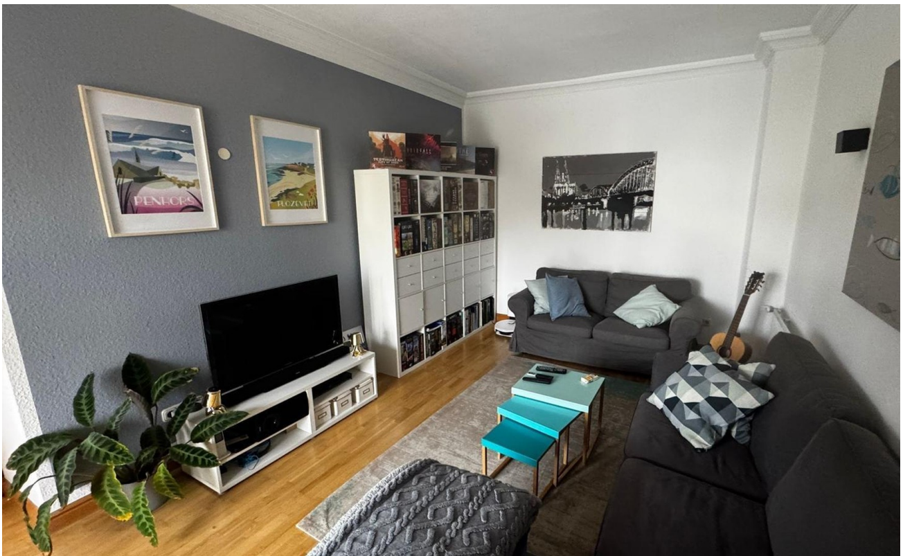
Wohnzimmer, Zugang zum Balkon