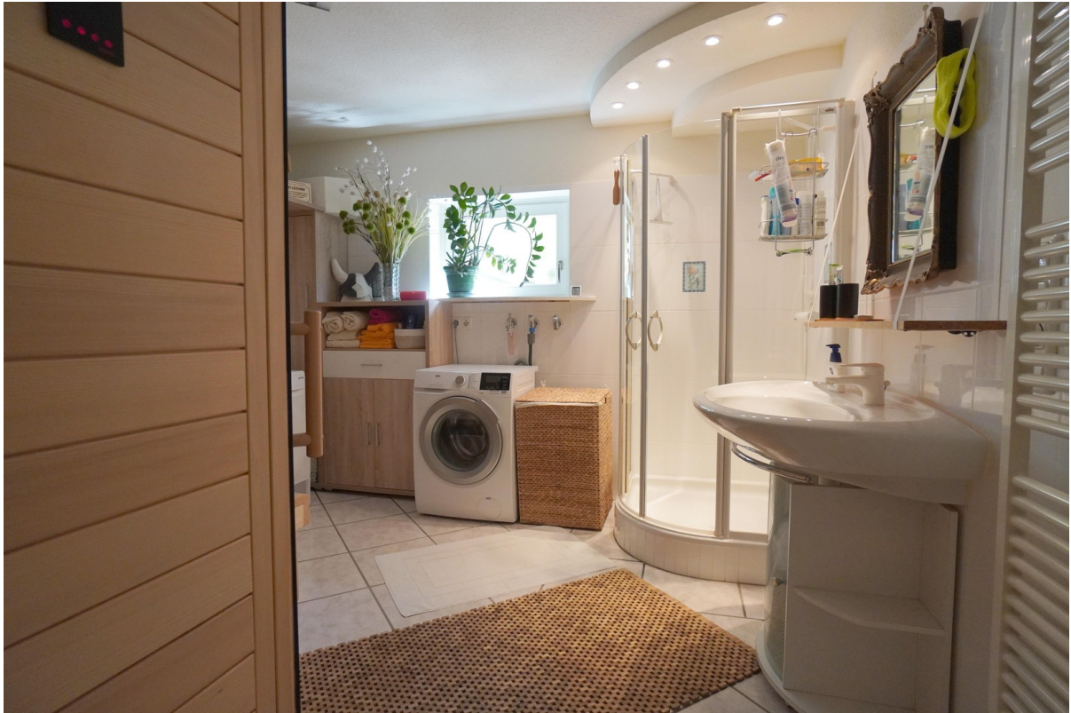
WE 2 HWR mit Dusche und Sauna