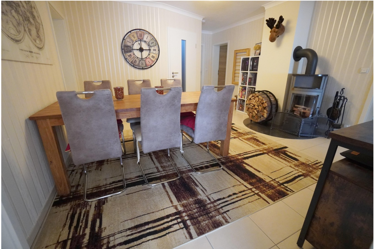
WE 2 Kaminzimmer