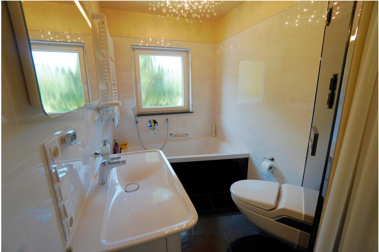
WE 1 Bad mit Wanne und DuschWC