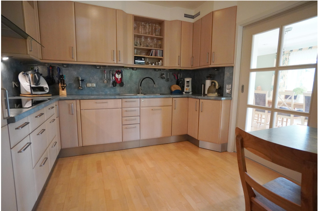
WE 1 Küche mit Schiebetür