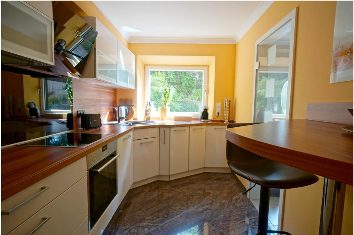
WE 2 Küche