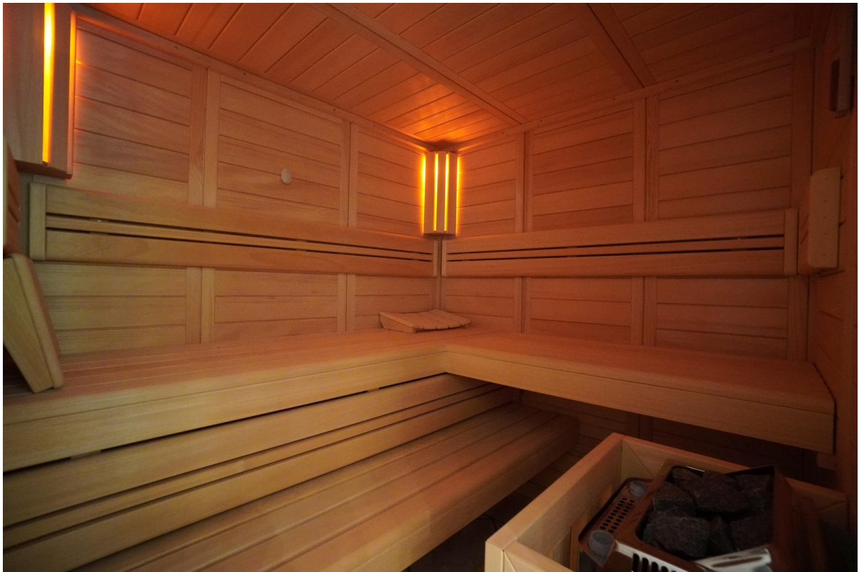
WE 2 Sauna mit Abachi-Holz