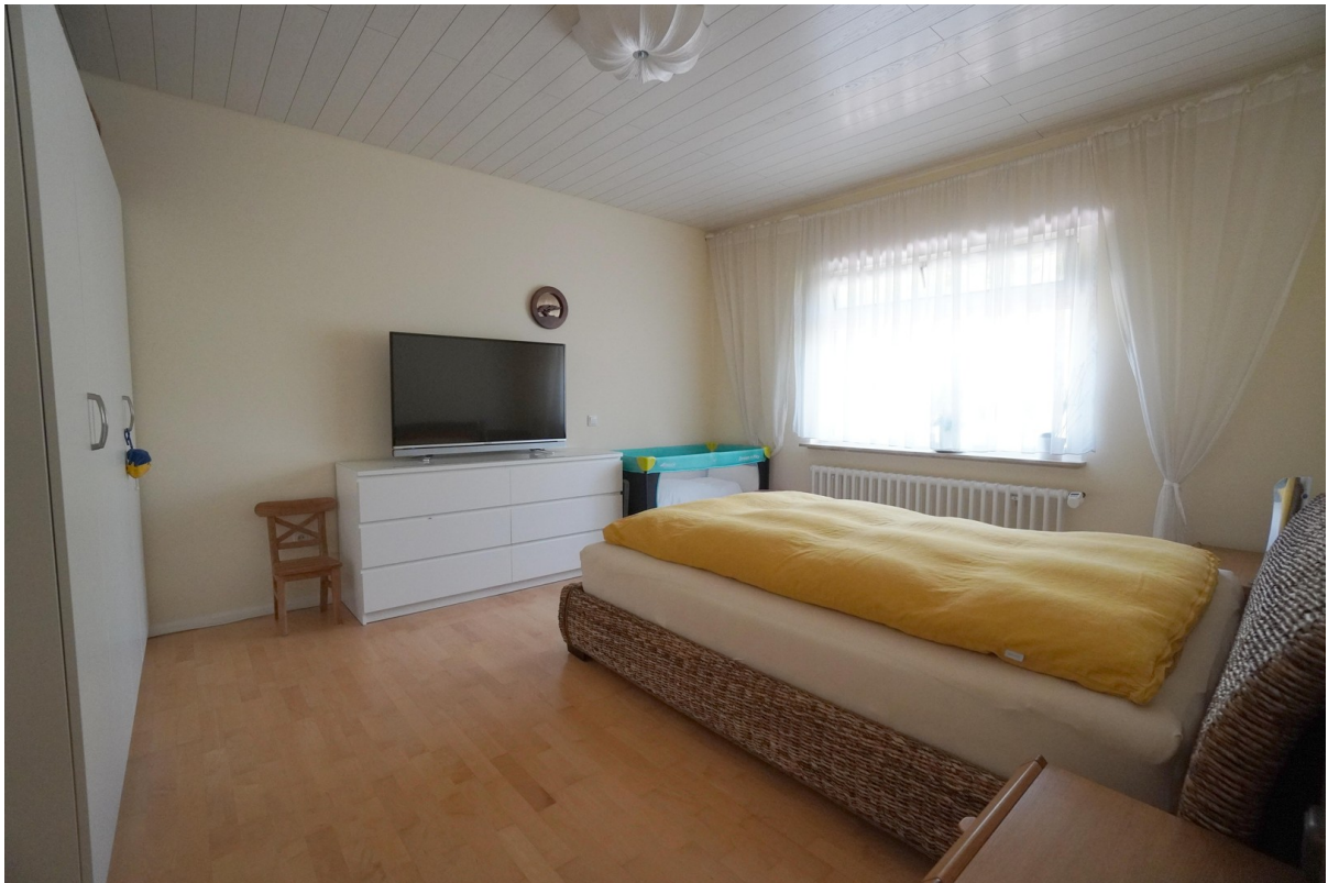
WE 1 Schlafzimmer