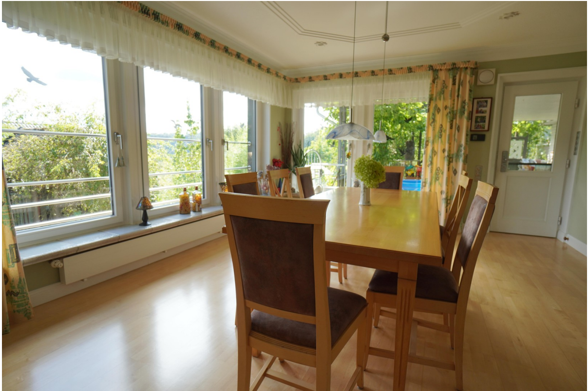
WE 1 Esszimmer Balkonzugang