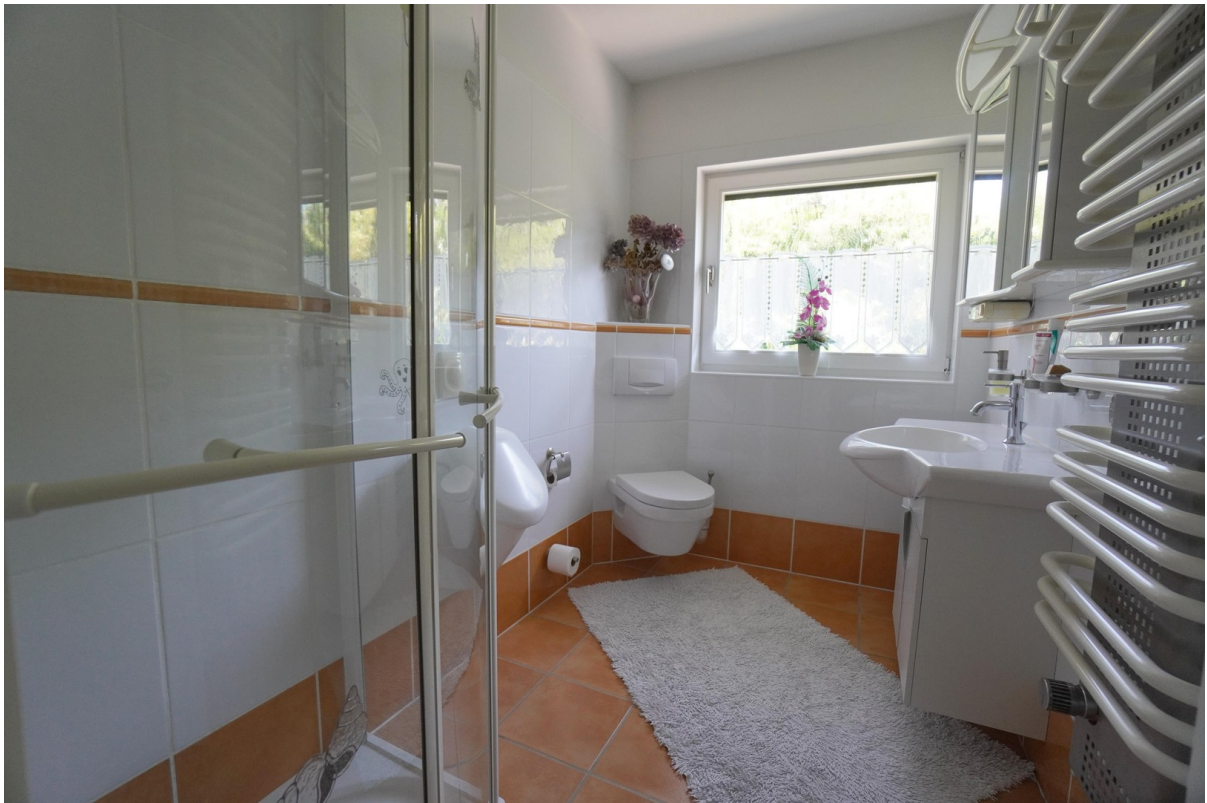
WE 1 Dusch-Bad