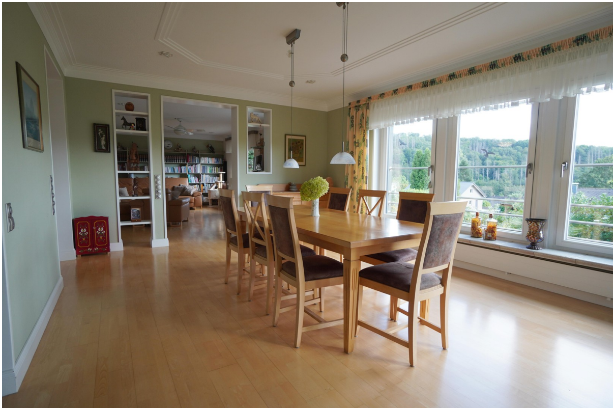
WE 1 offenes Esszimmer