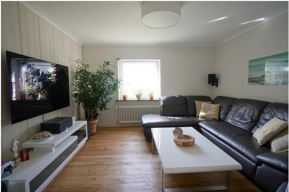
WE 2 Wohn- oder Schlafzimmer