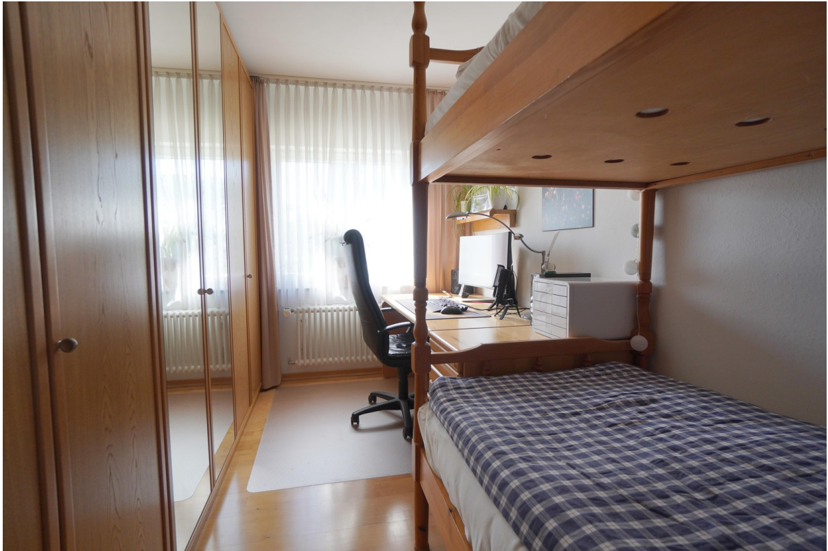
WE 2 Kinderzimmer