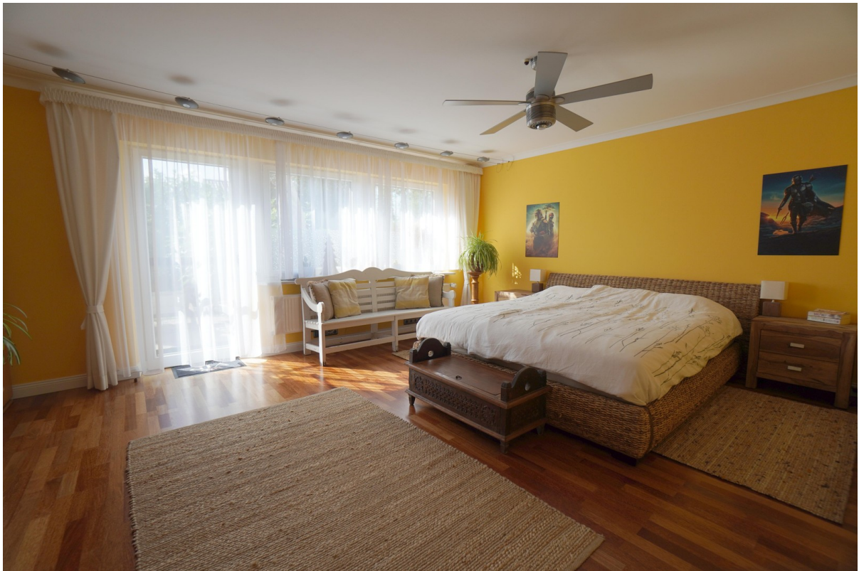
WE 2 Schlaf- oder Wohnzimmer