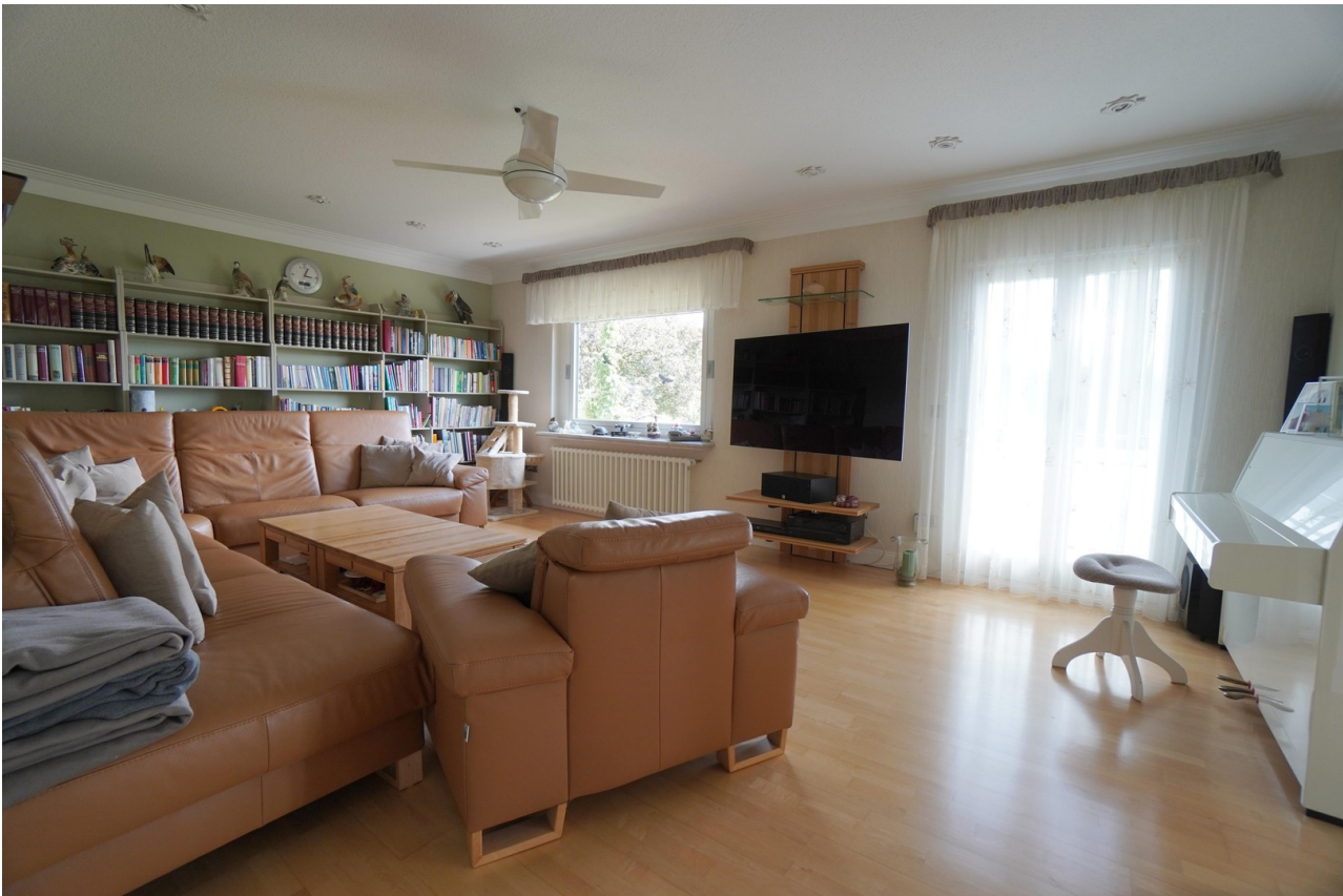
WE 1 Wohnzimmer