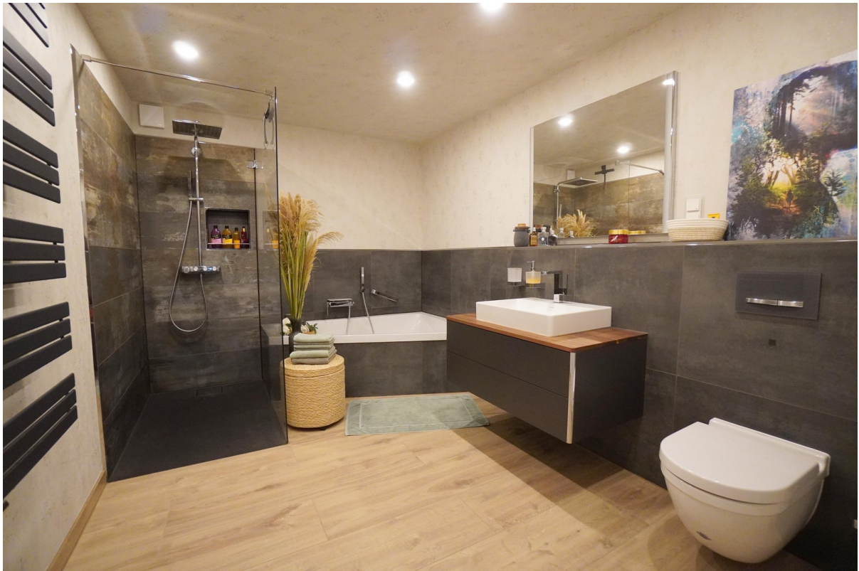
WE 2 Bad mit Walk-In-Dusche