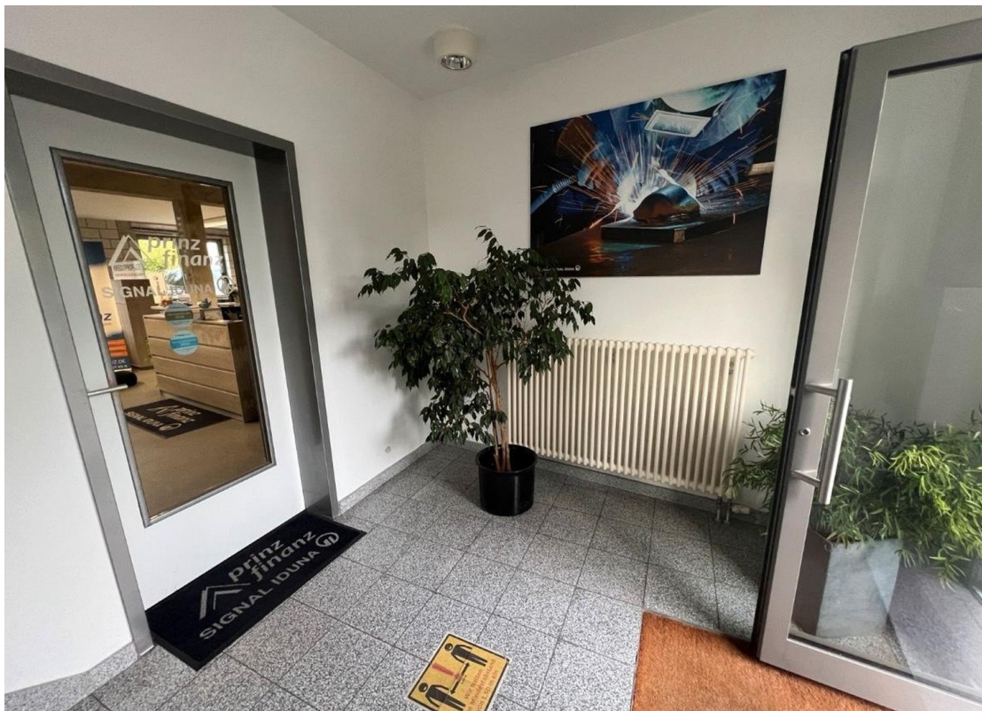
Eingang innen Flur