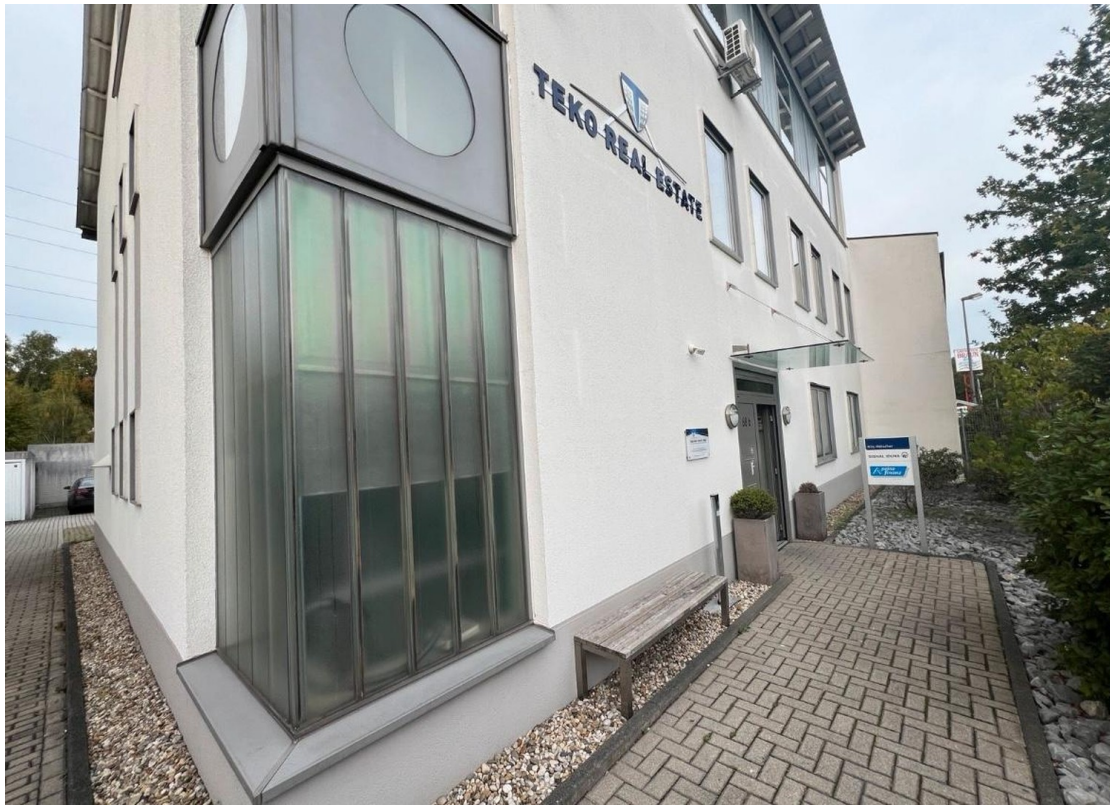
Ansicht außen Eingang