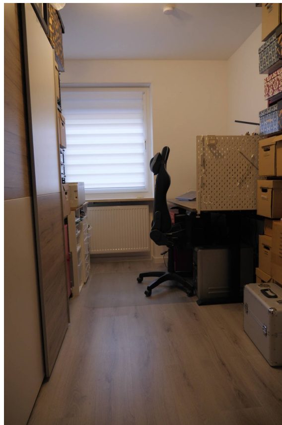
Büro / Kinderzimmer