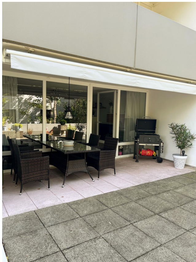
Loggia & Terrasse