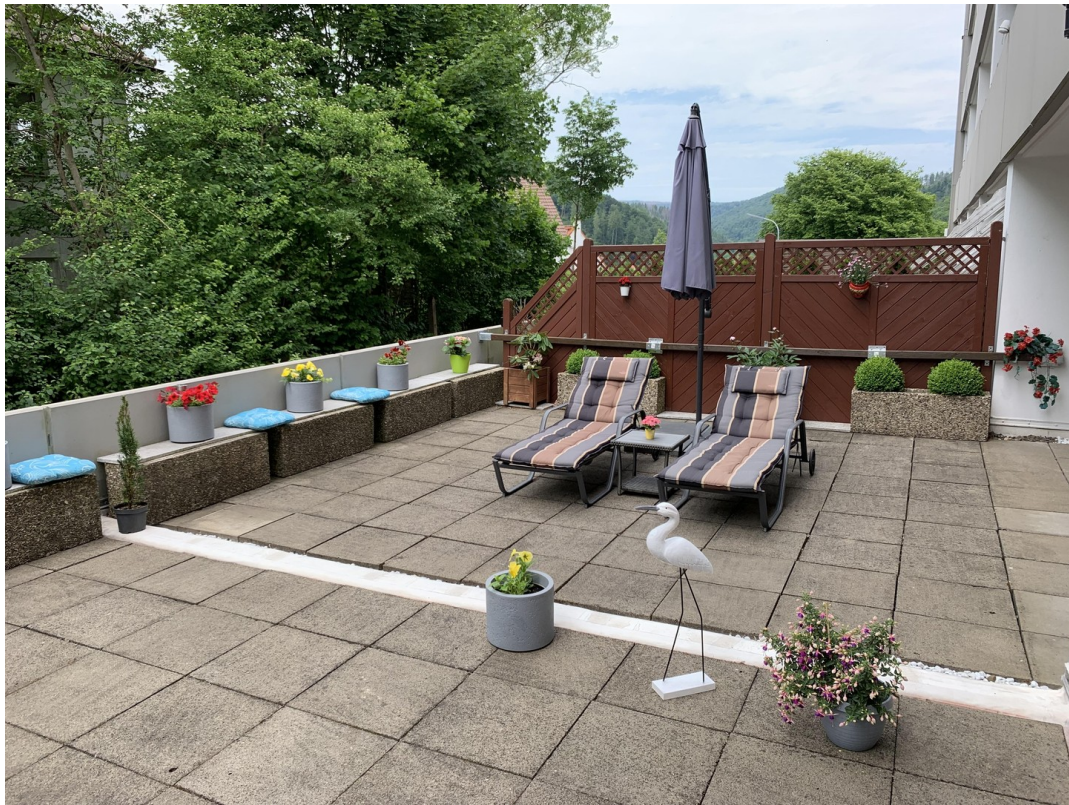
Terrasse mit Ausblick