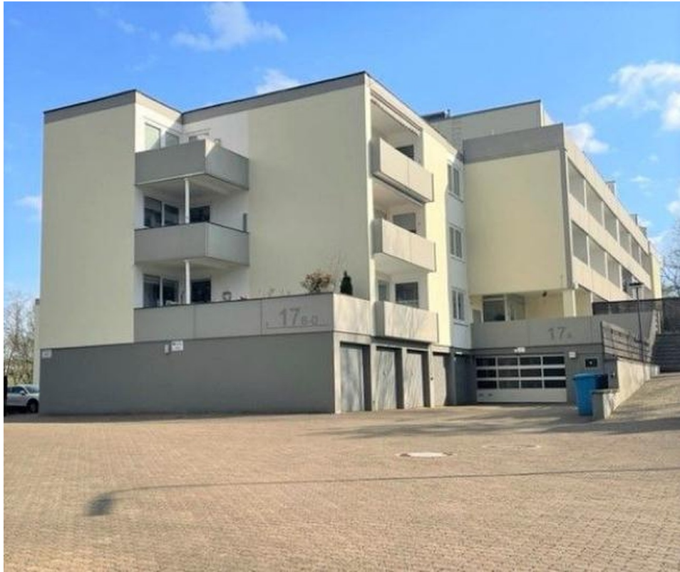
Wohnanlage mit Stellplätzen