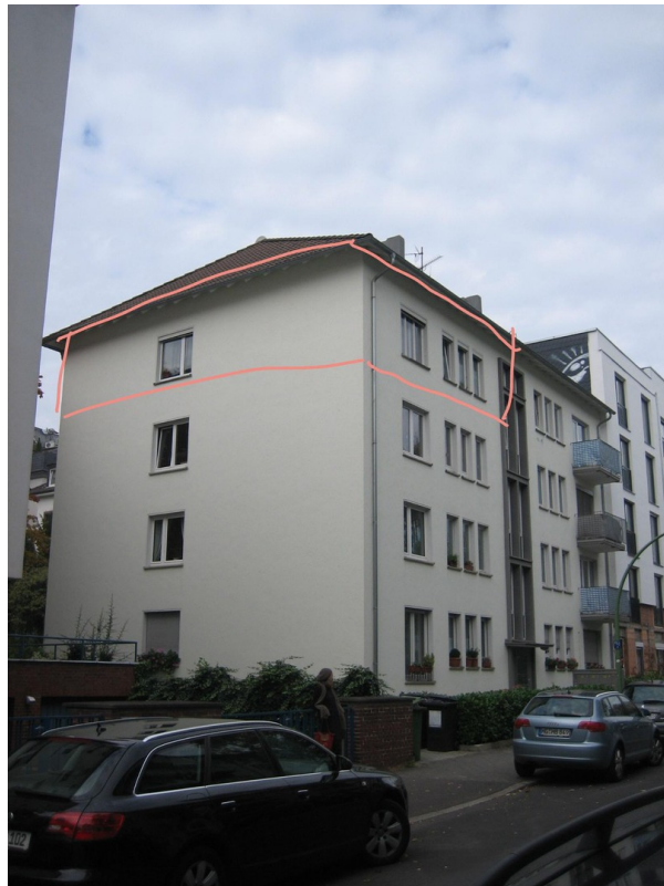
Lage der Wohnung