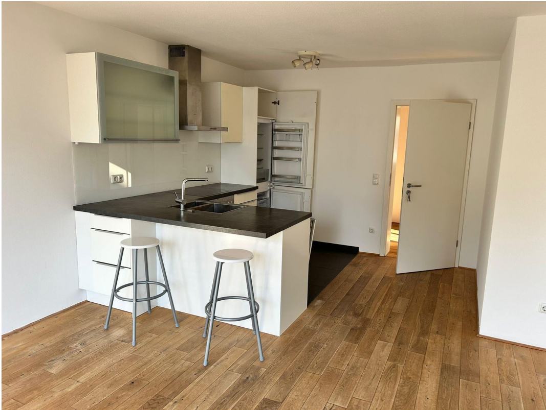
Küche (Blick in den Flur)