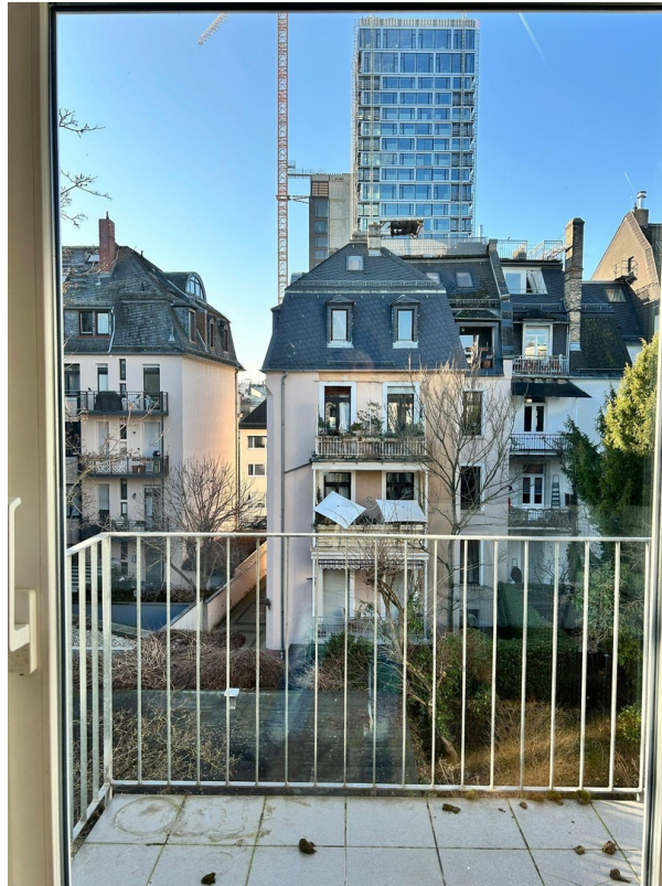
Blick in den Innenhof