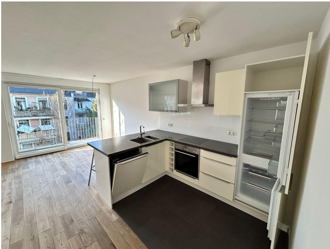
Küche (Blick Balkon)