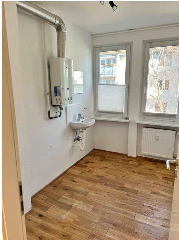
Abstellkammer / Büro