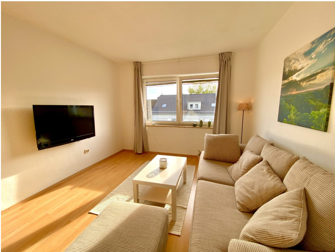
Ansicht Zimmer Neu