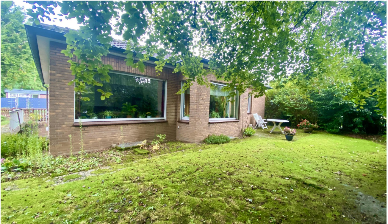
Garten / Hausansicht