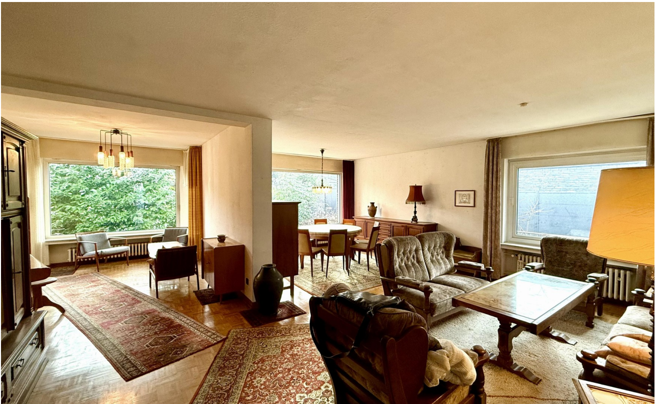
Wohn-/Esszimmer (50 qm)