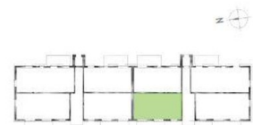
Lage 3-R09 2. Obergeschoss