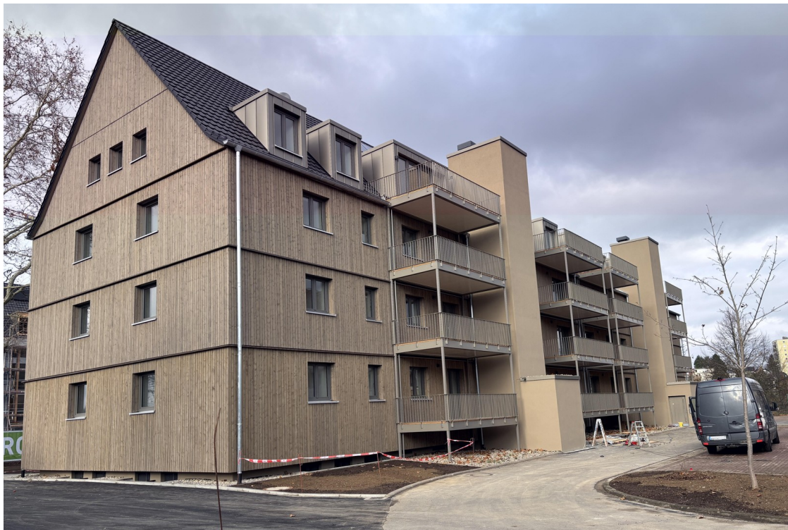
Außenansicht Parkplatz Aufzug