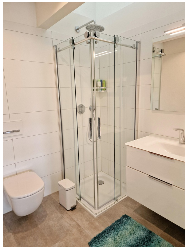
Gäste Bad mit Dusche