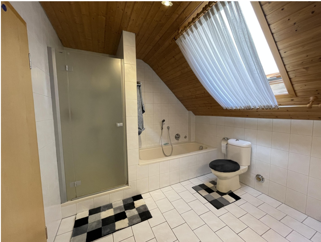
Badezimmer 1. DG