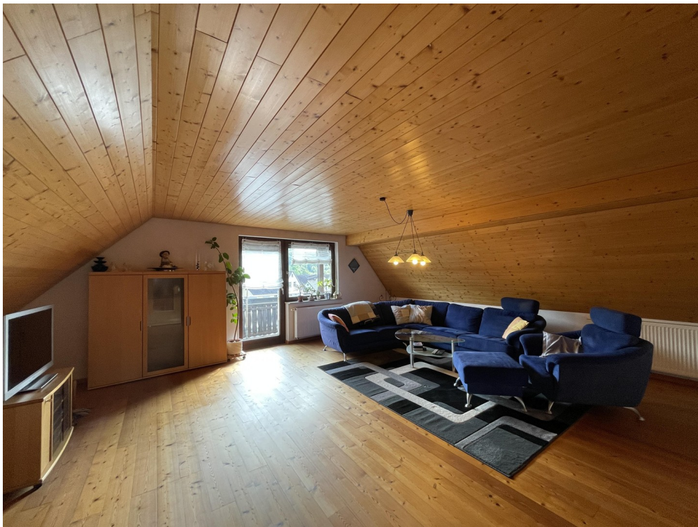
Wohnzimmer 2. DG