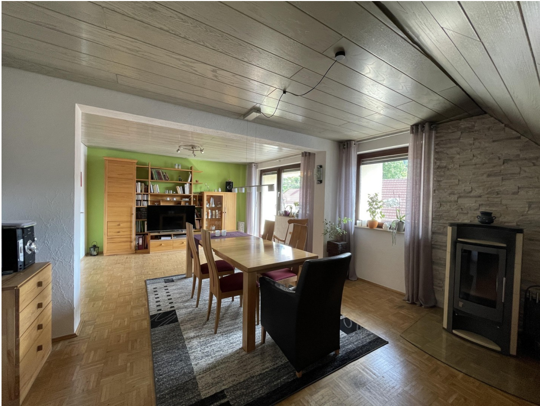
Wohnzimmer 1. DG