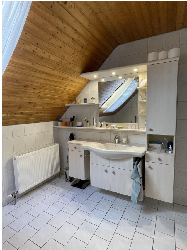
Badezimmer 1. DG