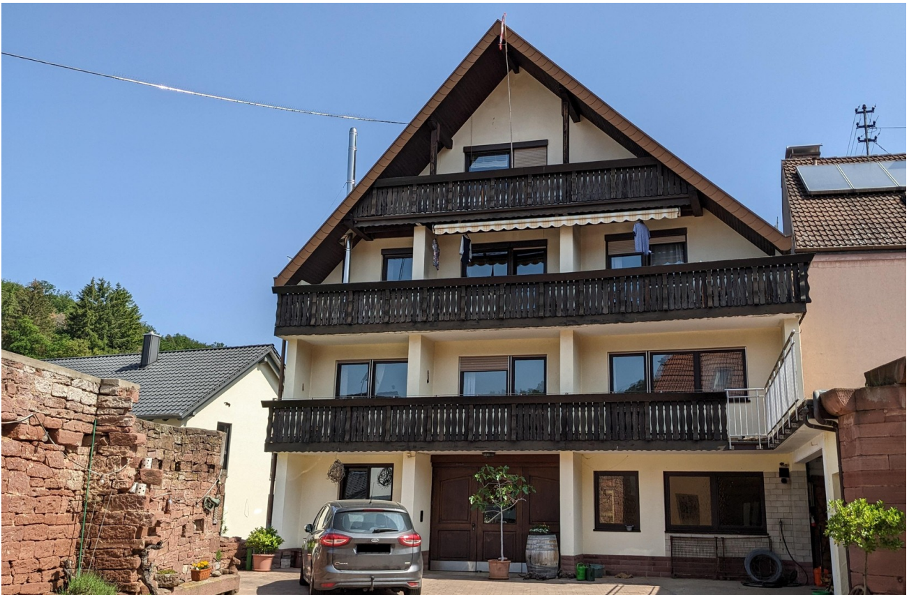
Blick Haus vom Hof aus