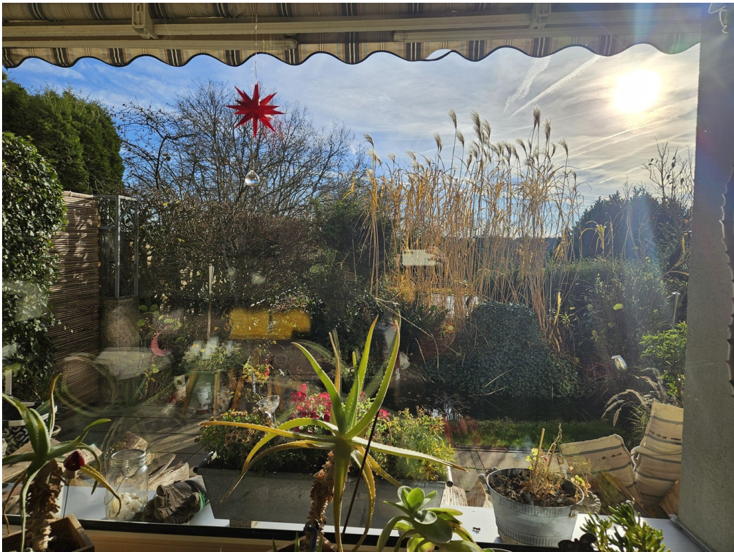
Blick vom Wohnzimmer in den Ga