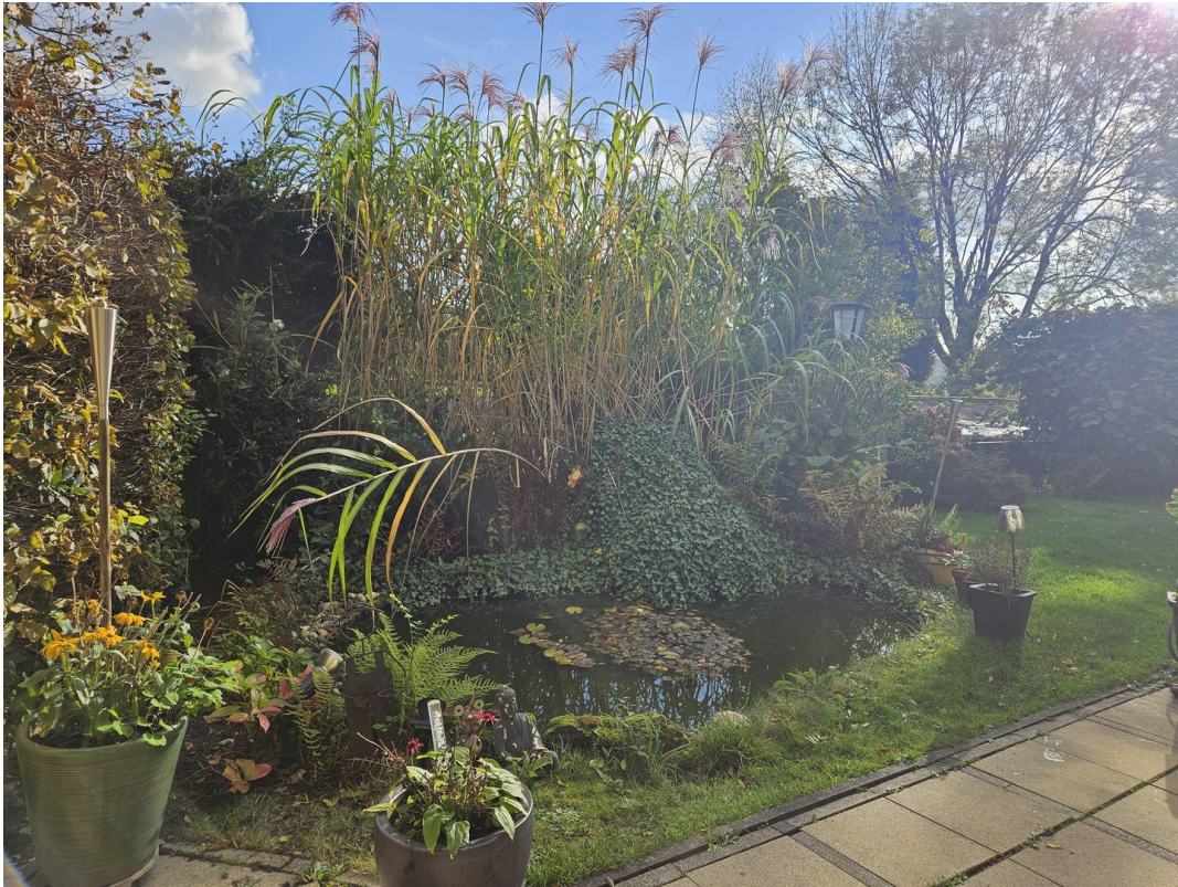
Garten mit Teich