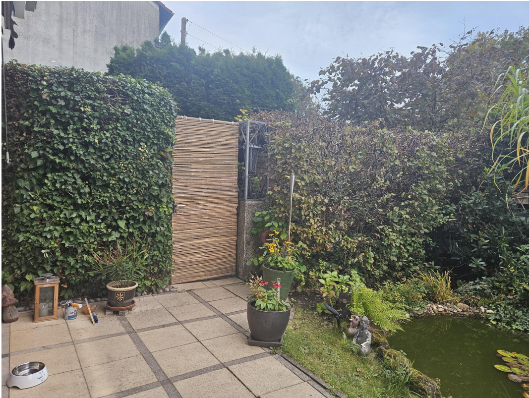
Zugang zur Terrasse und Wohnun