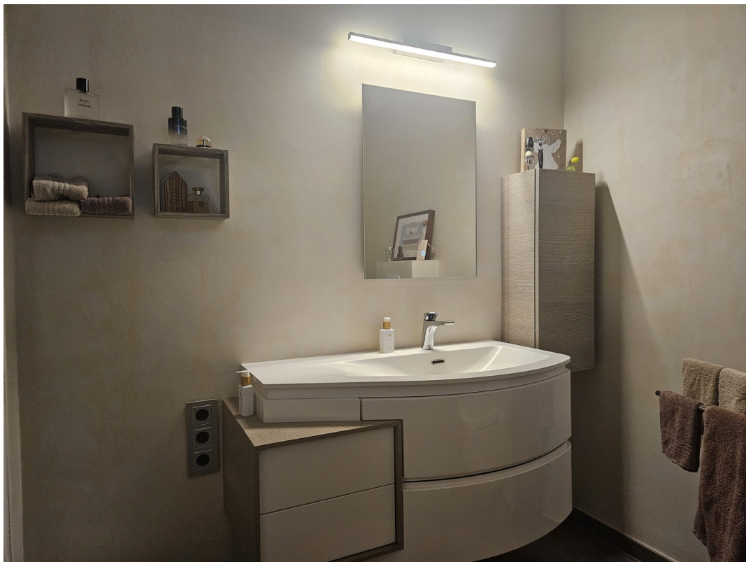
Bad mit Badewanne