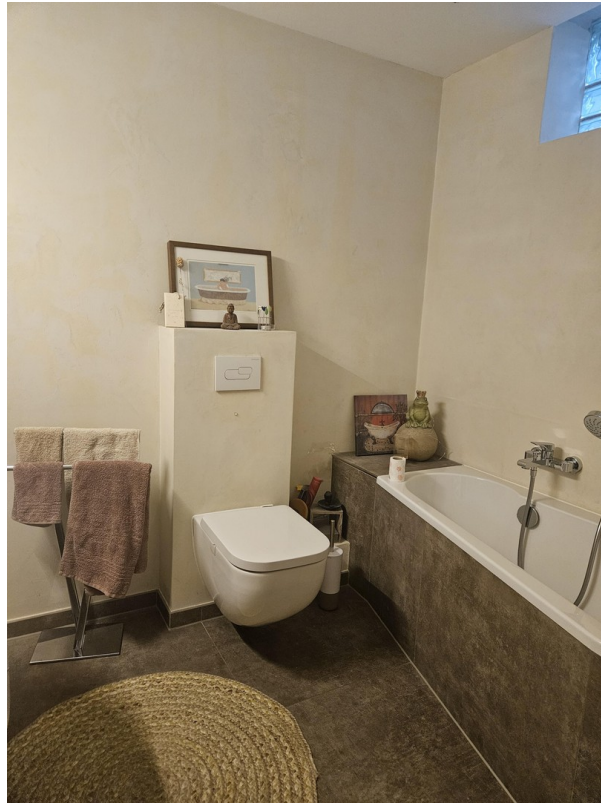
Bad mit Badewanne