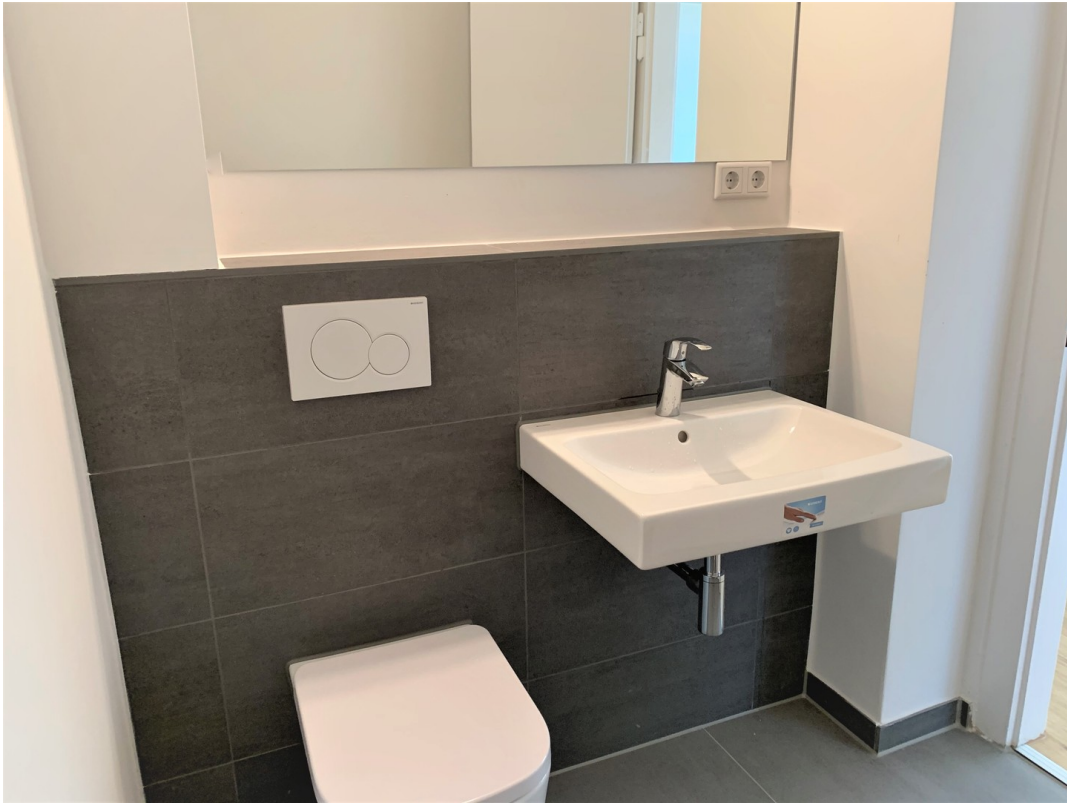
Gästebad mit Waschmaschine.ans.