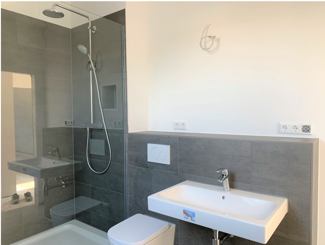
Badezimmer Bild 1