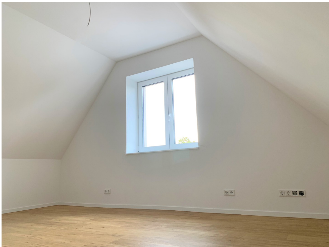
Raum in der zweiten Etage