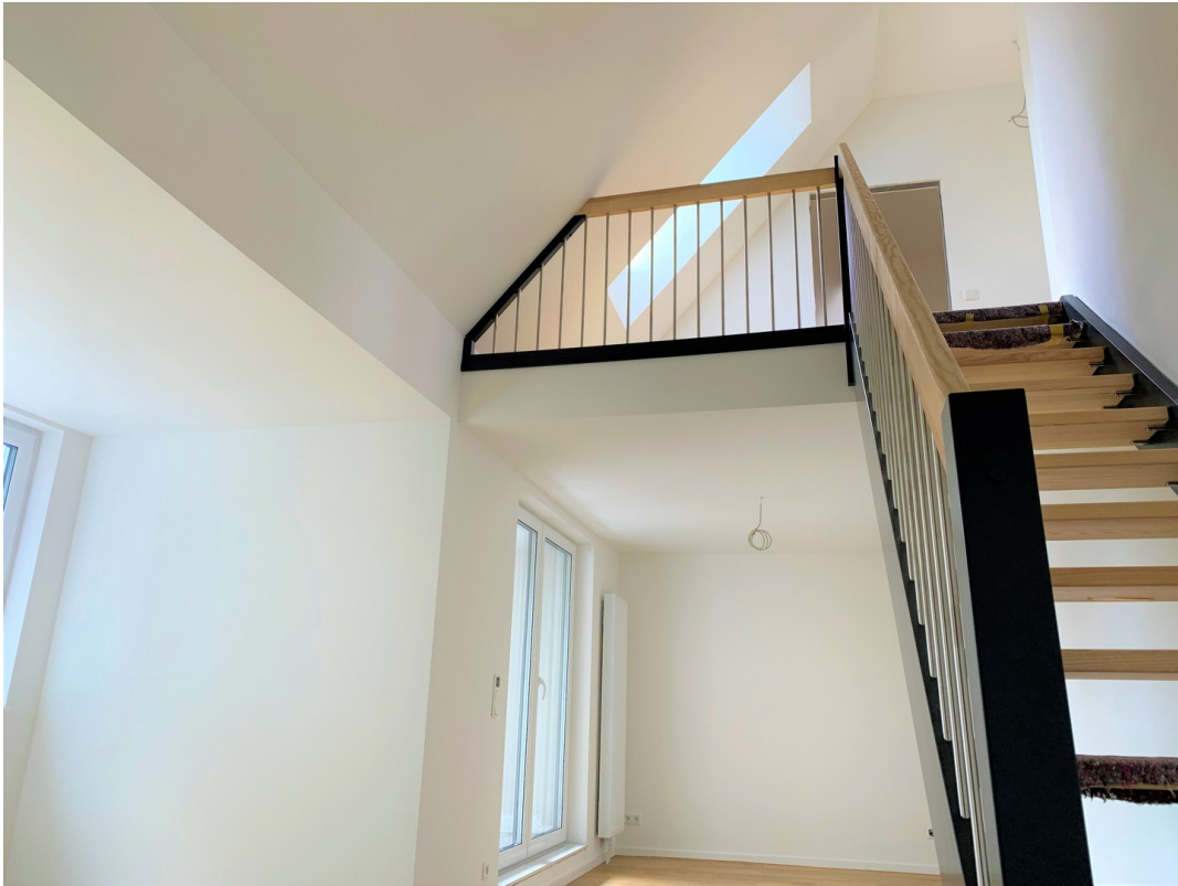
Wohnbereich mit Blick Galerie