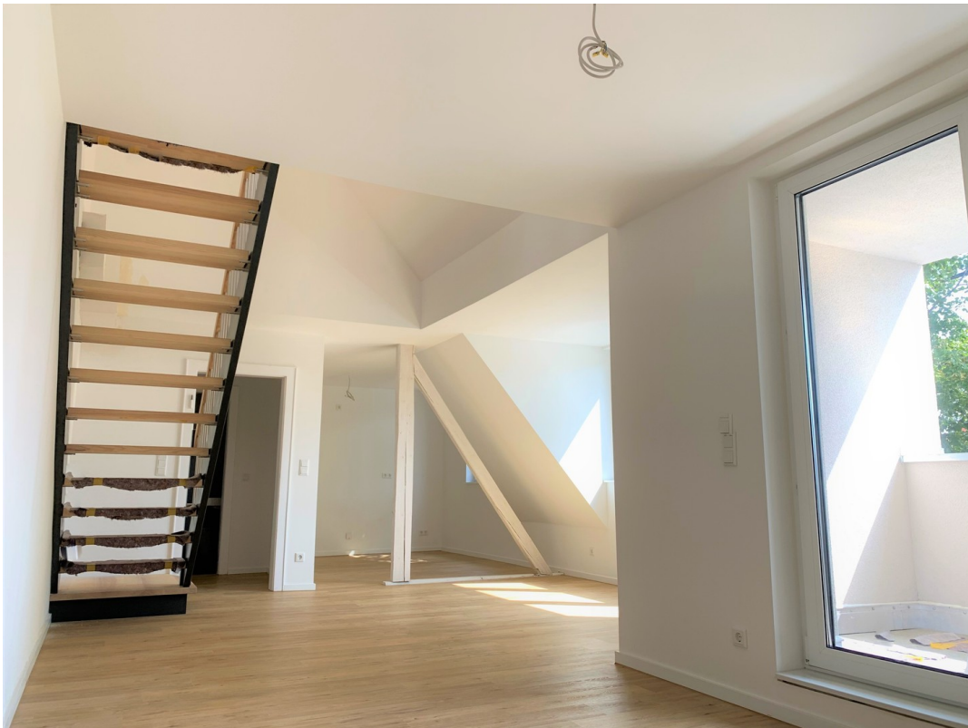
Blick in Wohn- Küchenbereich