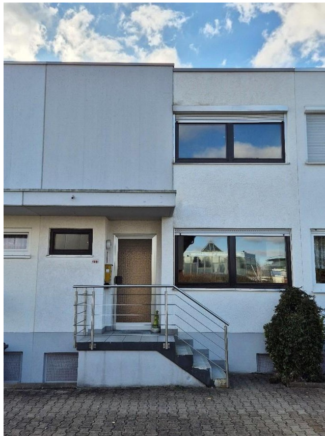
Hauseingang / Frontansicht