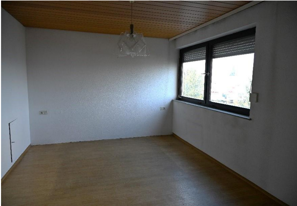
Zimmer 1 - OG