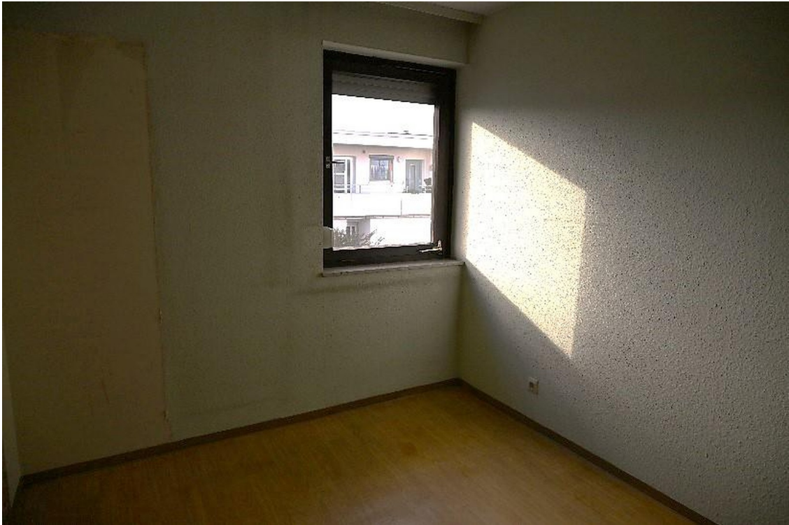
Zimmer 3 - OG