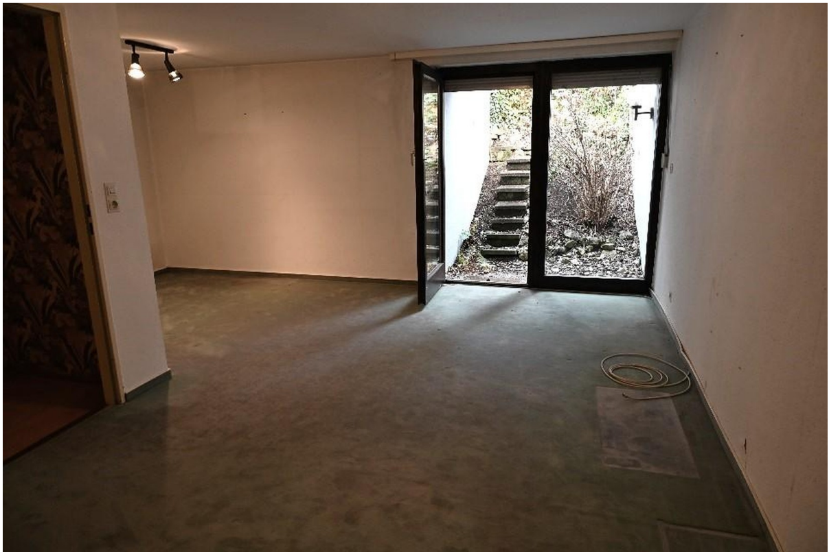
Zimmer 4 - UG