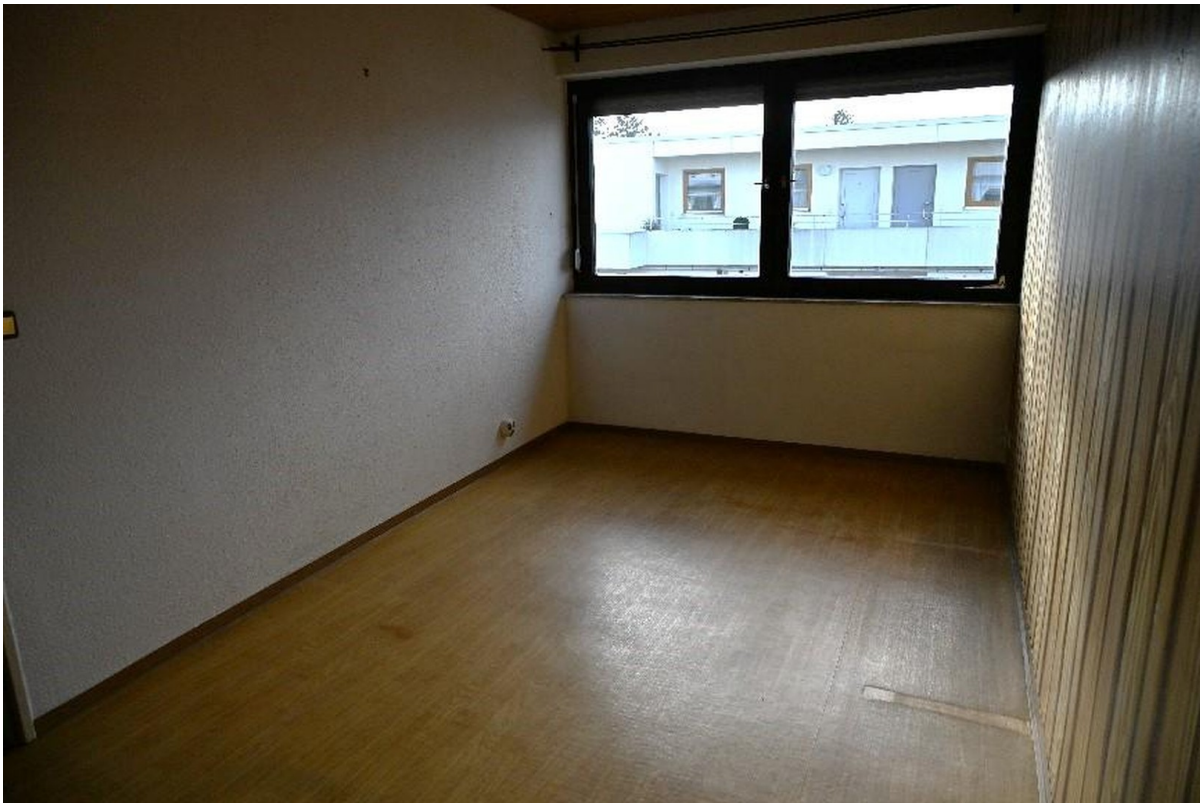
Zimmer 2 - OG