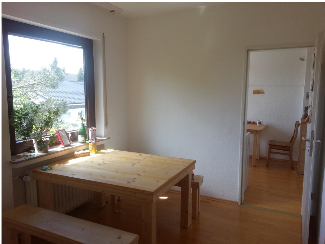
Esszimmer Blick zur Küche