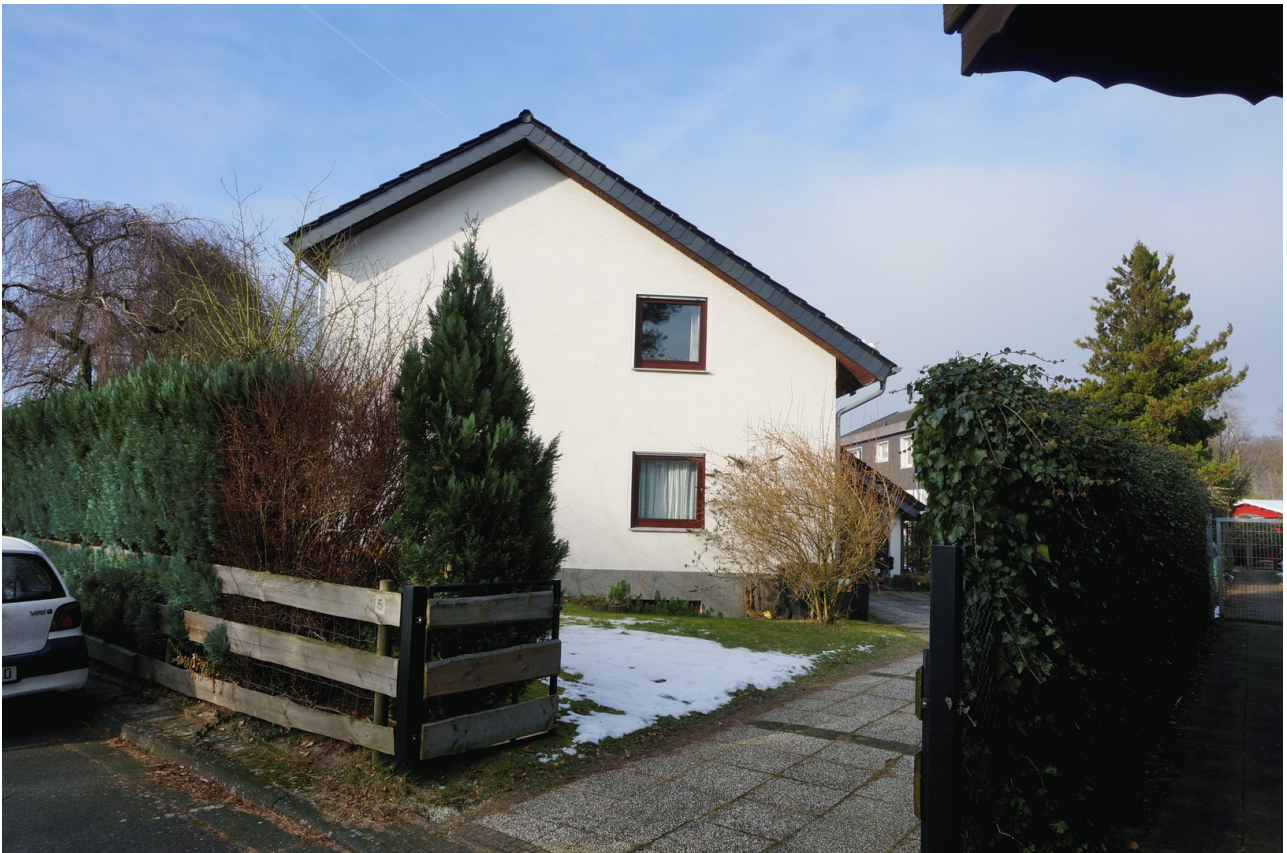
Ansicht Ost SZ Fenster oben