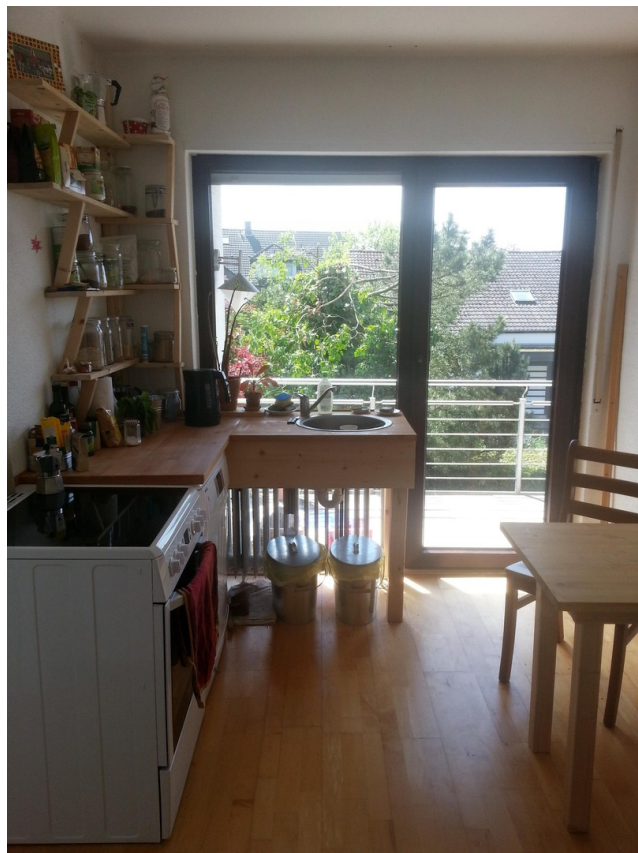
Küche mit Blick auf den Balkon