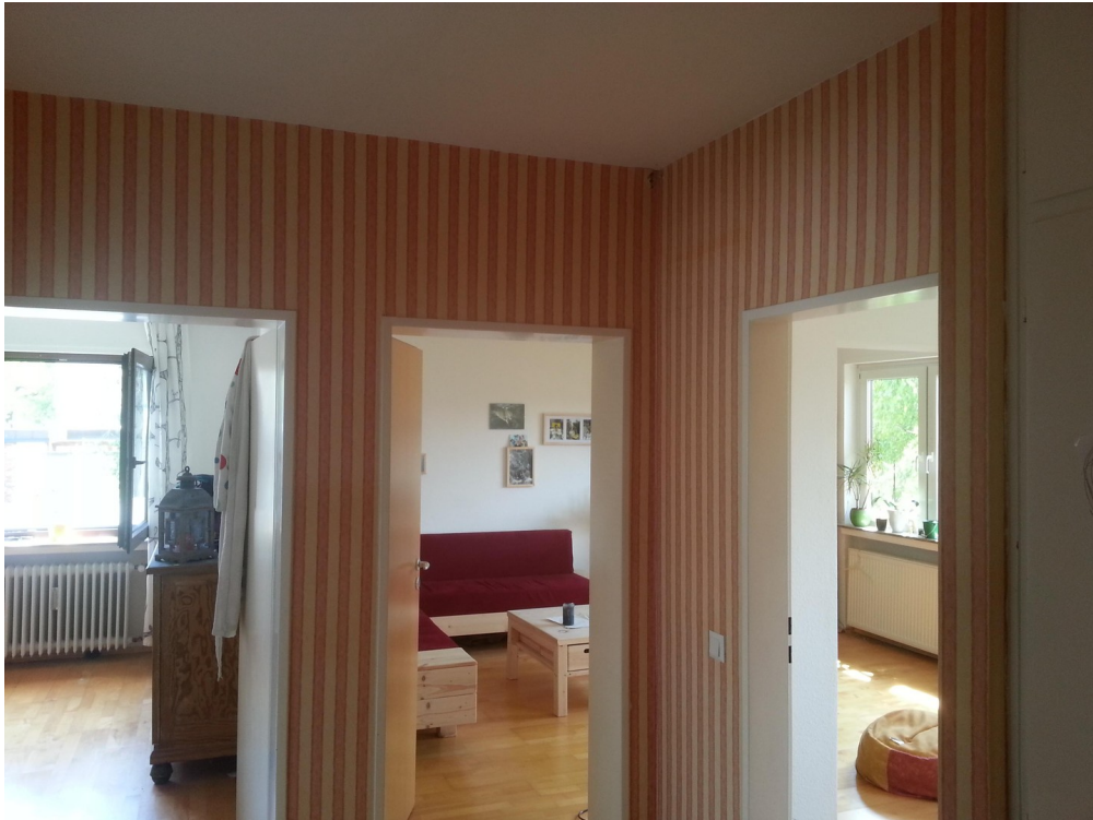
Flur, von links Tür SZ, WZ, EZ