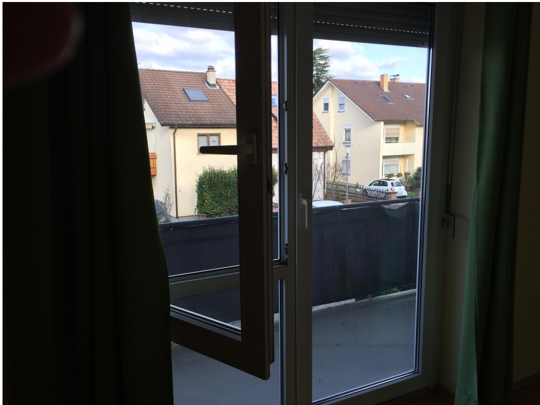
Balkon Blick Wohnstrasse