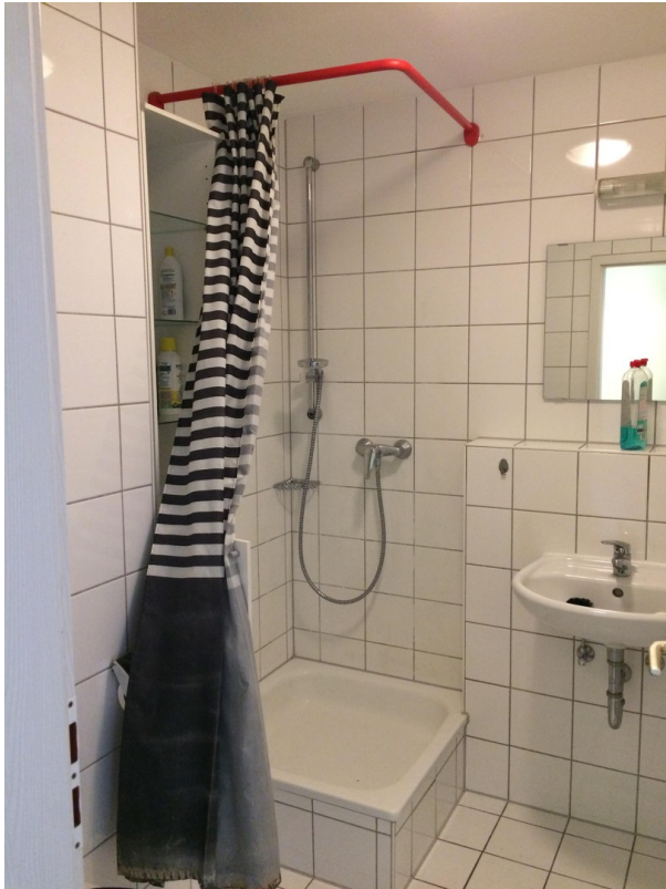
Dusche / WC