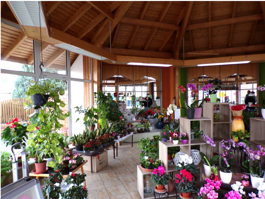
Verkaufsraum Ansicht I