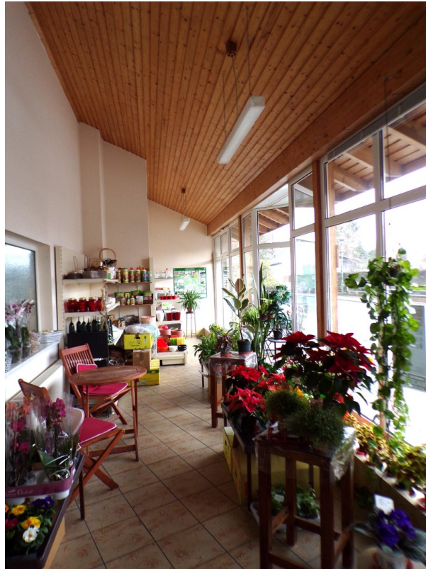
Verkaufsraum Ansicht II