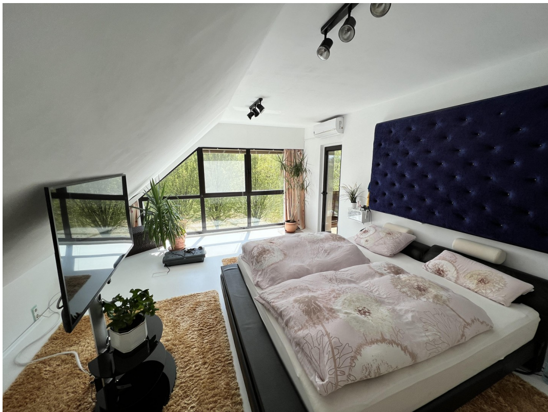
Schlafzimmer / Büro u.ä.