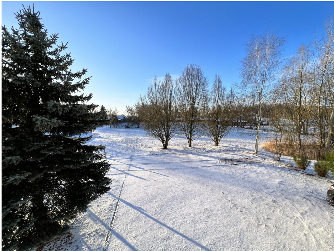
...auch im Winter schön...