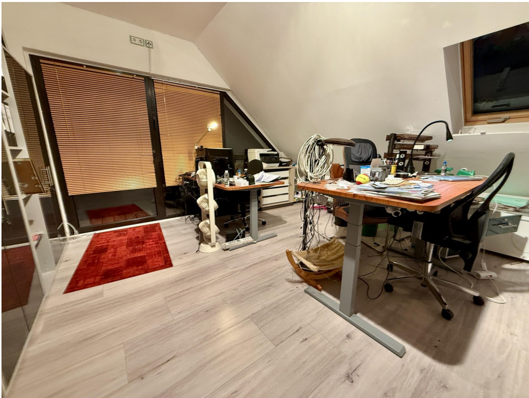
Büro / Gäste-, Schlaf-, Ki.zi.