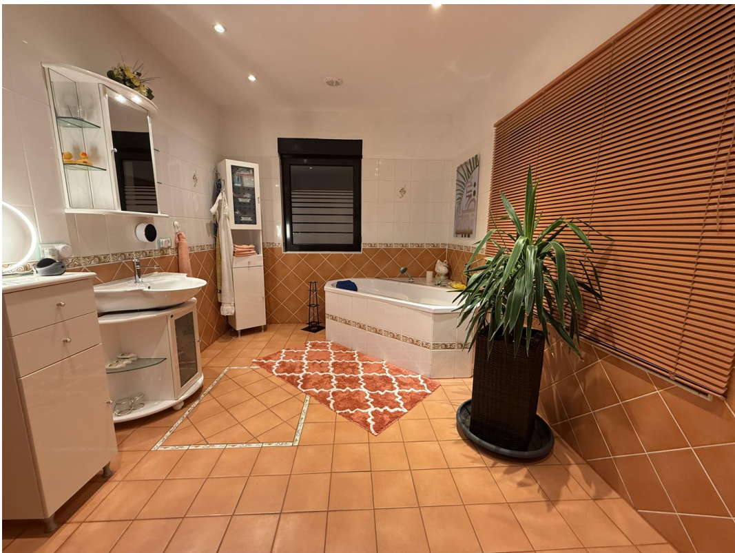
Wannenbad 1. OG Abends