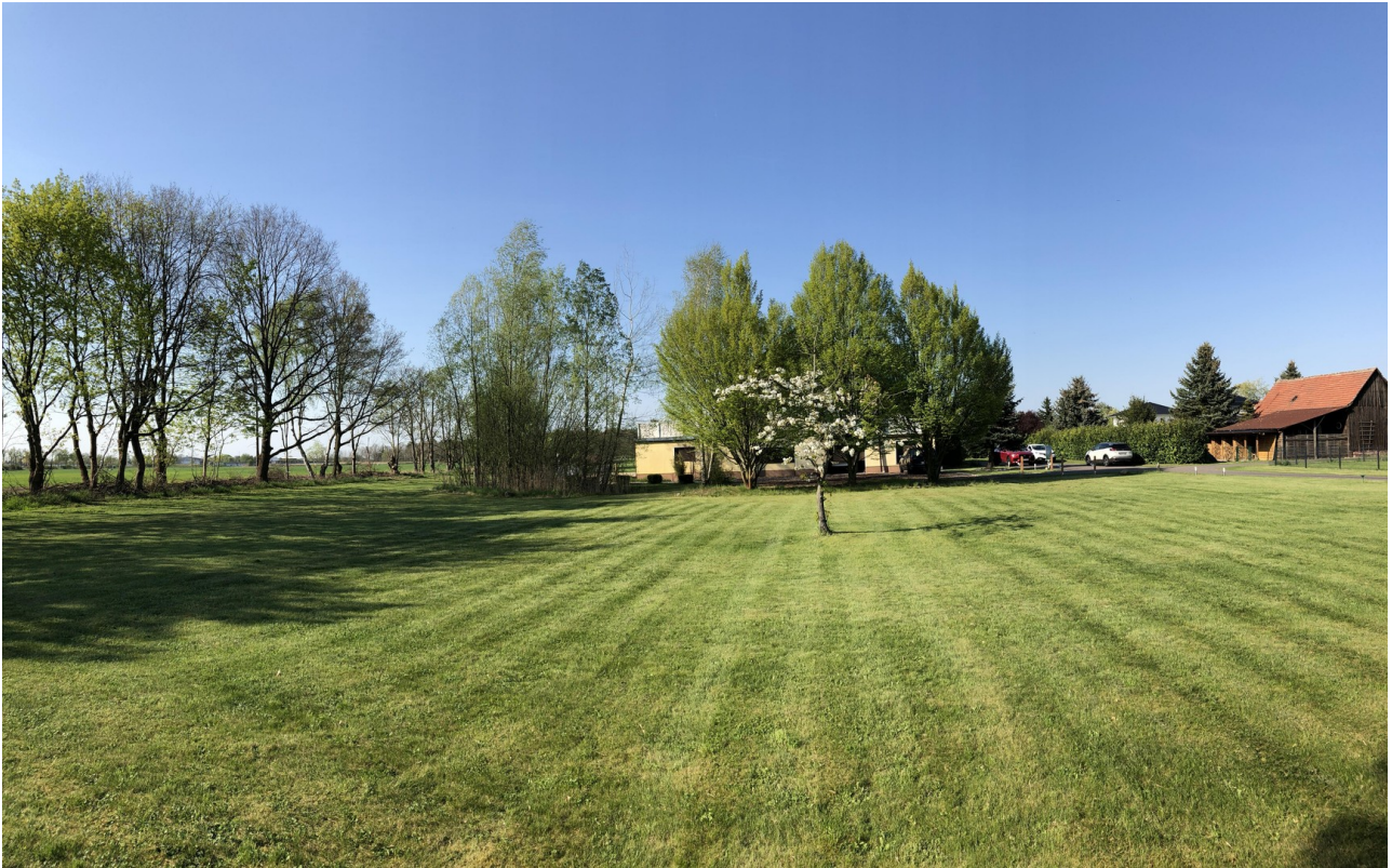
Grundstück vor Villa