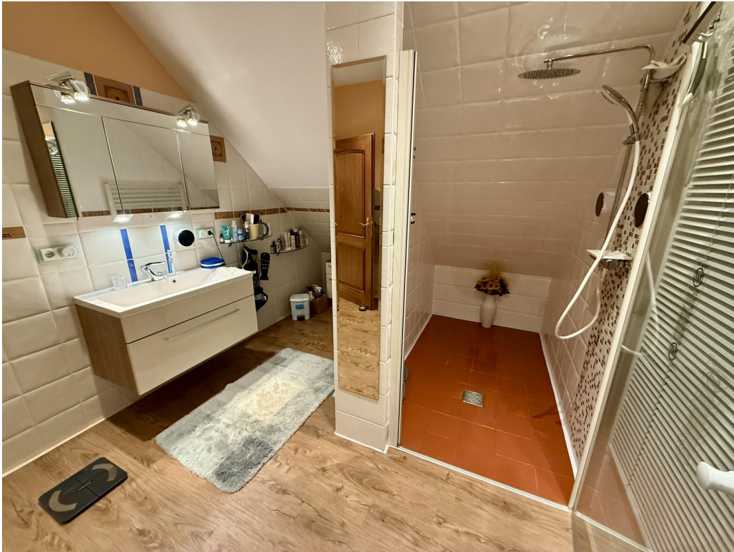
Duschbad 2. OG Abends