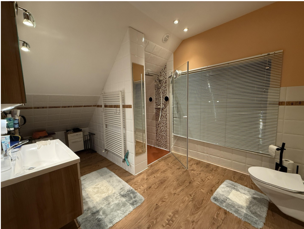
Duschbad 2. OG Abends