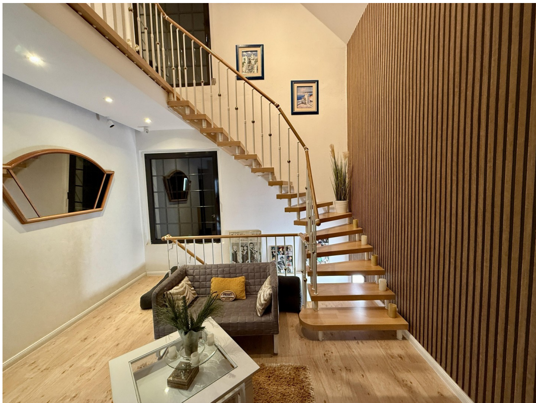
Aufgang zur Galerie