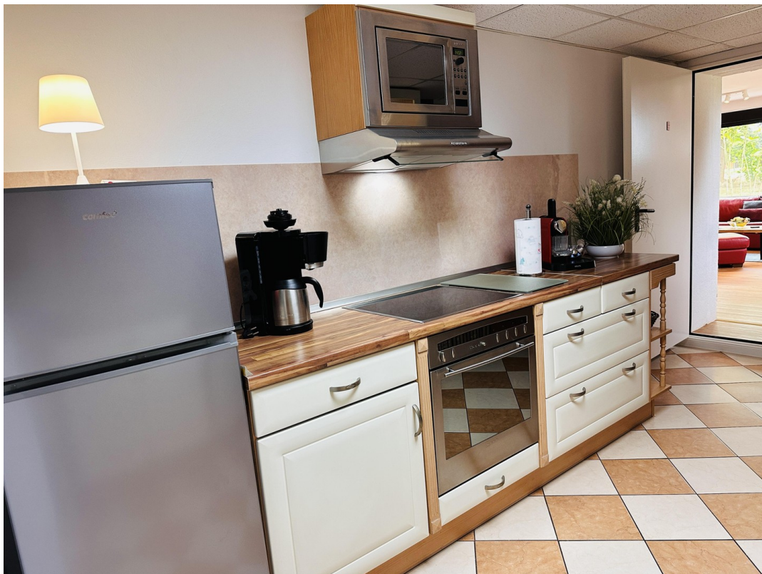
Alno Küche Ferienwohnung