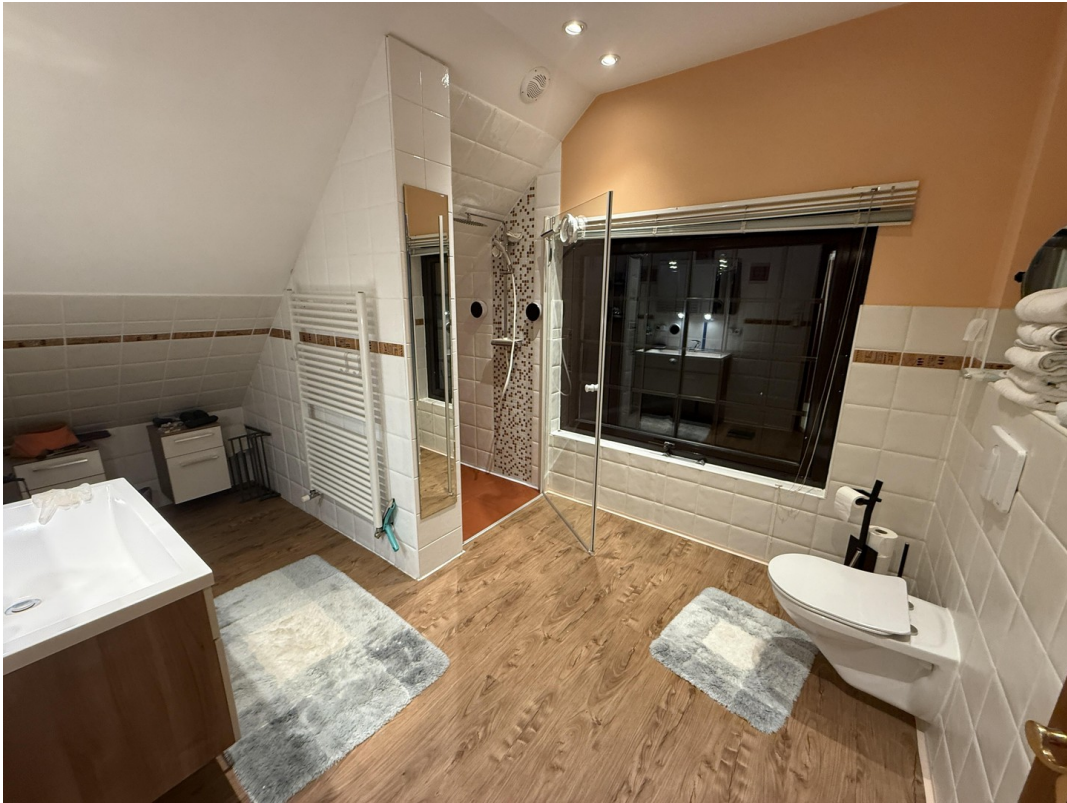
Duschbad 2. OG Abends