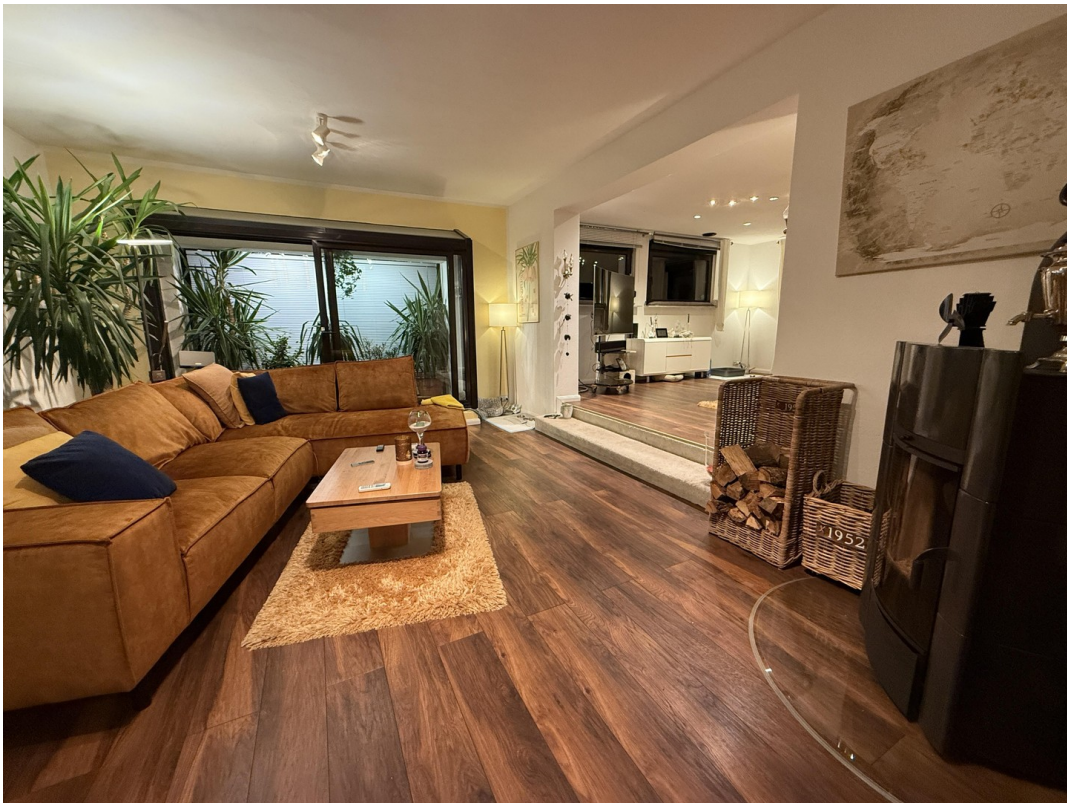
Wohnzimmer 1 Abendstimmung