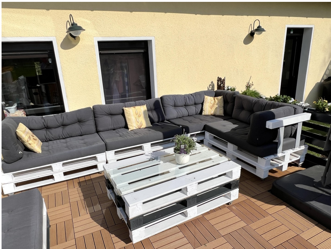
Westterrasse Wohnzimmer 2