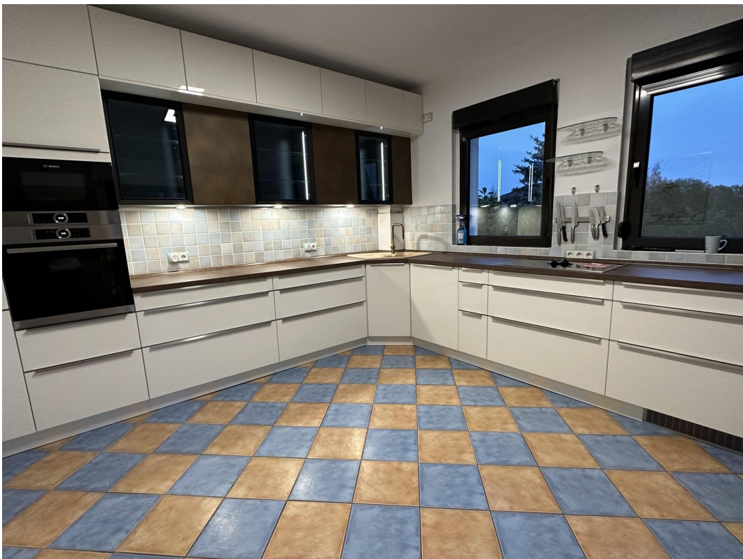
Musterring / Nolte Küche