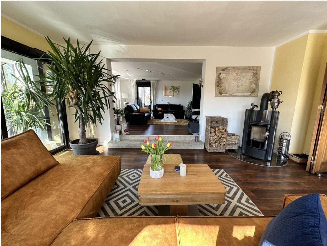
Wohnzimmer 1 / Wohnzimmer 2