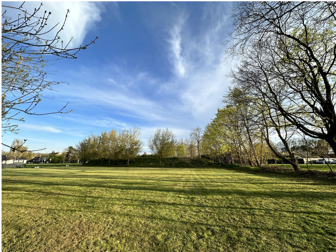
Grundstück vor Villa