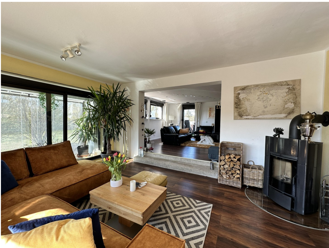
Wohnzimmer 1 mit Kamin