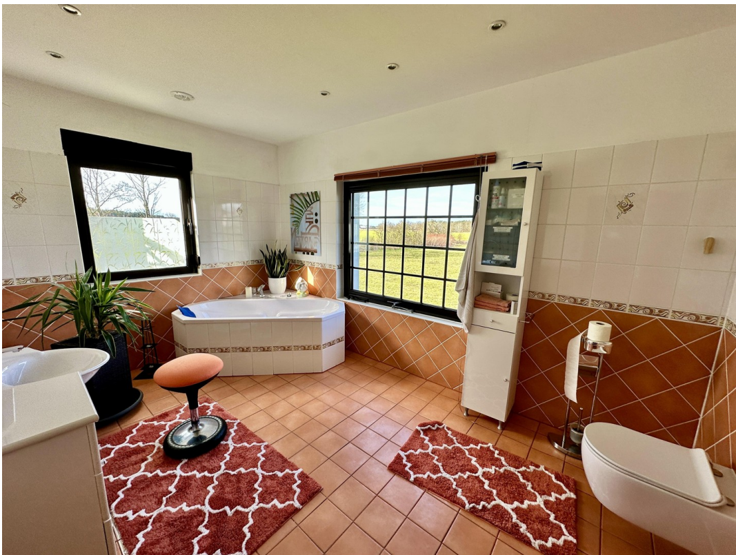
Wannenbad 1. OG