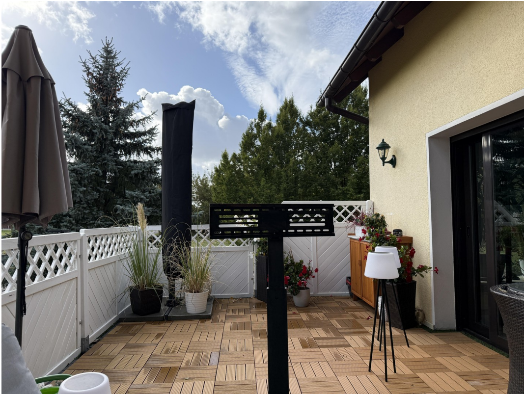
Ostterr. (Frühstks.terr.) 21qm