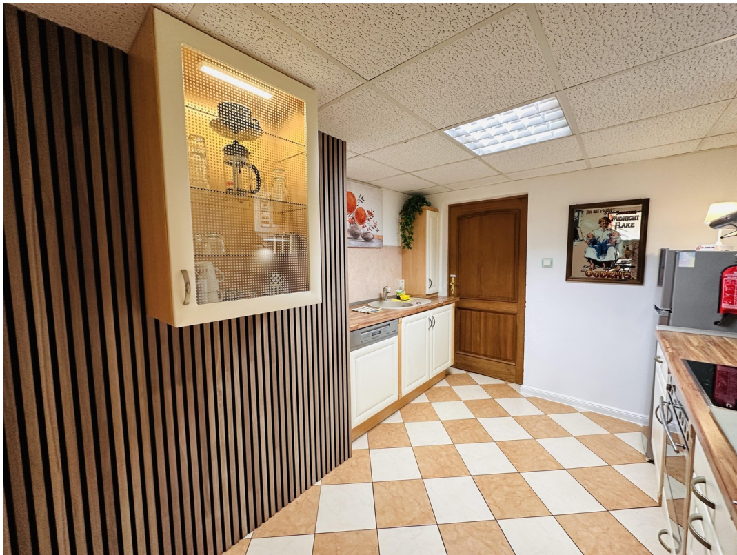
Alno Küche Ferienwohnung