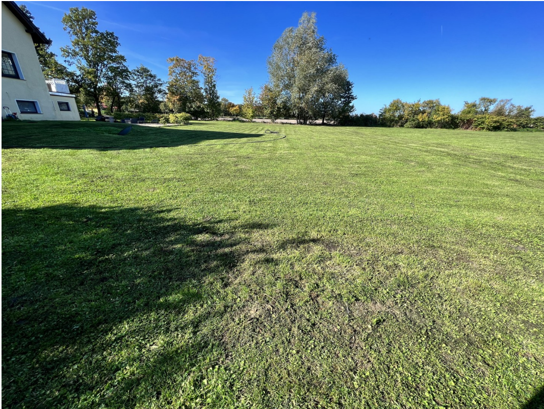
Grundstück hinter Villa