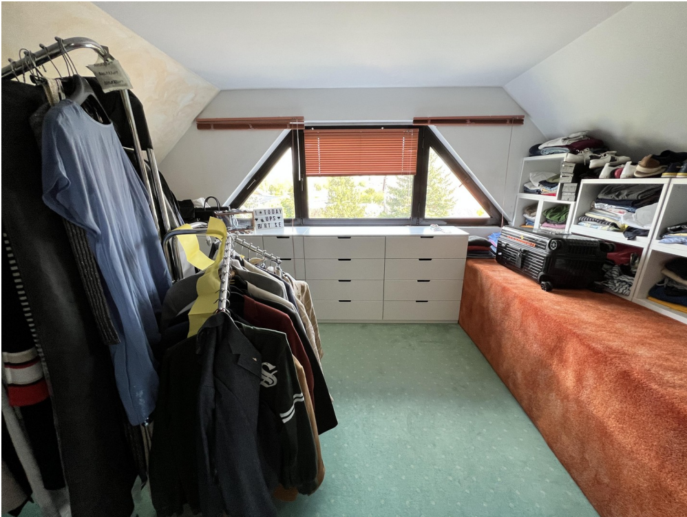
Ankleide / Ki.zimmer / Büro