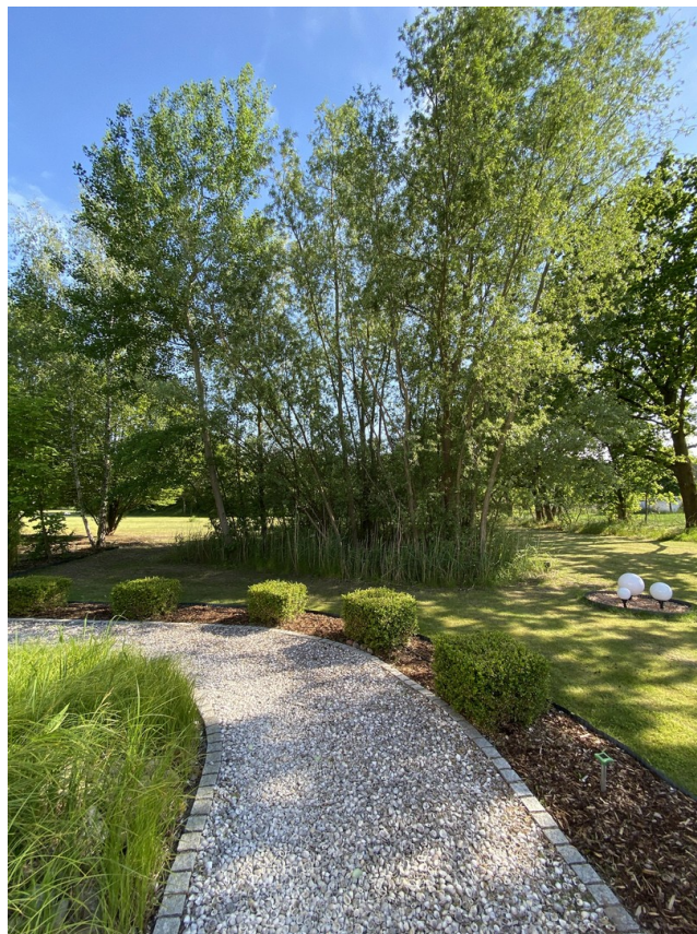
Muschelweg zur Ferienwohnung