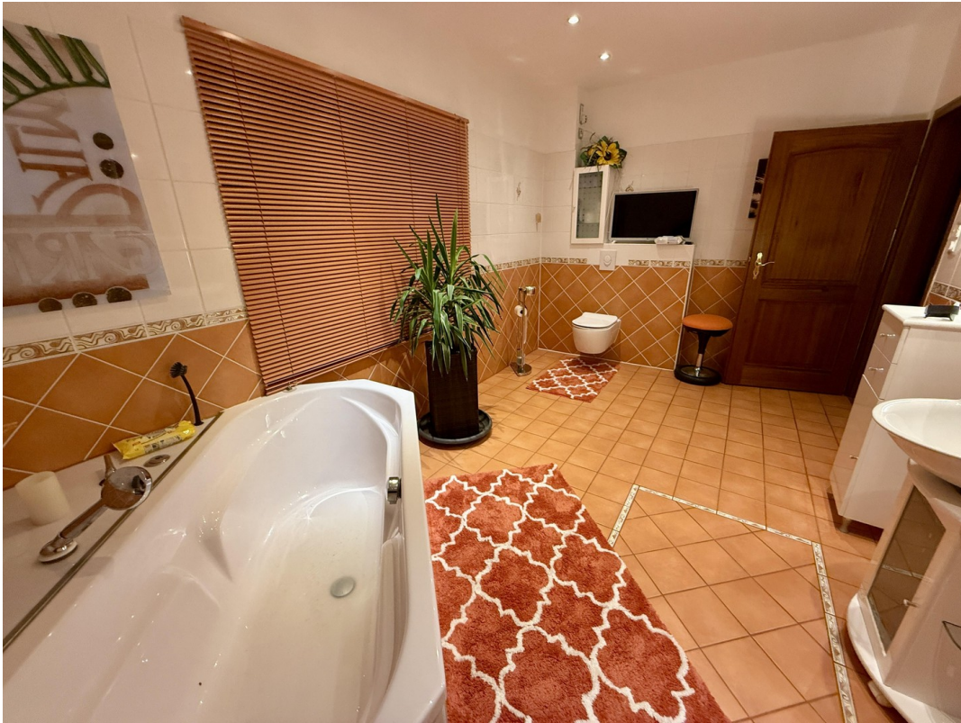
Wannenbad 1. OG Abends