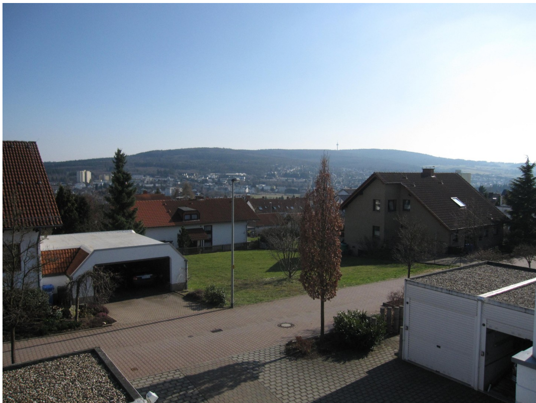
Fernblick von der Dachterrasse