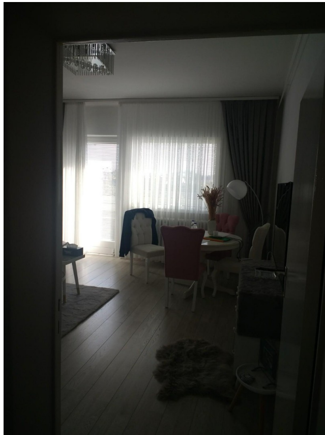
Wohnraum mit Balkon