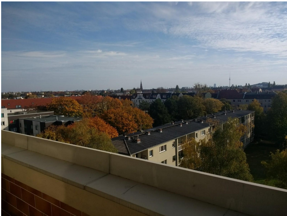
Blick vom Balkon nach Süden