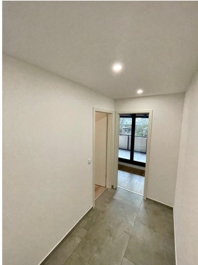
Flur 2 Bild2