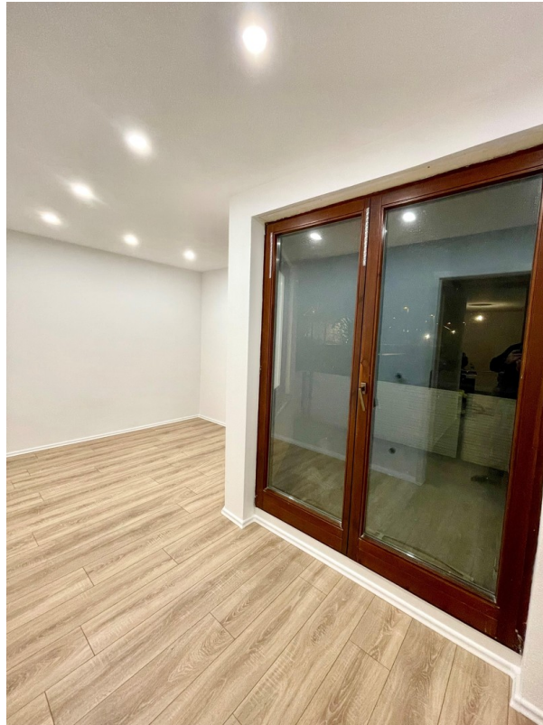
Büro / Zimmer4 Bild2