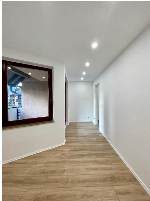
Büro / Zimmer 4 Bild1