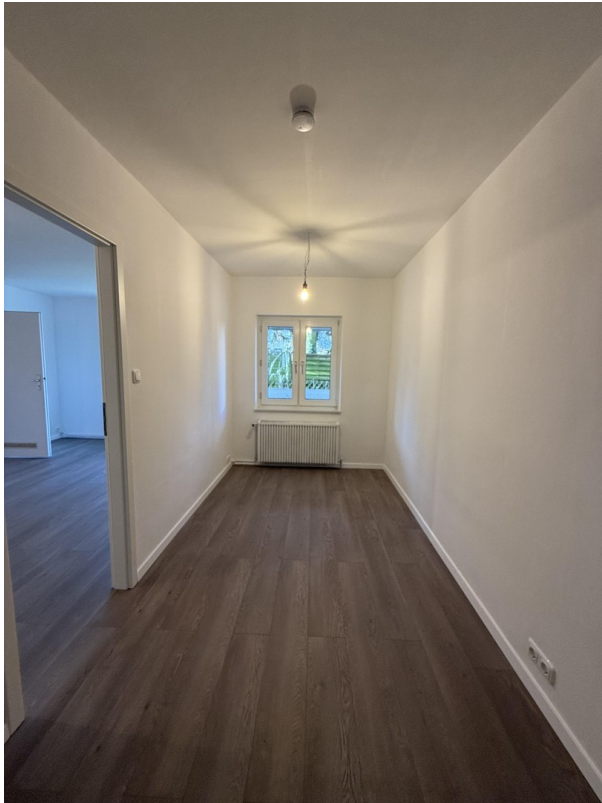
Homeoffice / Schlafzimmer 2