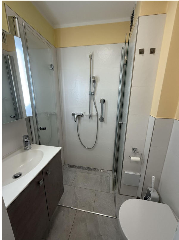
Dusche & Toilette