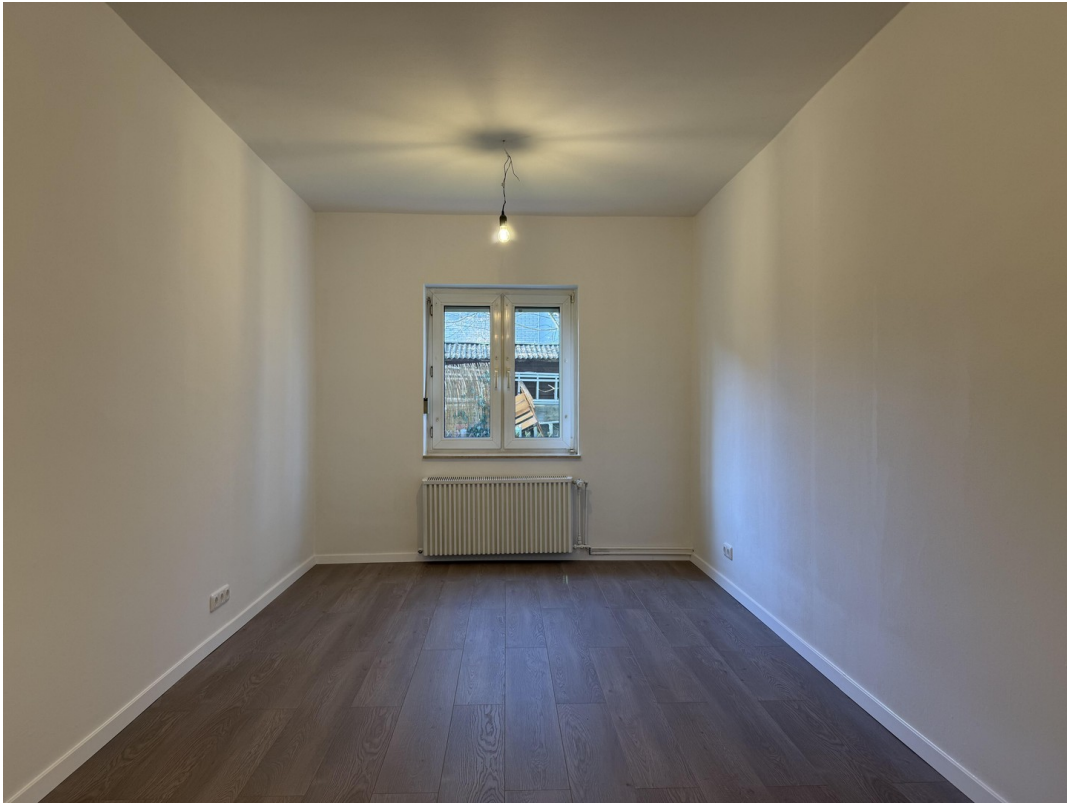
Schlafzimmer / Master Bedroom