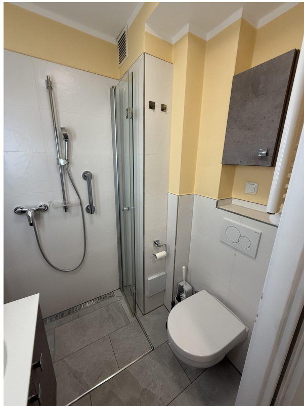
Dusche & Toilette