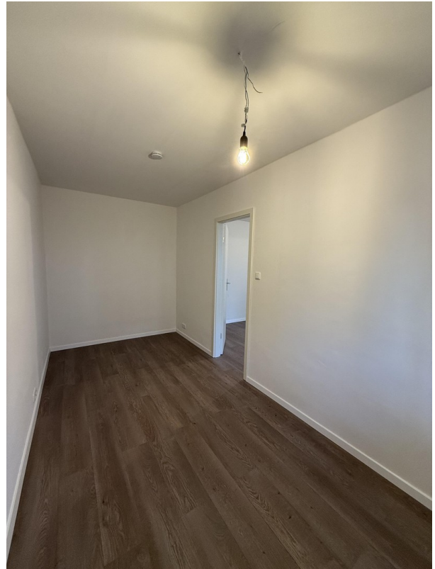
Homeoffice / Schlafzimmer 2