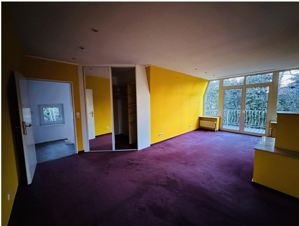
Zimmer 1. OG