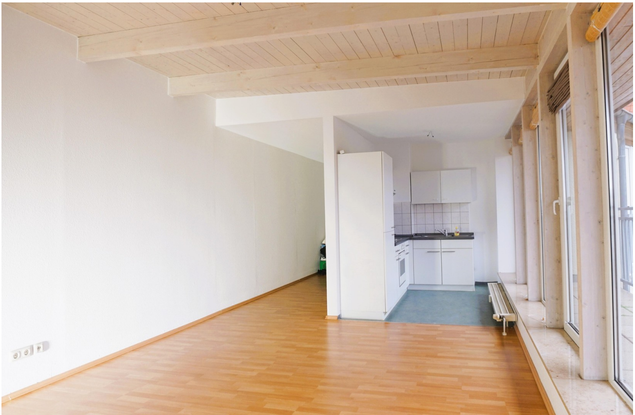
Wohnzimmer mit offener Küche