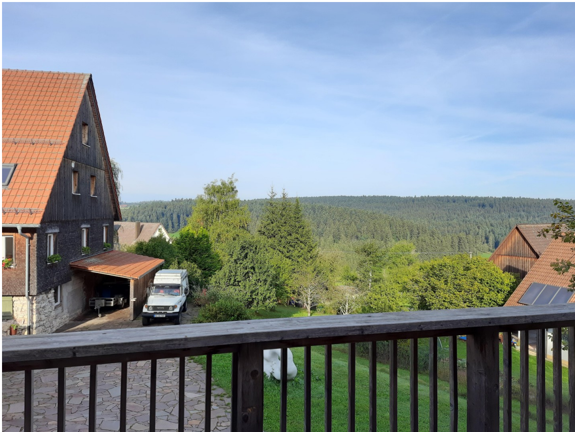
Blick vom neuen Balkon