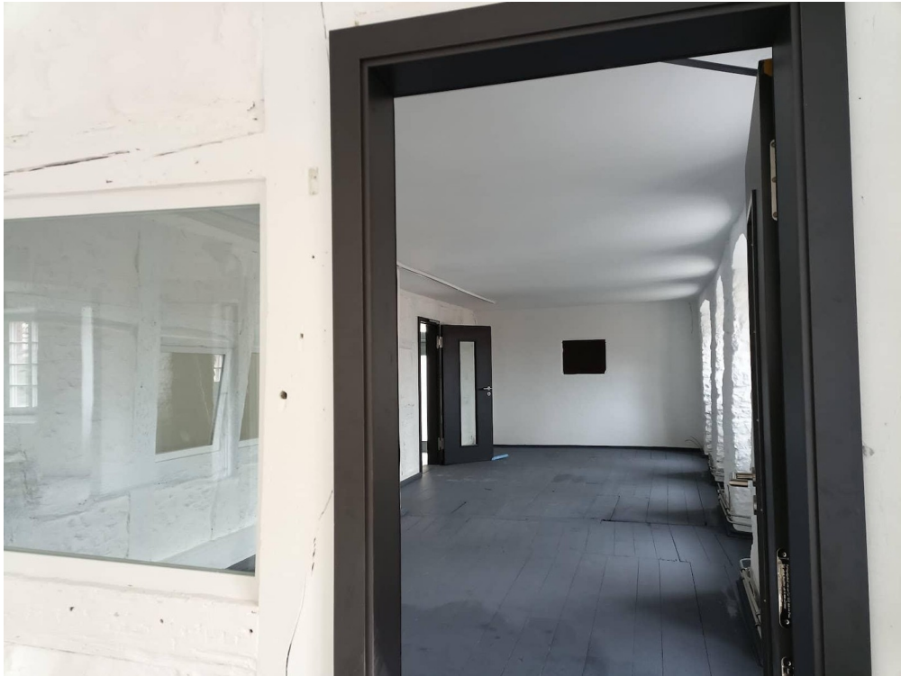
Durchgang zu Raum 5