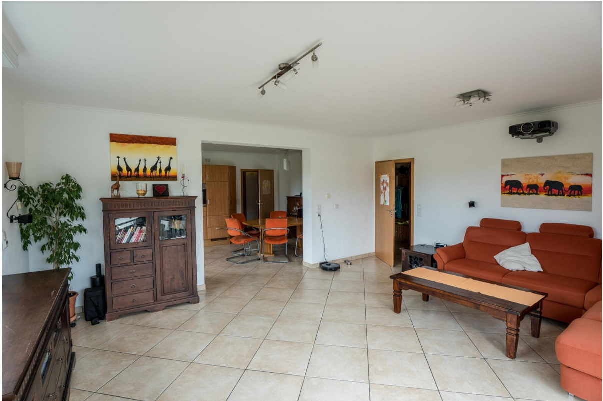
Wohnzimmer Blick in Küche