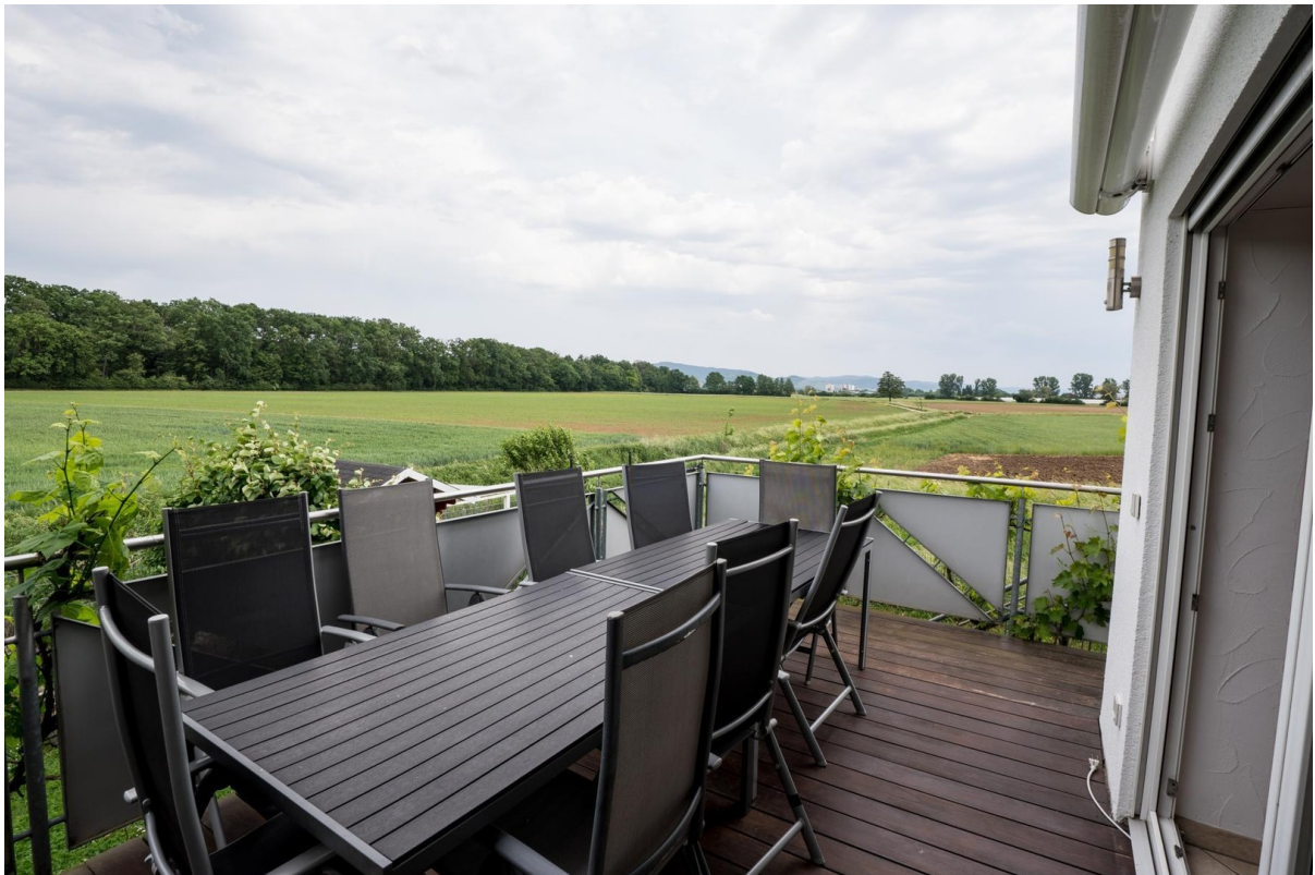
Balkon Blick Odenwald