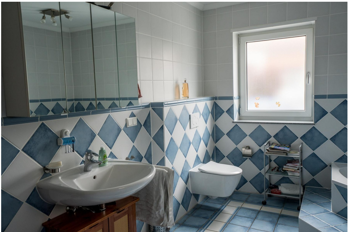
Bad EG Waschbecken