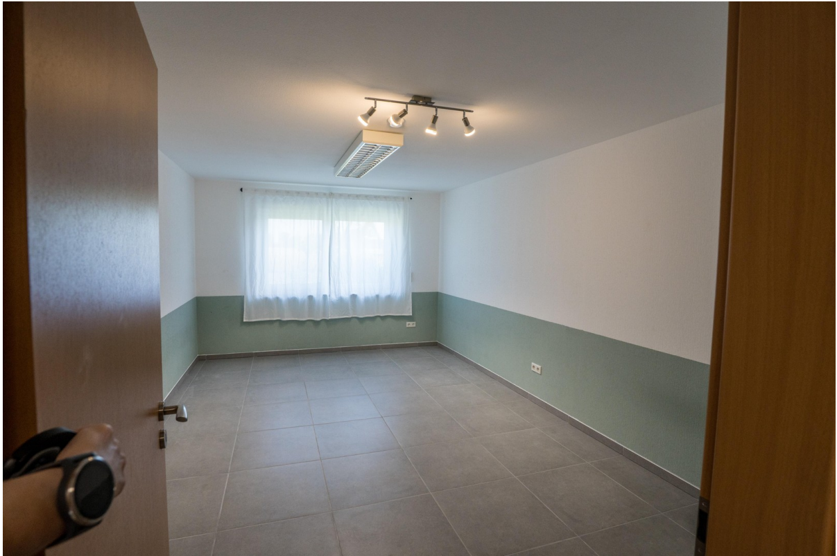
Zimmer UG neu gefliest