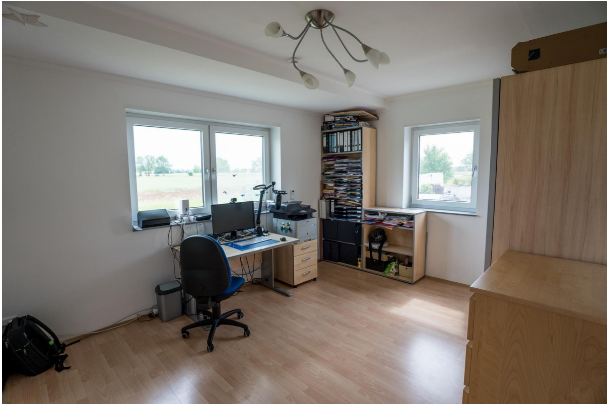
Zimmer EG / Büro