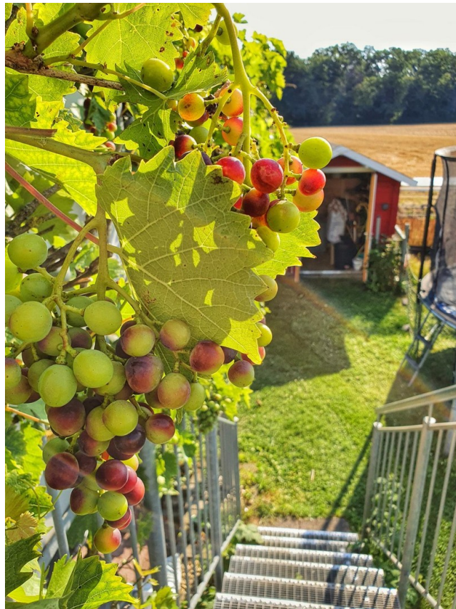
Trauben im Garten