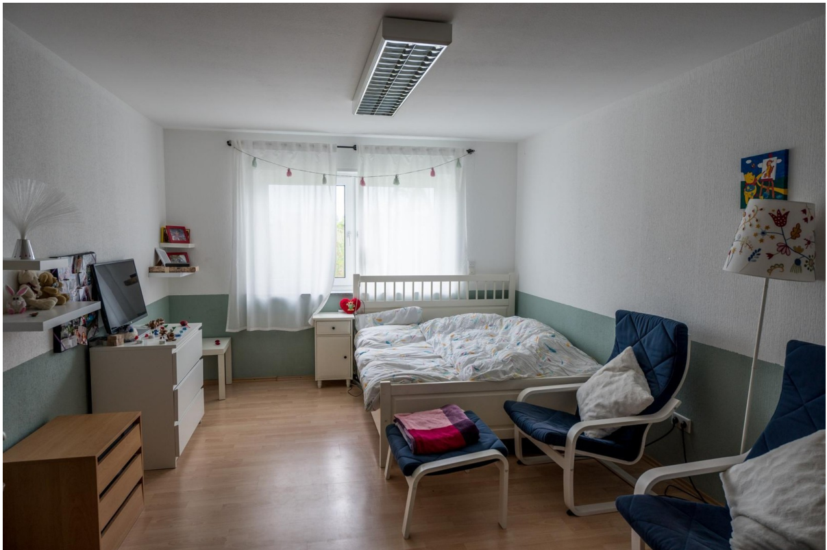
Zimmer UG / Kinderzimmer