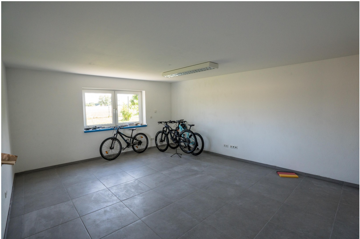
Zimmer UG / Mehrzweckraum