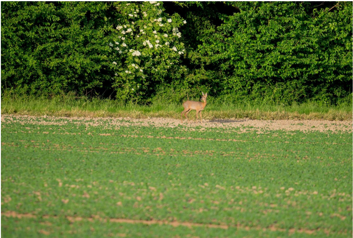
Reh in Sichtweite