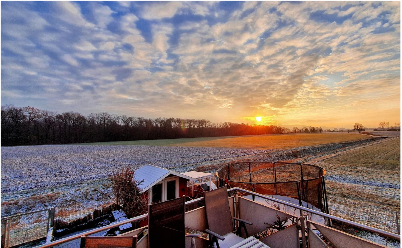
Ausblick vom Balkon