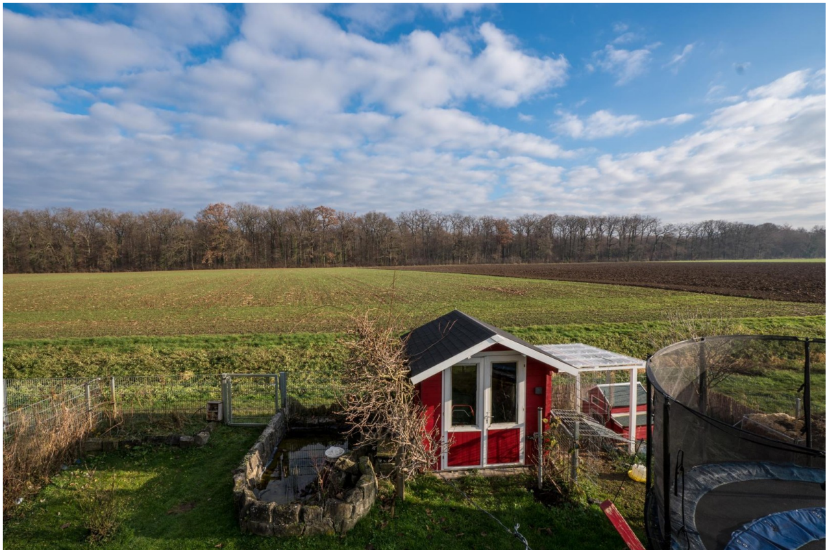
Blick von Balkon in Garten