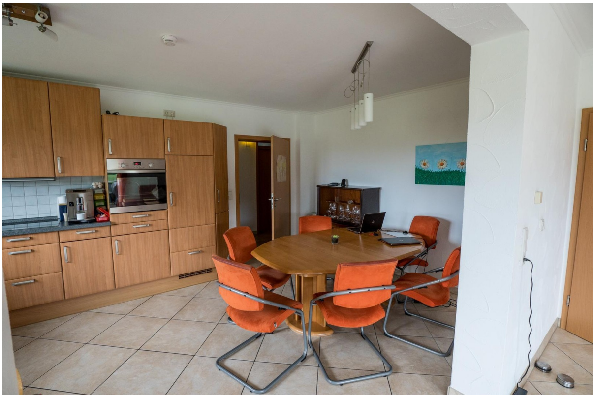
Küche /Esszimmer EG