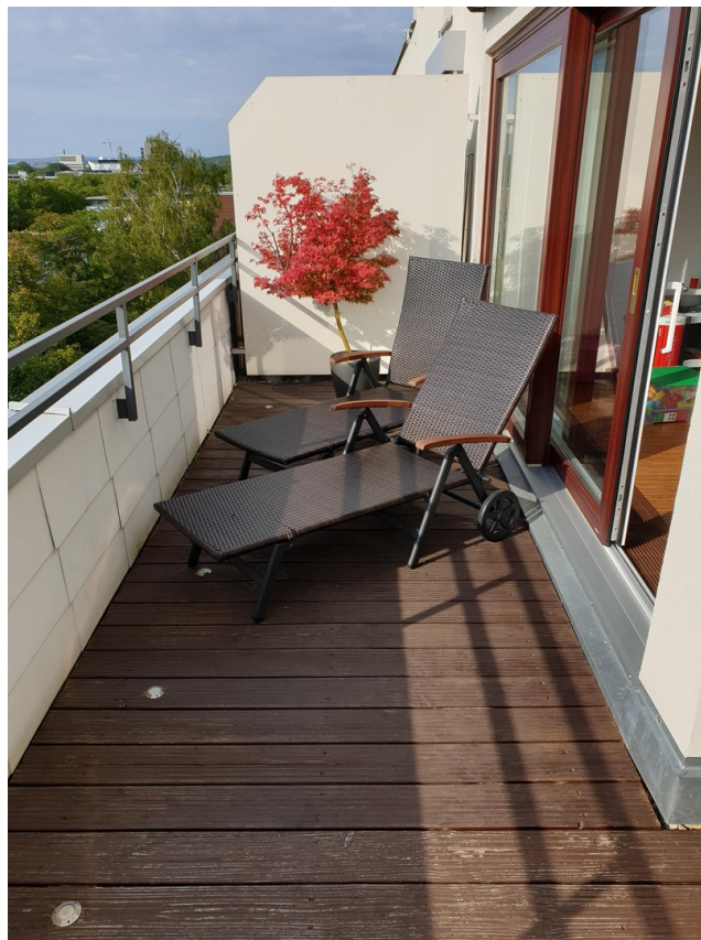
Dachterrasse 6. OG