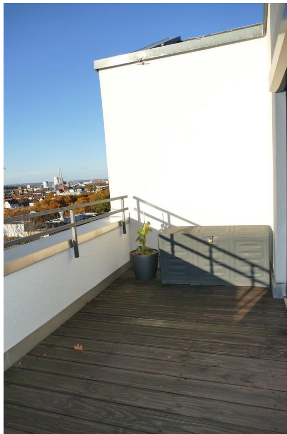
Dachterrasse 7. OG