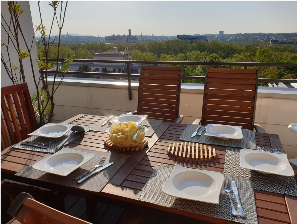
Dachterrasse 6. OG