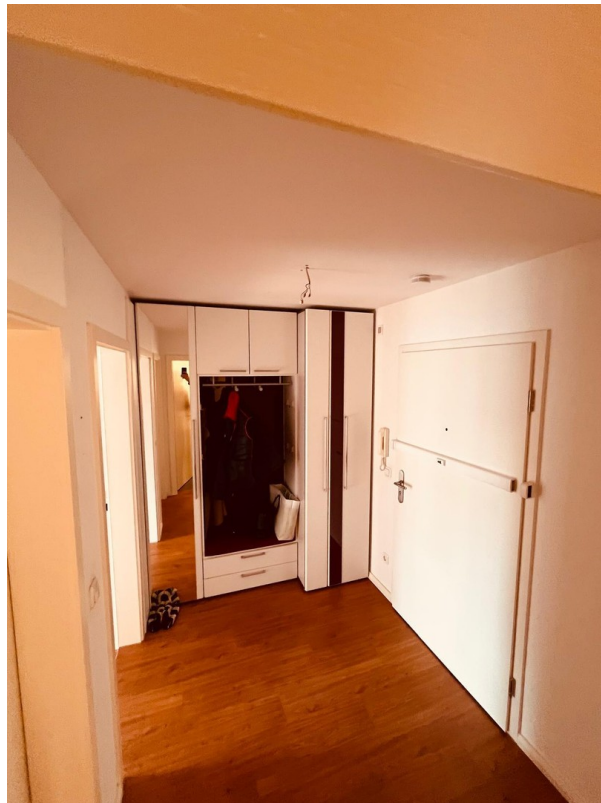
Mittelgang mit Einbauschränk