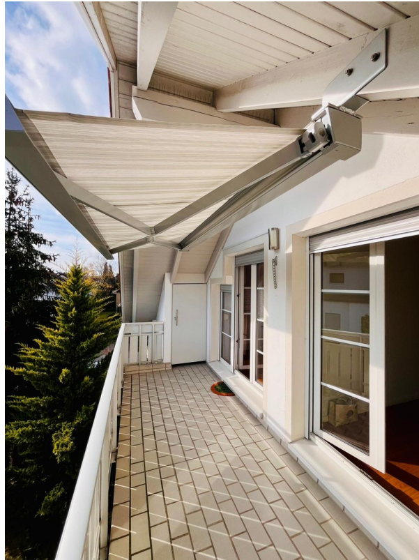
Balkon + Markise