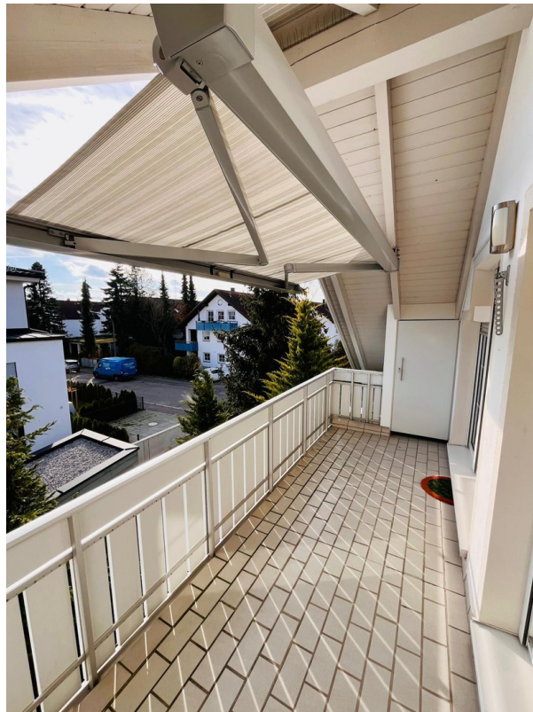
Balkon + Markise