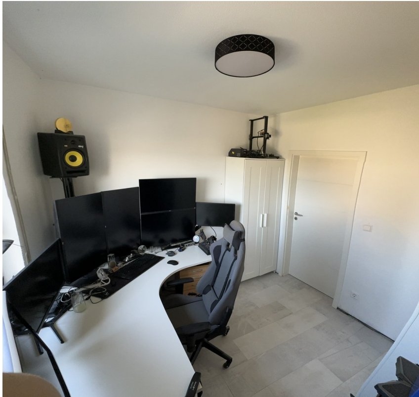
Kinderzimmer / Arbeitszimmer