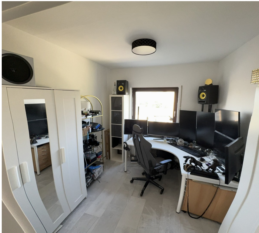
Kinderzimmer / Arbeitszimmer