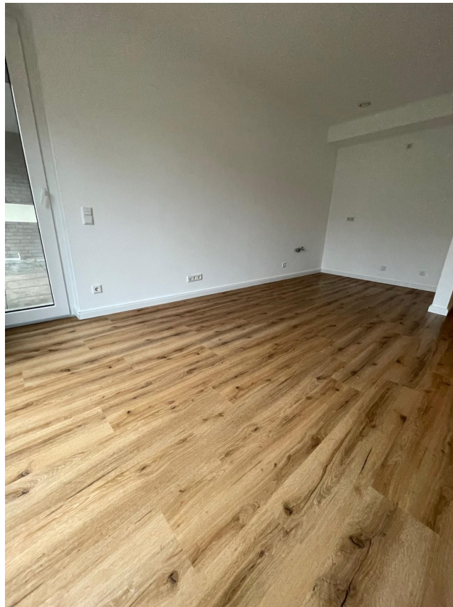
Wohnzimmer ohne Möbel