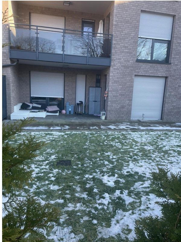
Terrasse mit Grünfläche