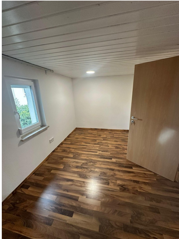
Kinderzimmer 1 OG