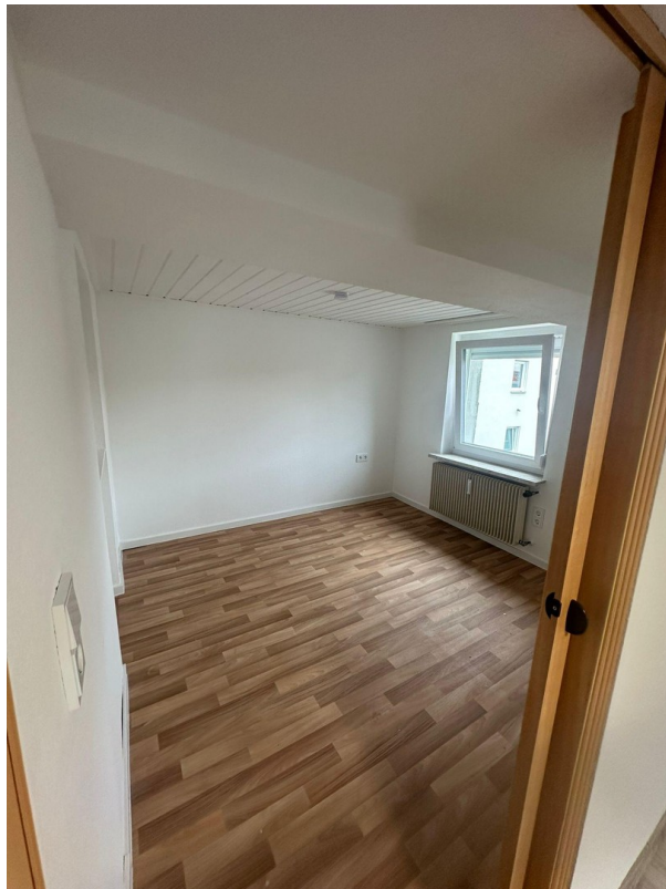
Kinderzimmer 2 OG