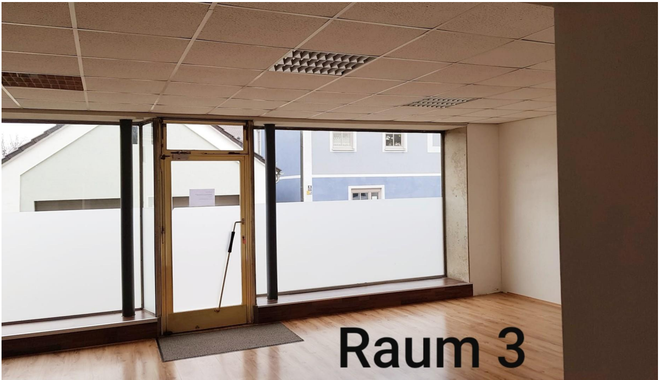
Raum 3, 51,23 qm, Flur links