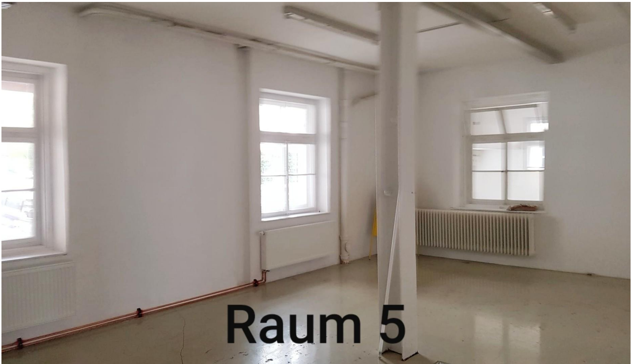
Raum 5, 47,17 qm, Flur rechts