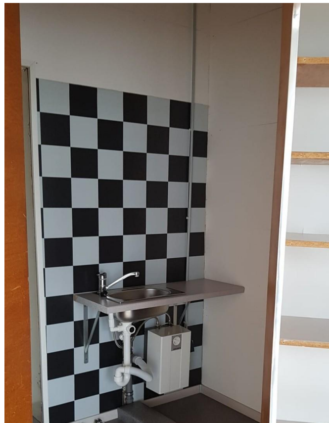
Teeküche 2 qm, eigener Zugang