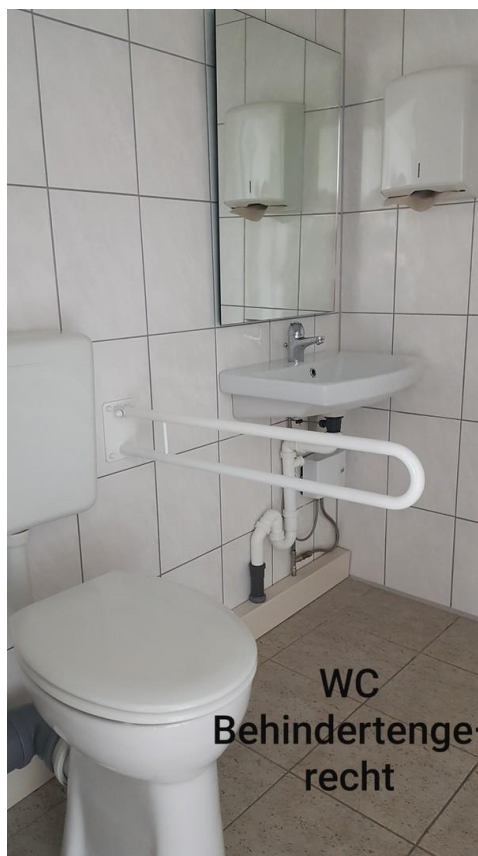
WC Behindertengerecht, 3,80 qm