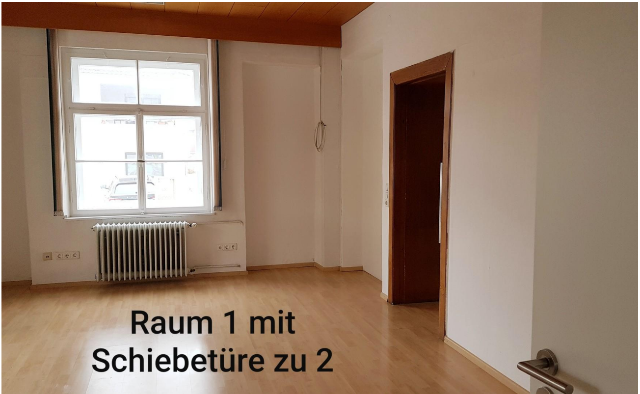
Raum1 Schiebetüre zu Raum 2