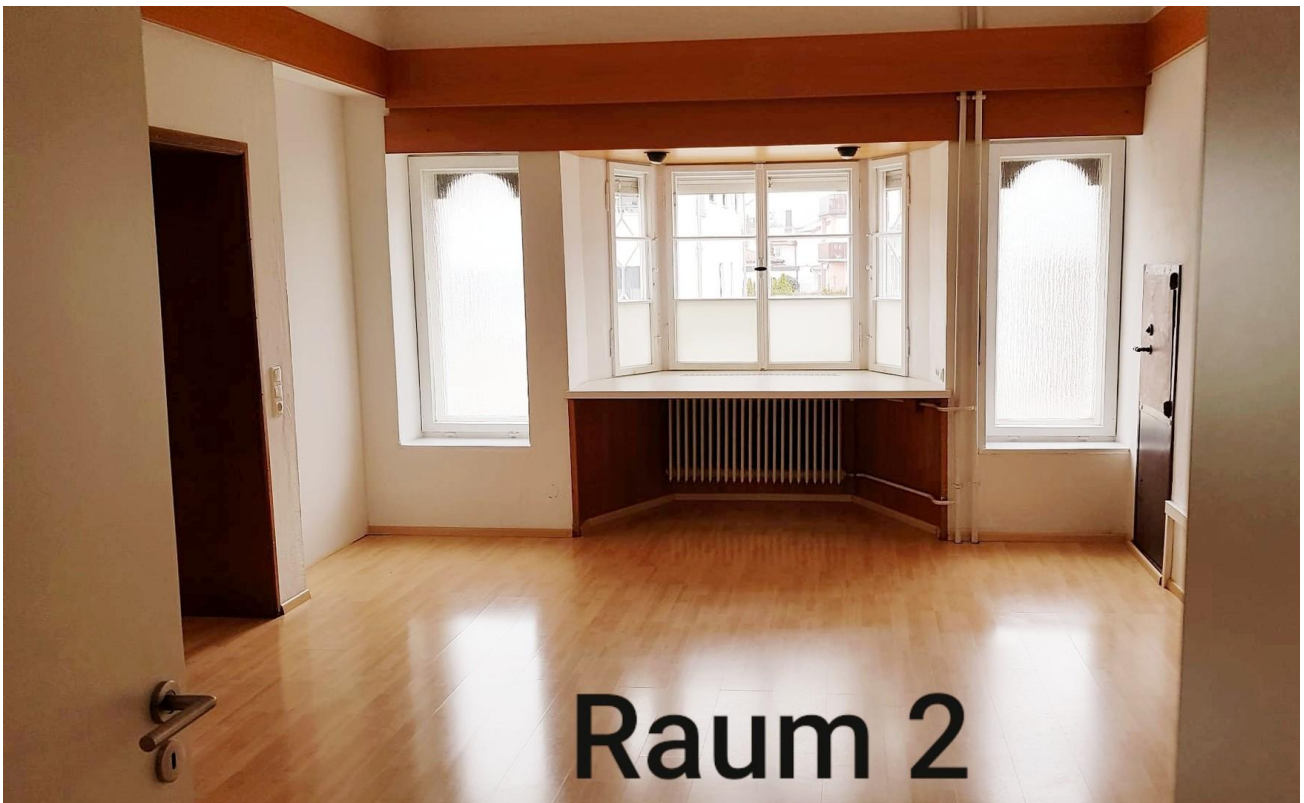
Raum 2, 21,04 qm, Flur links