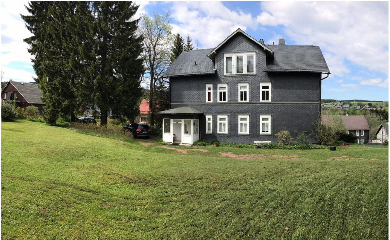
Hausansicht vom Garten