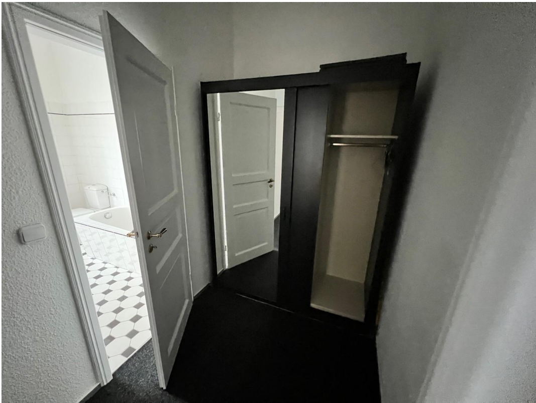
Kleiderschrank im Flur